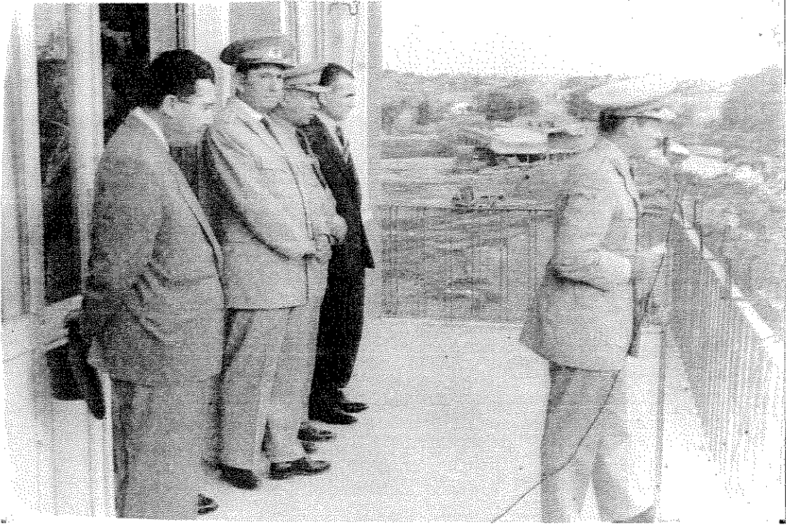
26 Eylül 1960 Lüleburgaz'da Halka Hitap Ederken