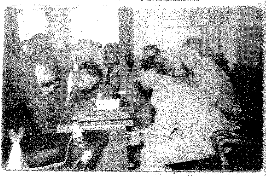
Trakya Bölgesinde Katıldığı Yurtgezisinde Basına Demeç Verirken