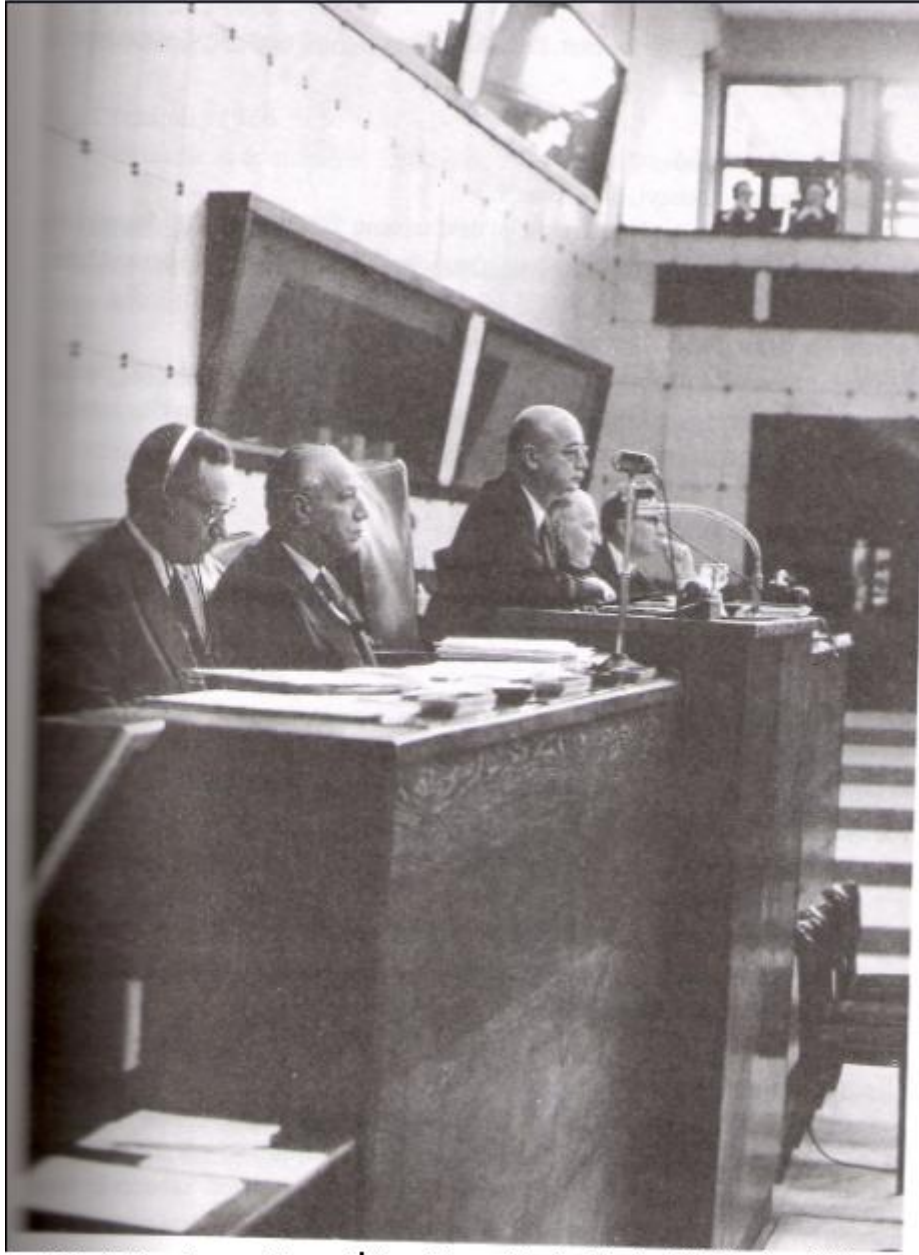
Nihat Erim, Avrupa Konseyi İstisari Assamblesine Başkanlık Ederken 1966