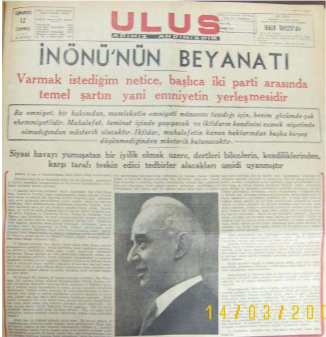
İsmet İnönü'nün 12 Temmuz Beyannamesi