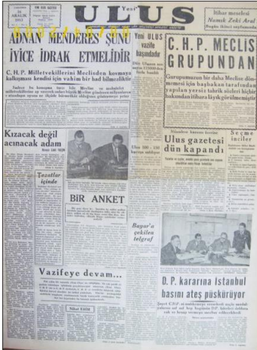
Yeni Uluş Gazetesi'nin İlk Sayısı Yeni Uluş - 16 Aralık 1953