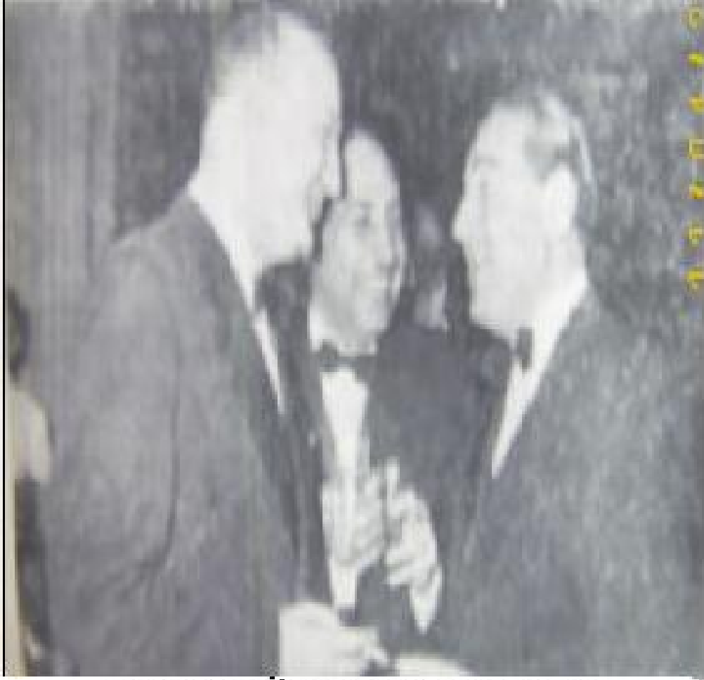
Nihat Erim İle Menderes Birlikte Halkçı - 03 Mart 1955