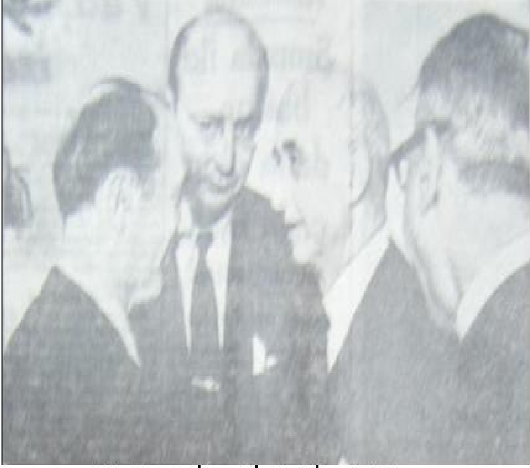
Nihat Erim İsmet İnönü İle Birlikte Ulus Gazetesi - 24 Temmuz 1947