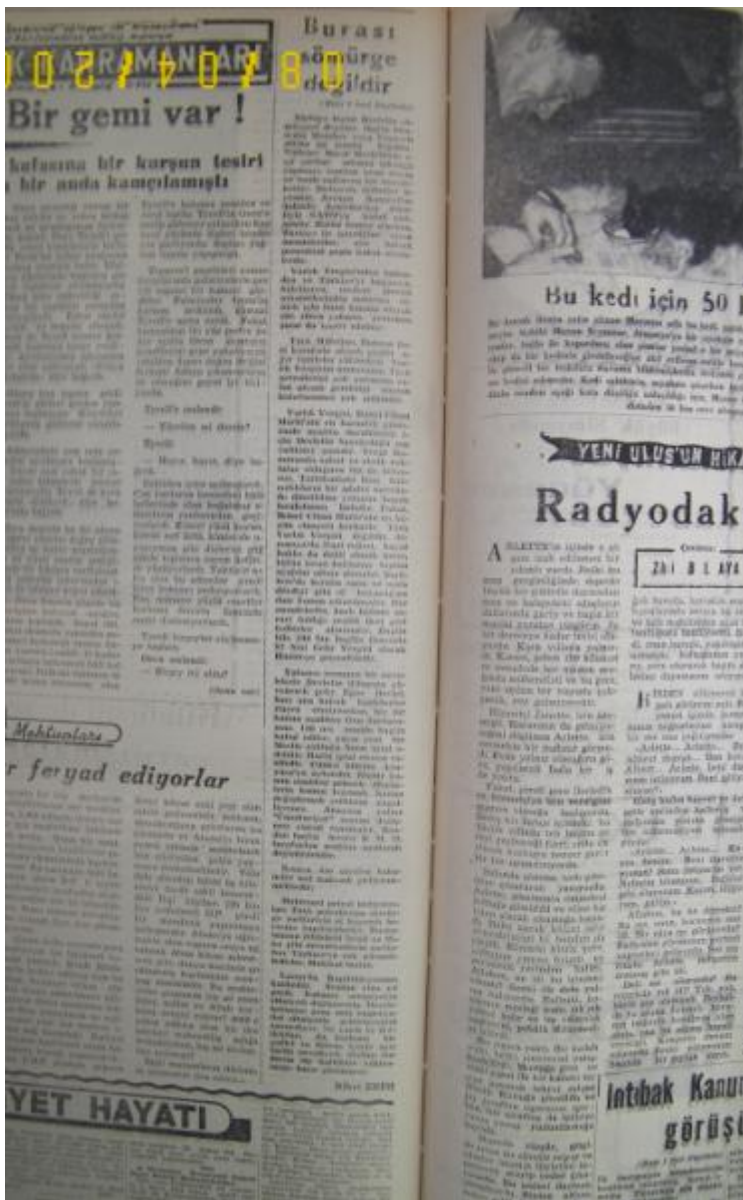
Nihat Erim'in DP'nin Ekonomi Politikasını Eleştiren Bir Makalesi Yeni Ulus – 12 Şubat 1954