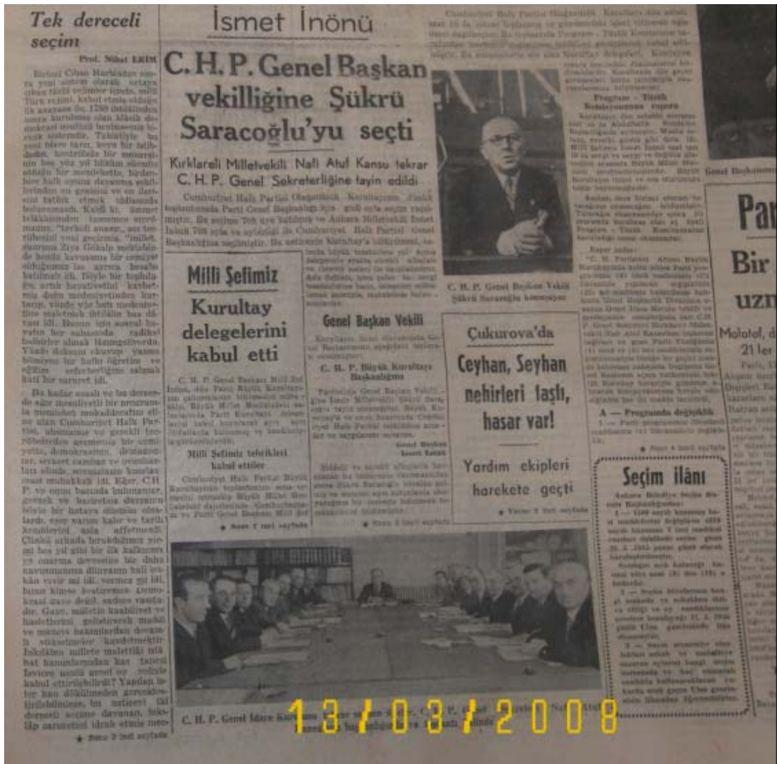
Nihat Erim'in Tek Dereceli Seçim Kanununa Dair Bir Makalesi