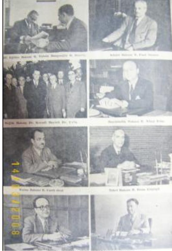
II. Hasan Saka Kabinesi Bayındırlık ve İskan Bakanı Nihat Erim Ulus Gazetesi - 16 Haziran 1948