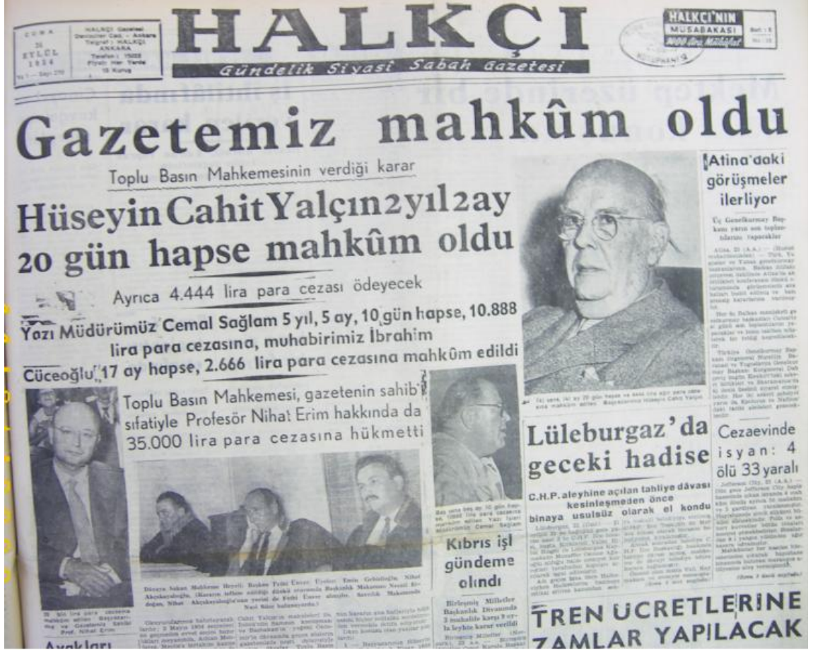
Nihat Erim ile Hüseyin Cahit Yalçın'ın Makalelerinden Dolayı Çarptırıldıkları Mahkûmiyet ve Para Cezalarıyla İlgili Olarak Halkçı Gazetesi'ndeki Manşet Halkçı – 24 Kasım 1954