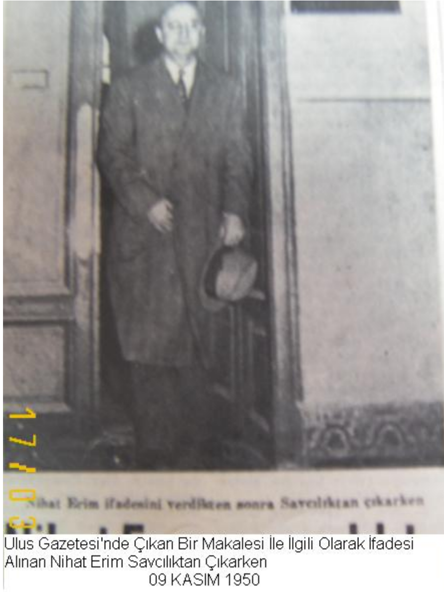
Ulus Gazetesi'nde Çıkan Bir Makalesi İle İlgili Olarak İfadesi Alınan Nihat Erim Savcılıktan Çıkarken 09 KASIM 1950