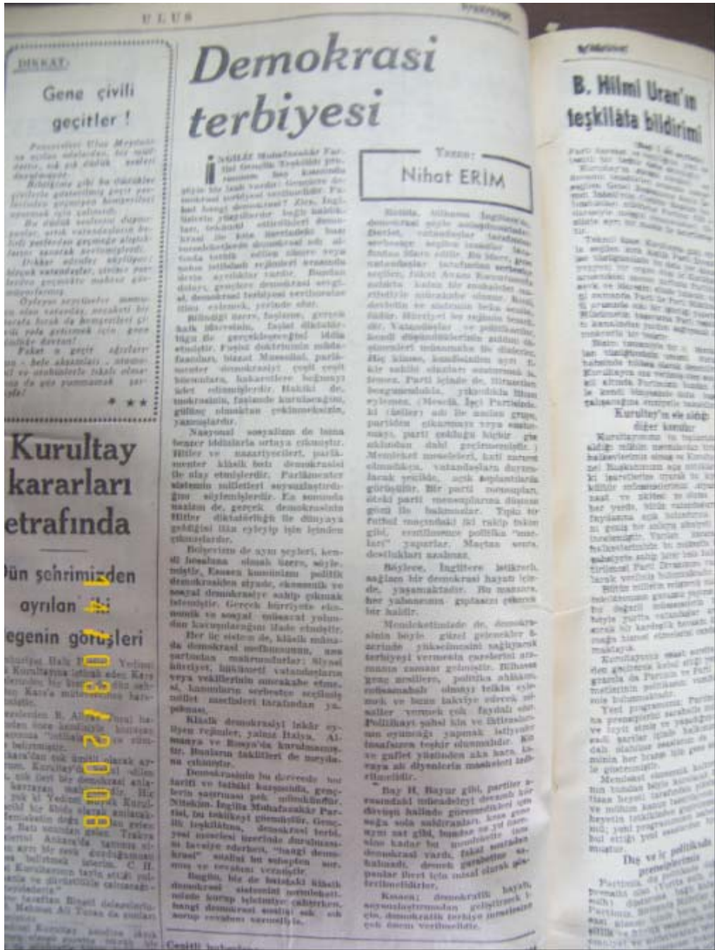
Nihat Erim'in Demokrasiyle İlgili Görüşlerini İçeren Bir Makalesi Ulus – 9 Aralık 1947