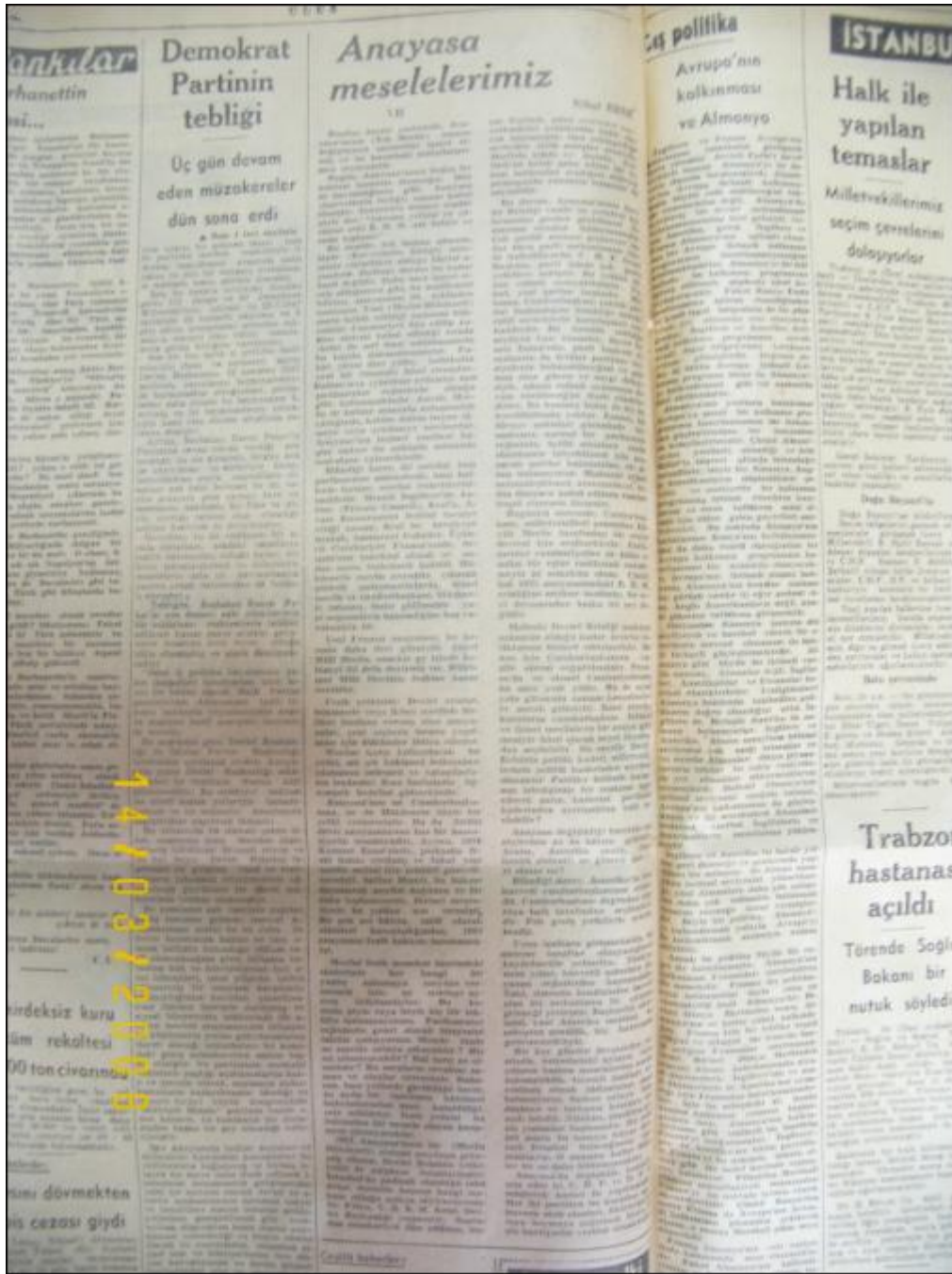
Nihat Erim'in Anayasa'yla İlgili bir Makalesi