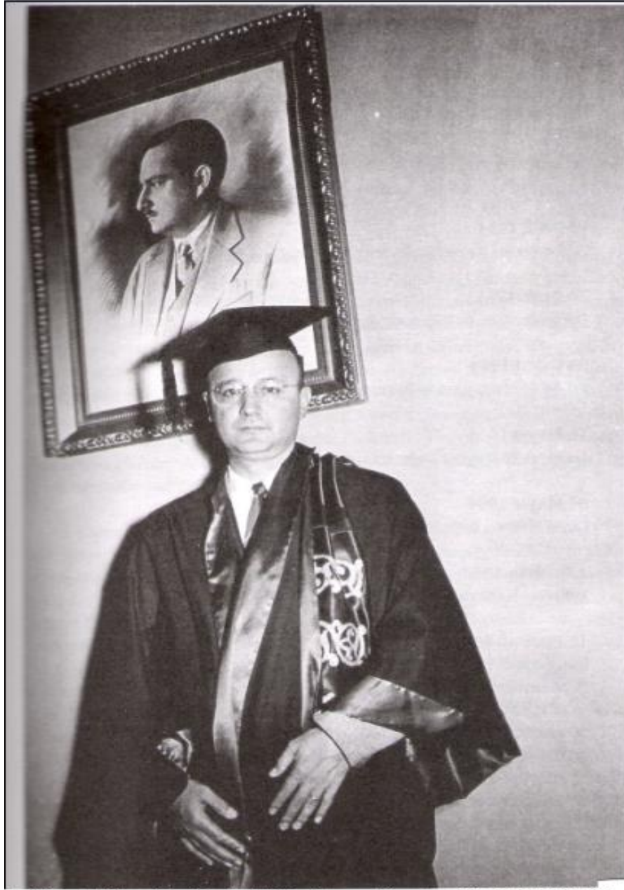
Nihat Erim Profesörlüğe Atandığında, 23 Eylül 1941 Günlükler 1925 - 1979