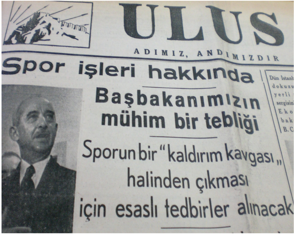
Ulus, 28 Temmuz 1937.