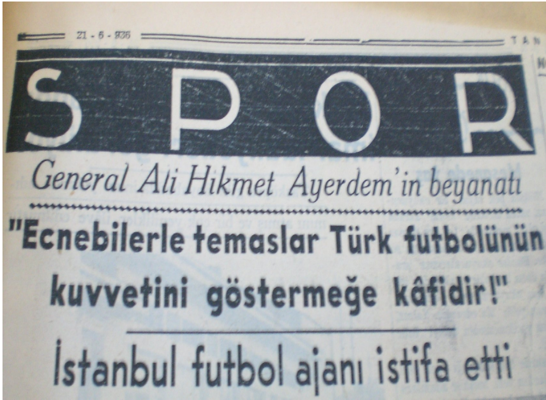
Tan, 21 Haziran 1936.