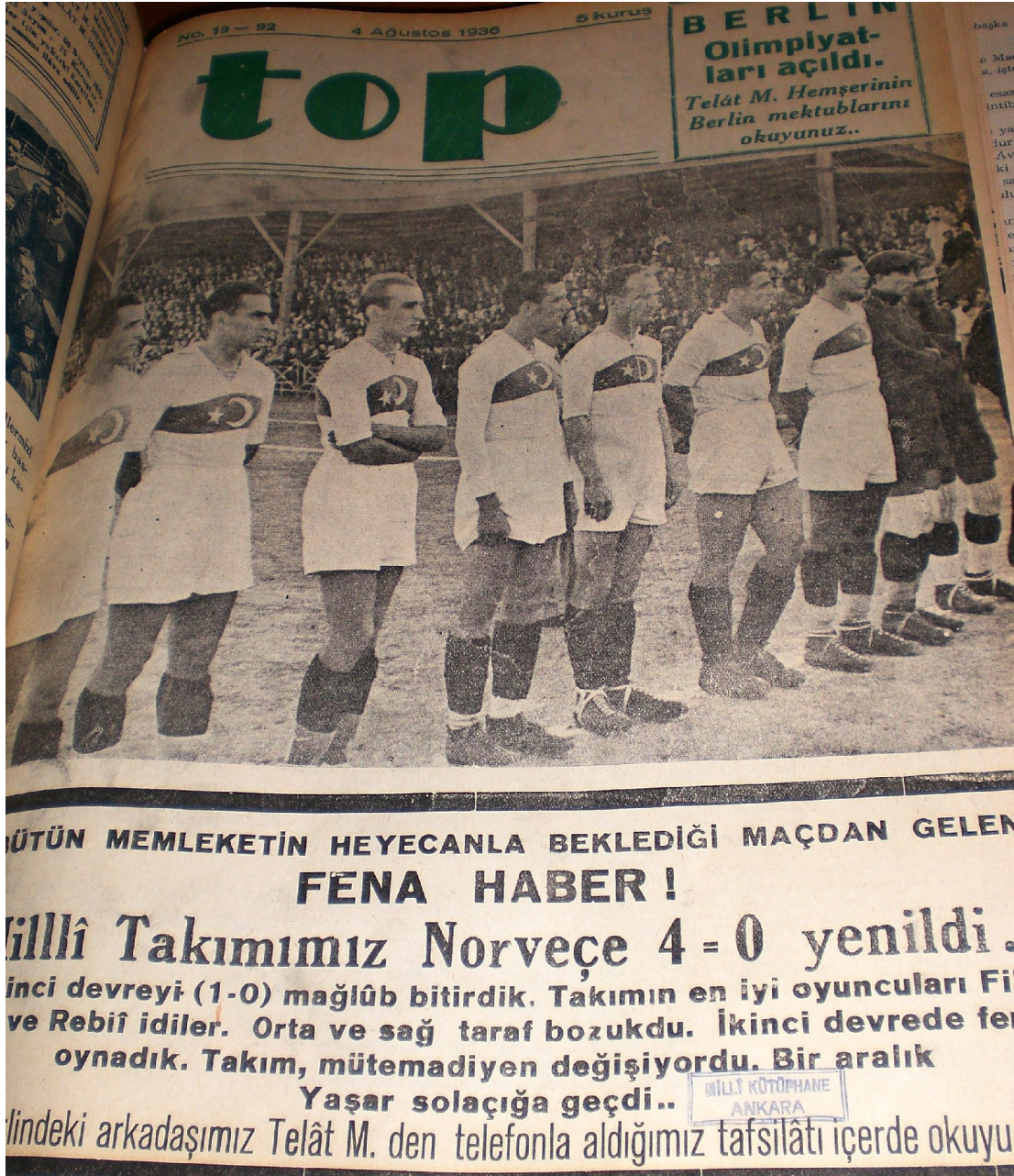
Top, 4 Ağustos 1936.