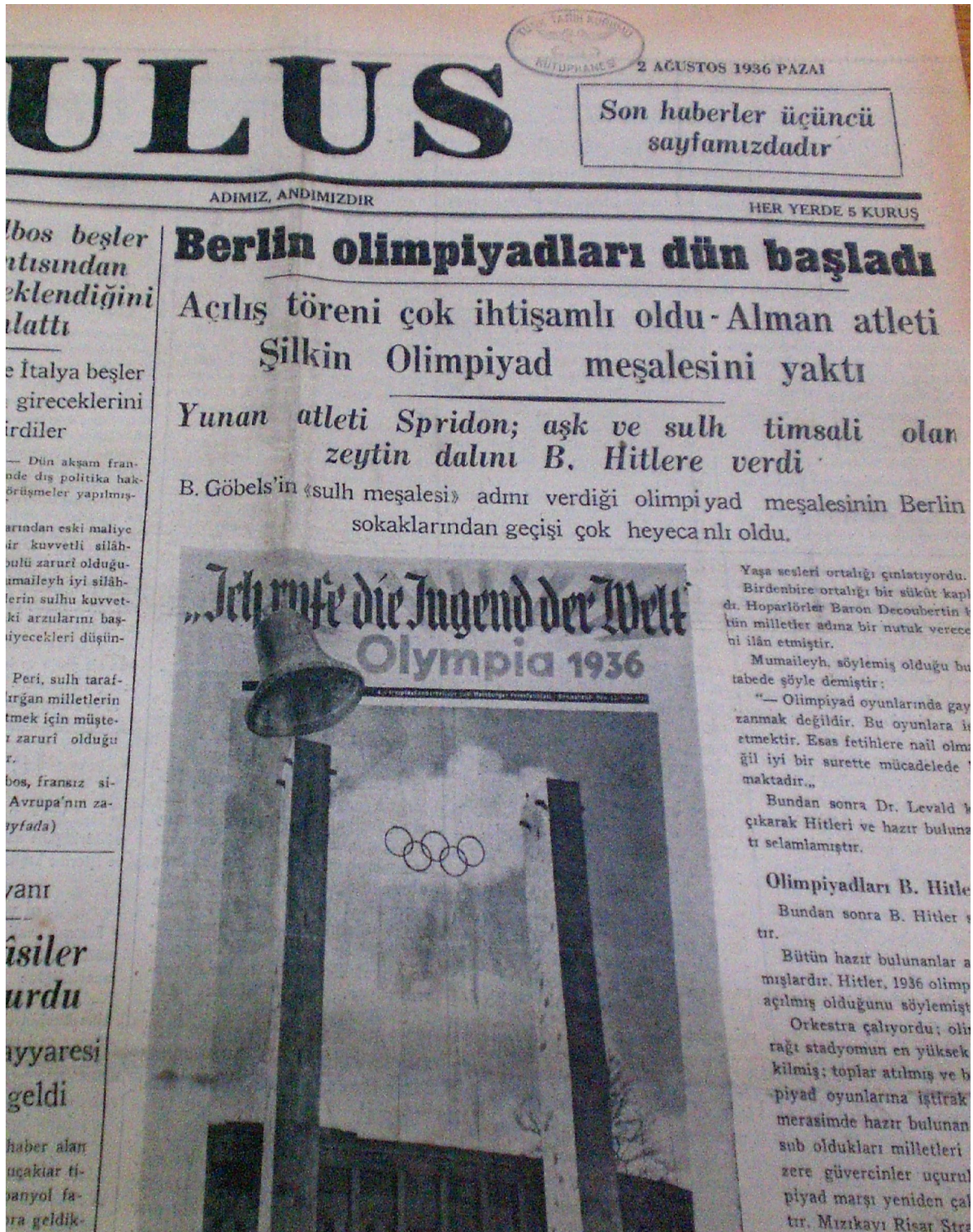
Ulus, 2 Ağustos 1936.