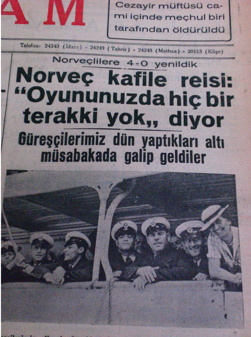
Akşam, 4 Ağustos 1936.