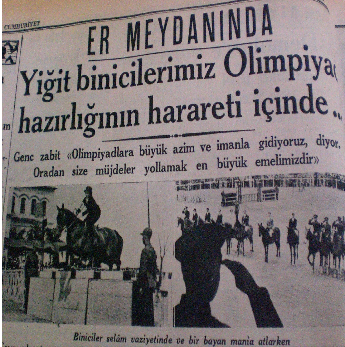
Cumhuriyet, 5 Temmuz 1936.