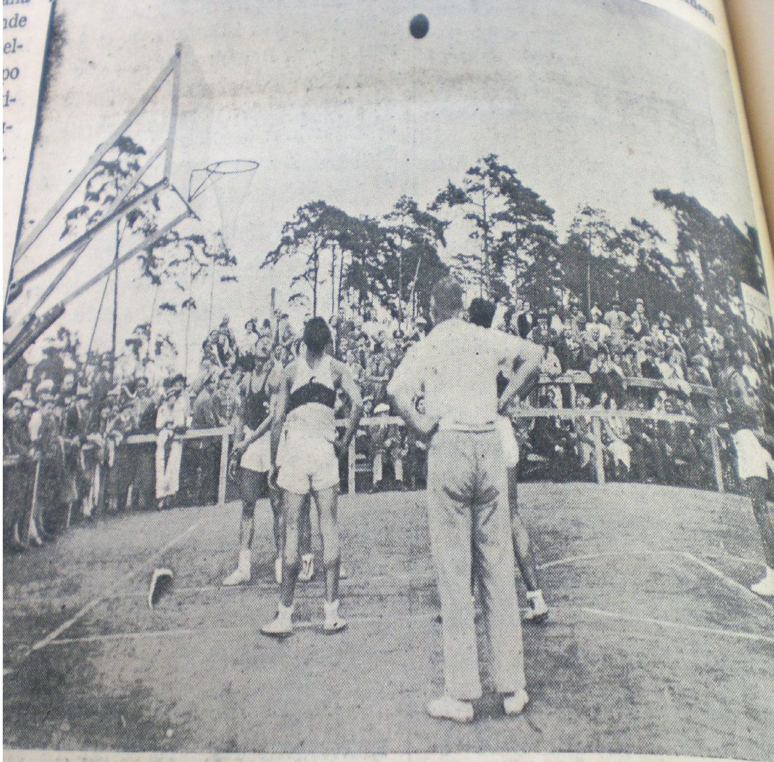
Türkiye - Mısır basketbol maçında kalemize favul atılırken