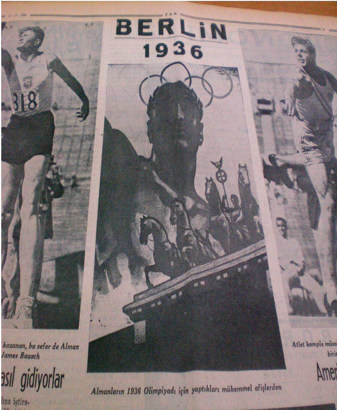
Tan, 1 Temmuz 1936.