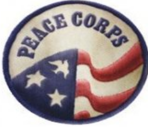
Barış Gönüllüleri Örgütü'nün Amblemi