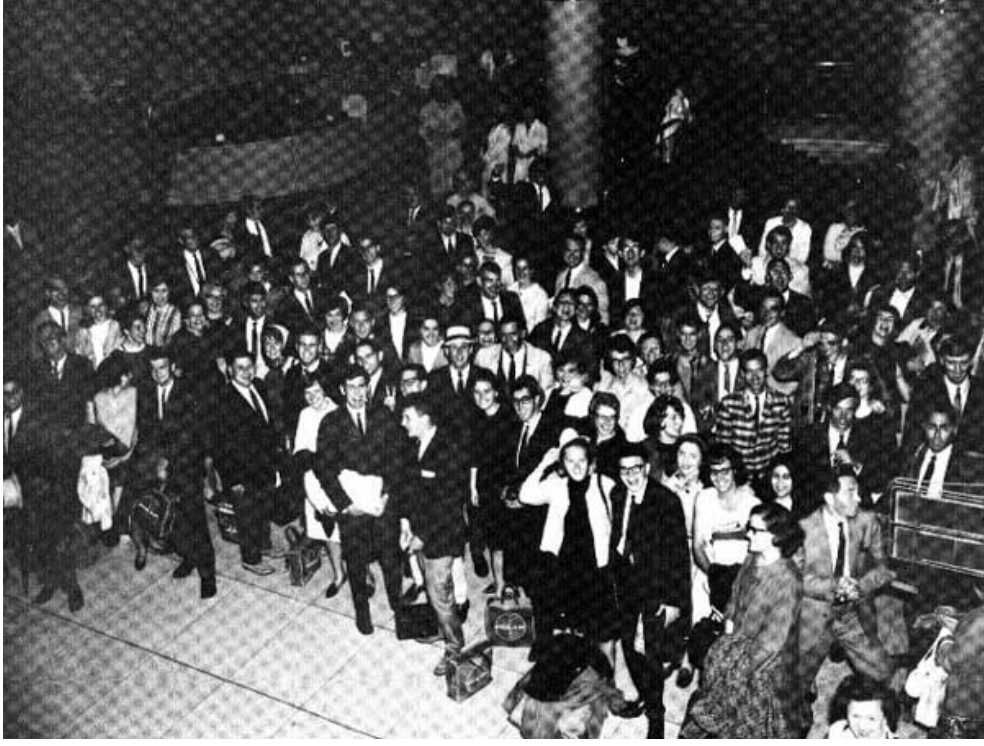
1965 Yılında Türkiye'ye Gelen Barış Gönüllüleri, http://www.arkadaslar.info/group_photos.htm , 20.4.2010