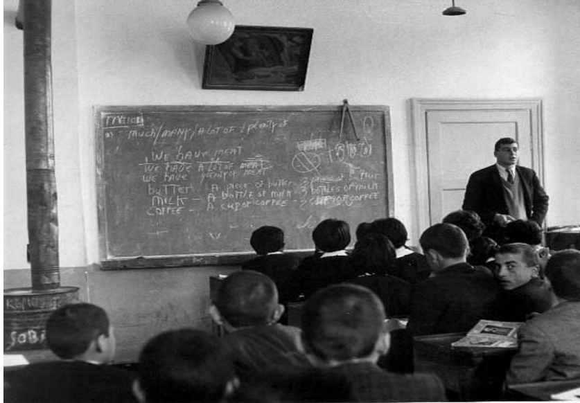
Bir Barış Gönüllüsü İngilizce Dersi Veriyorken(1966-Ünye Lisesi)