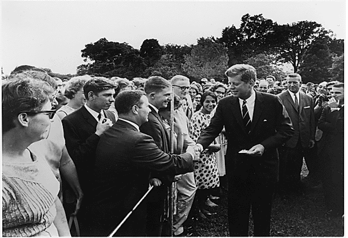
J.F Kennedy Barış Gönüllüleri'ni Selamlarken(9 Ağustos 1962 ), http://www.archives.gov/education/lessons/peace-corps/ ,20.4.2010,

( http://www.google.com.tr/images?hl=tr&q=peace%20corps%20symbol&um=1&ie=UTF-8&source=og&sa=N&tab=wj ,6.5.2010.