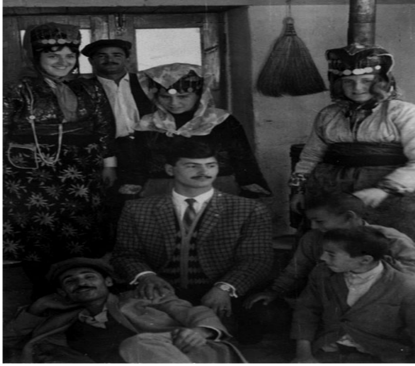
Barış Gönüllüleri Bir Köy Evinde (5 Mart 1966-Gaziantep)