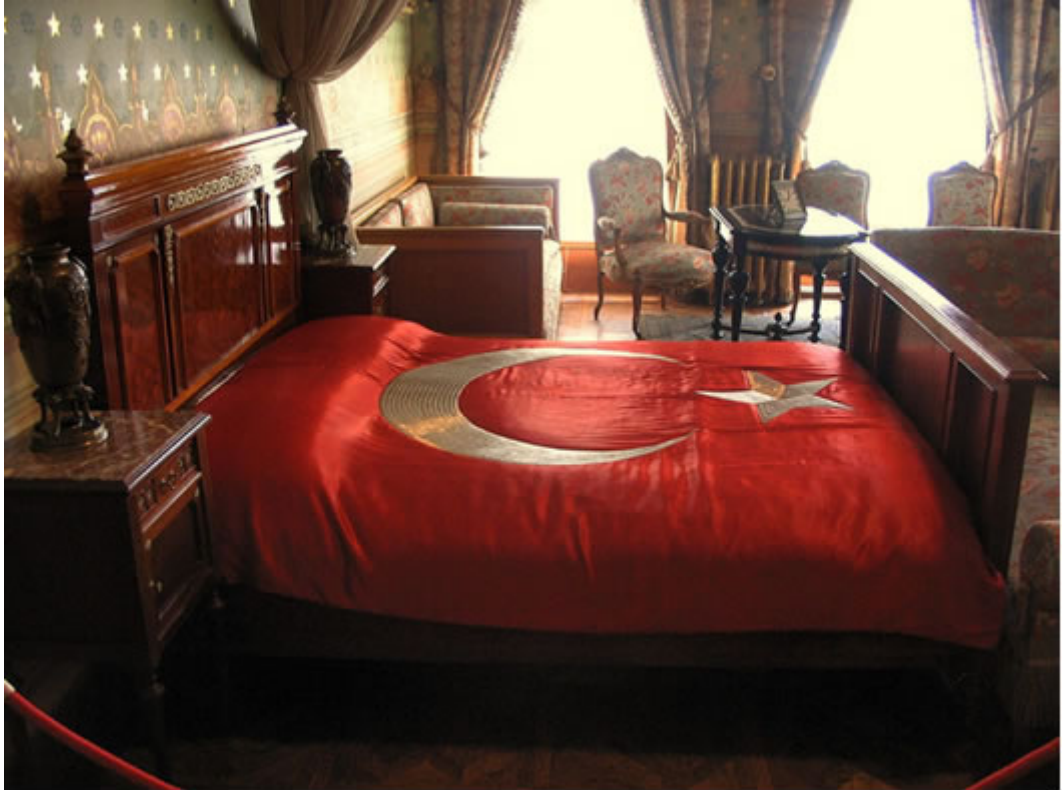
Ankara Olgunlaşma Enstitüsü'nün Hazırladığı "Atatürk'ün Ay Yıldızlı Yatak Örtüsü"