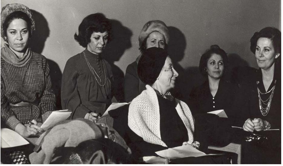
Mevhibe İnönü'nün Ankara Olgunlaşma Enstitüsü'nü Ziyareti