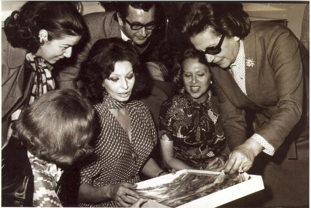
Sophia Loren Ankara Olgunlaşma Enstitüsü'nü Ziyareti