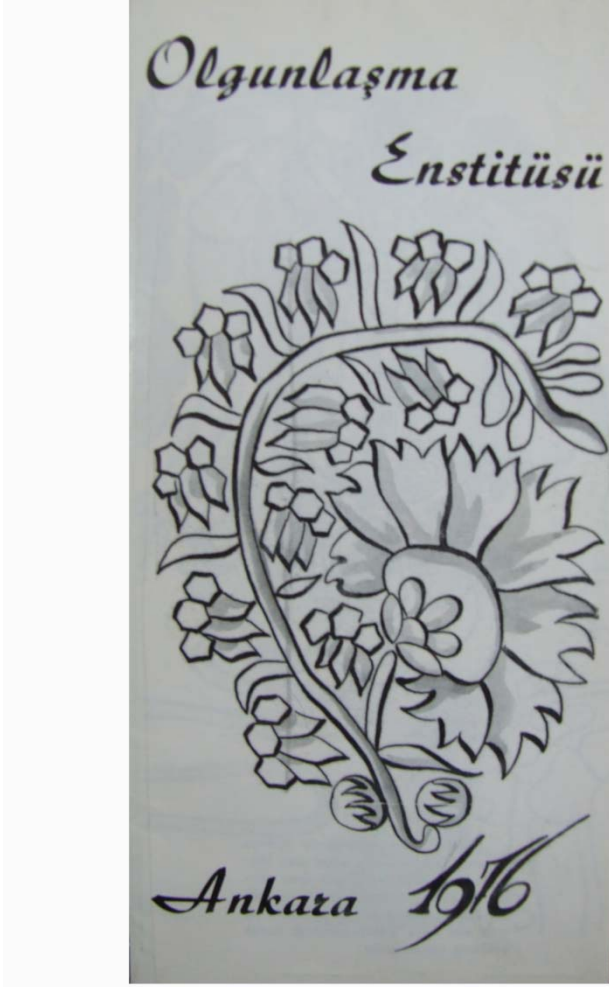
Ek 10: Ankara Olgunlaşma Enstitüsü'nün 1976 Yılında Çıkardığı Broşürün Ön ve Arka Kapağı