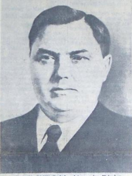
Sovyetler Birliği Başkanı geleneği gelen Malenkov

Ahmet Emin YALMAN Özellikle bu günlerde, En köklü bir adam bile son zamanlarda, harabata düşen yarımların insanlığına, bu affetmezce meyleder. Hele e mahluk, kudretin yüksek mertebelerinde, yaklaşıp ve hücumla ta diline vururken; emiliminde olmaktadır, ama belki biraz da acır.