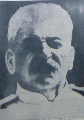
Ölen Mareşal Stalin'in en son anımsı bir resmi

Cenaze törenini hazırlamak üzere bir komite kuruldu. Sofya radyosu, Stalin'in hastalığının Marttan önce başladığını bildirdi