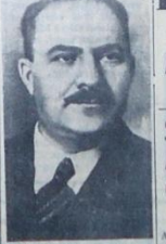
Yeni başbakan yardımcılarında Kazanmış

Londra, 6 — Rusya gelen haberlere göre, Stalin'in ölümü haberi üzerine peylerde arasında ilk isyan hareketi Arnavutluk'ta patlak vermiştir. Diğer haberlere göre, Arnavutluk'ta muhabir bir ihtilal hareketi belirlenmiş ve her hangi bir hükümete mahal vermemek maksadıyla bir Yugoslav birlik üyesi strateji Arnavutluk hududuna sevk edilmiştir.