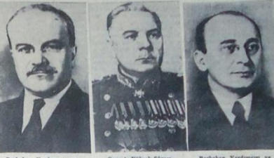
Başbakan Yardımcısı ve Dışişleri Bakanı Molotov, Sovyet Yüksek Şûrası Başkanı Vorosilof, Başbakan Yardımcısı ve İçişleri Bakanı Beria, Başbakan Yardımcısı ve İçişleri Bakanı Beria

Molotov, Kaganoviç, Bulganin ve Beria Başbakan yardımcısı oldular Aynı zamanda Beria İçişleri, Molotov da Dışişleri Bakanlığını idare edecekler Sovyet Şûrası Başkanı Şvernik azledildi. Yerine Mareşal Vorosilof tayin edildi