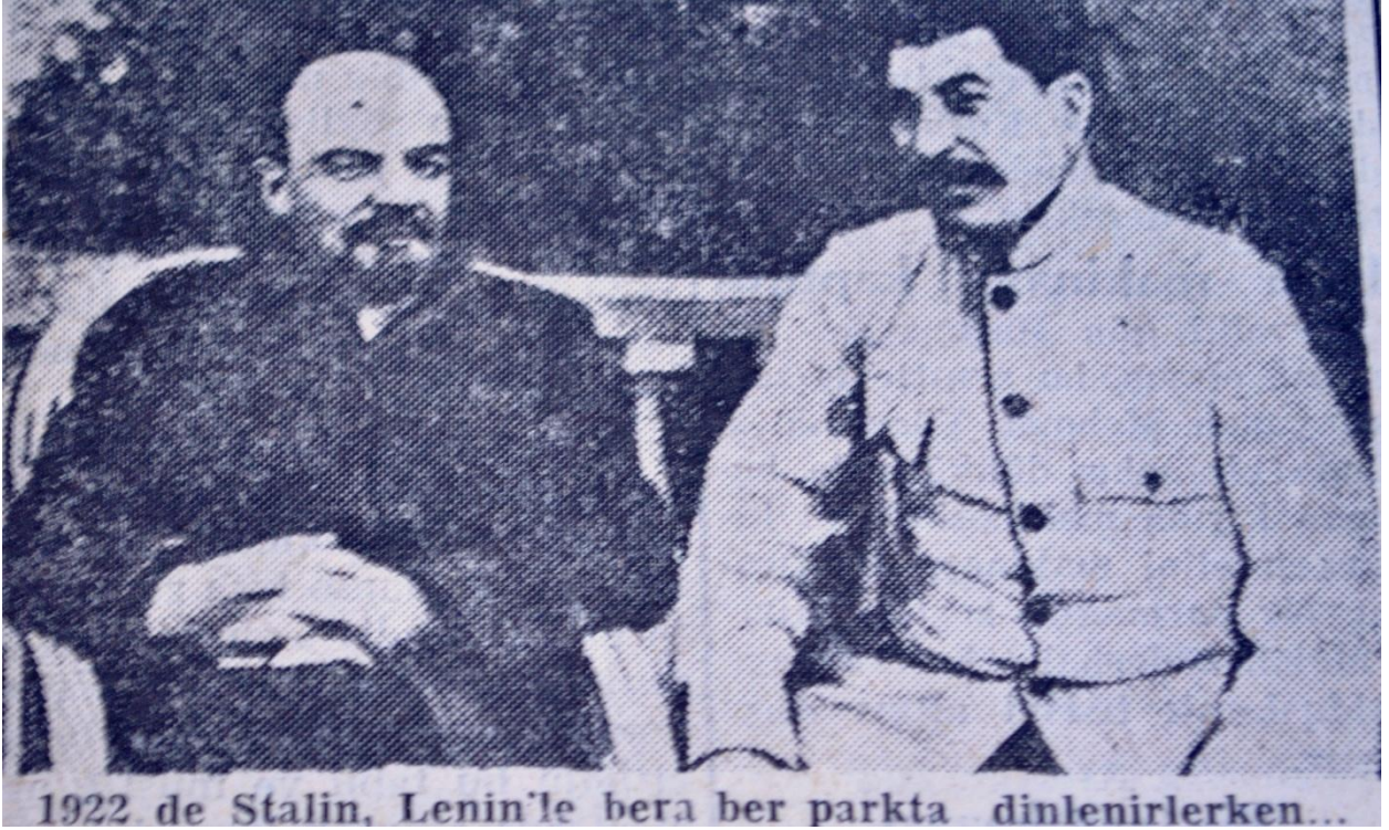
Lenin ve Stalin, Zafer Gazetesi