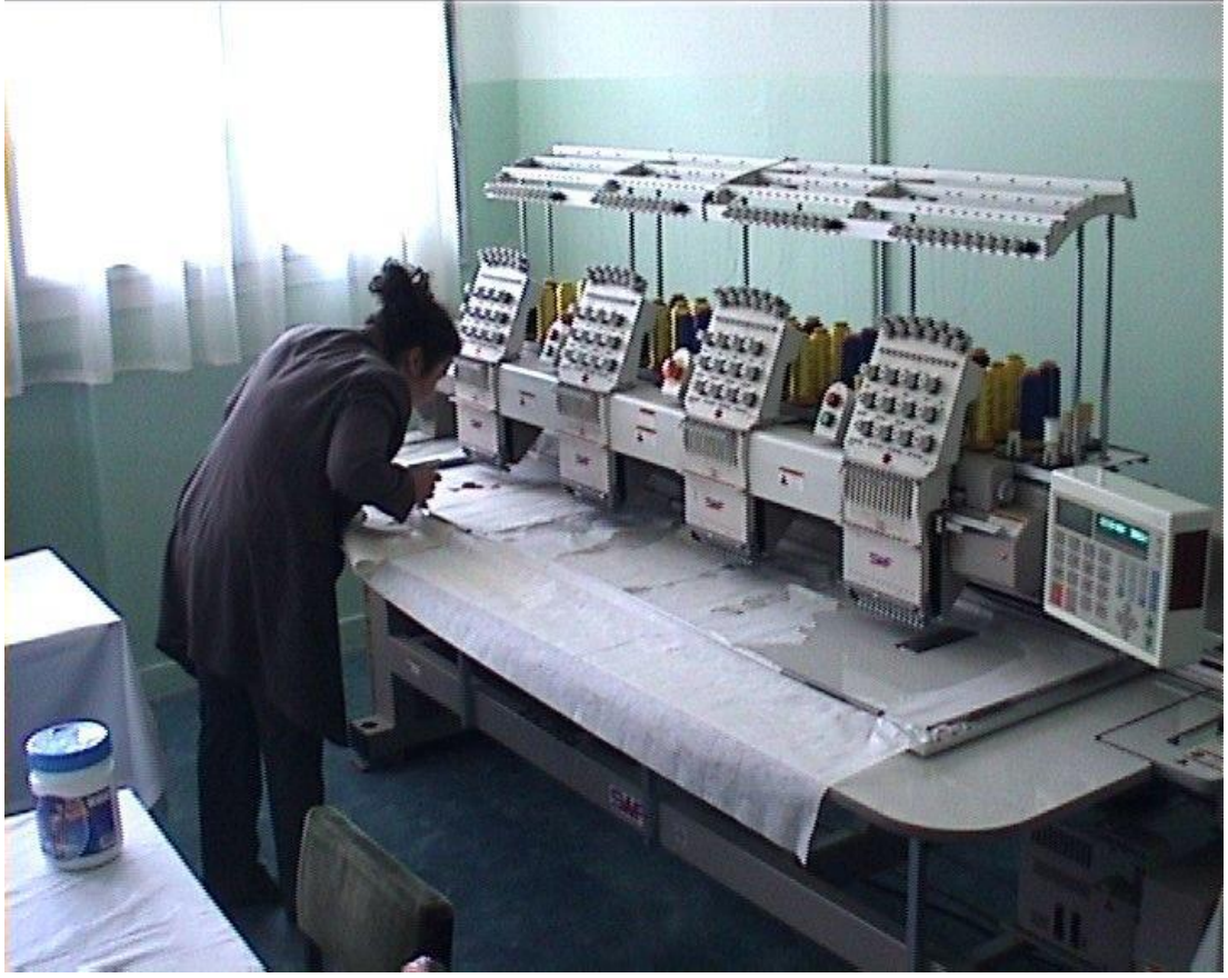
14 Nakış Atölyesi