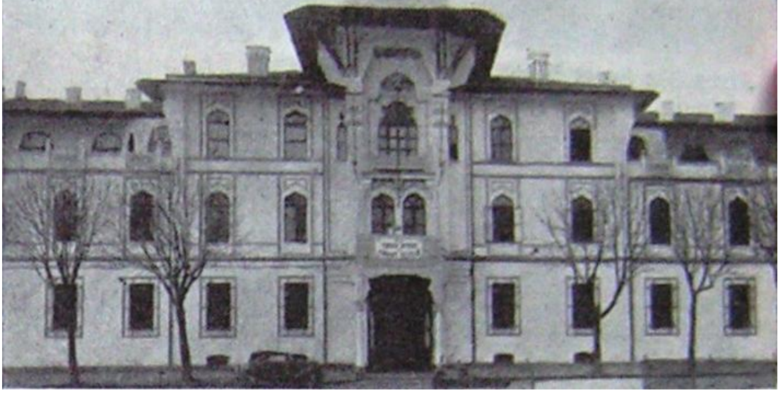
9 İstanbul İktisadi ve Ticari İlimler Akademisi