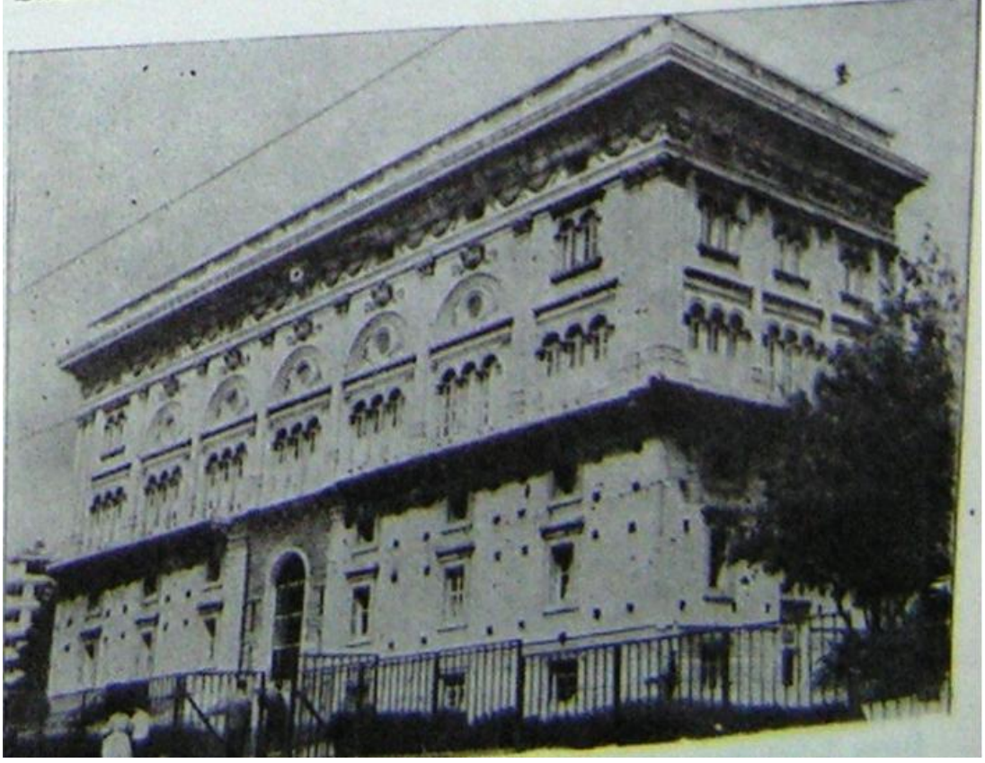
8 İstanbul Erkek Teknik Öğretmen Okulu