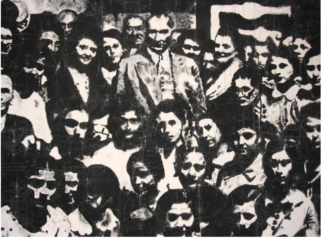
15 Atatürk'ün 04.06.1933 Yılında İsmet Paşa Kız Enstitüsü'nü Ziyareti (Bugünkü Ankara Zübeyde Hanım Anadolu Kız Meslek Teknik ve Meslek Lisesi)