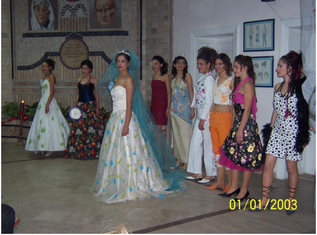
12 Okul Defilesi