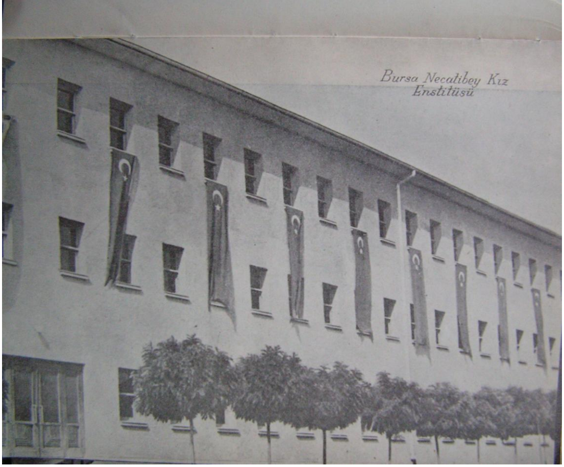
5 Bursa Necatibey Kız Enstitüsü