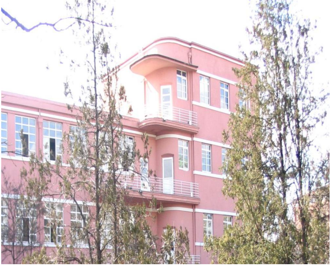
11 Okul Binası