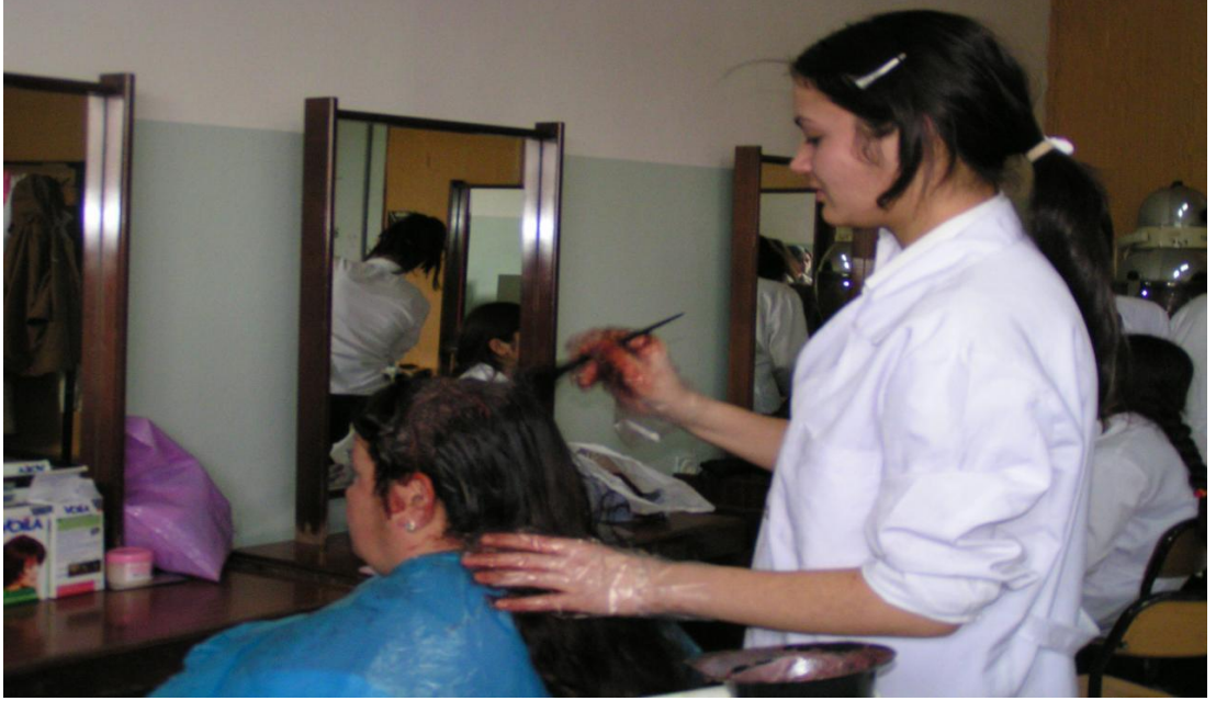
13 Okul Kuaför Salonu