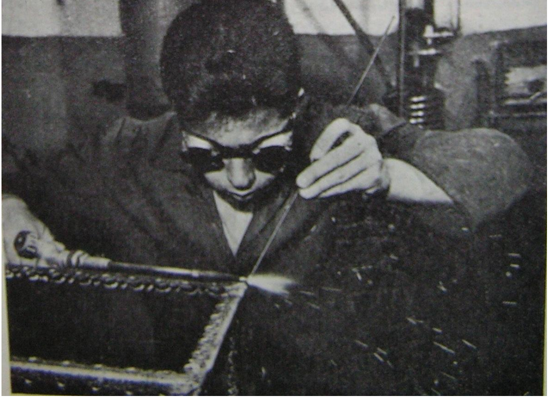
2 Kaynak Yapan Öğrenci