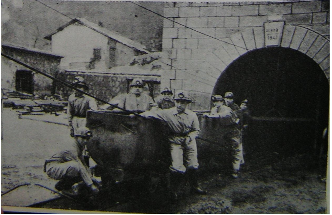
3 Maden Bölümü Öğrenciler Ocaktan Çıkarken