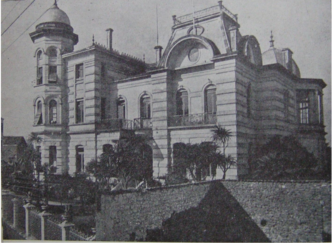
7 Trabzon Kız Enstitüsü