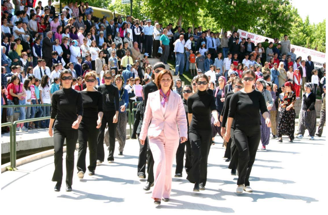
10 Okul Tören Yürüyüşü