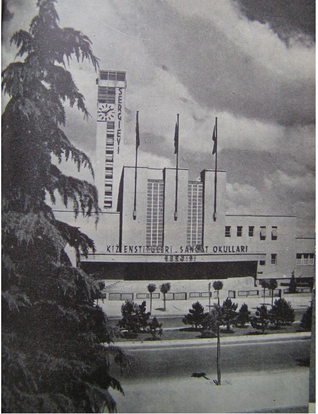
6 Kız Enstitüleri Sergievi