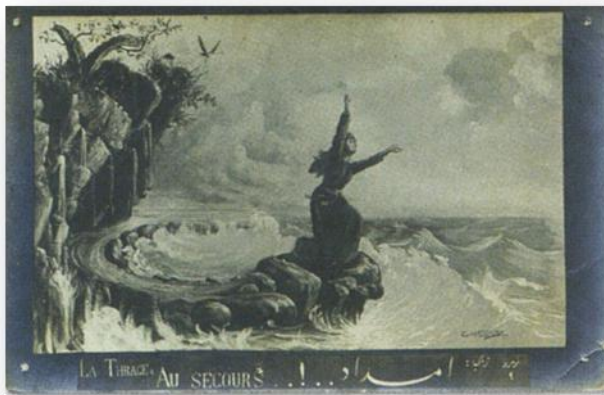
ایستاد...!... Au SECOURS LA THIRAGE