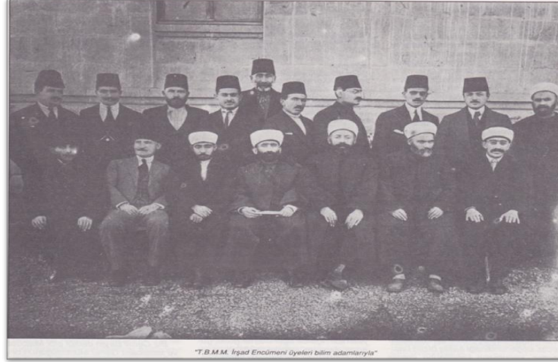
"T.B.M.M. İrşad Encümeni üyeleri bilim adamlarıyla"