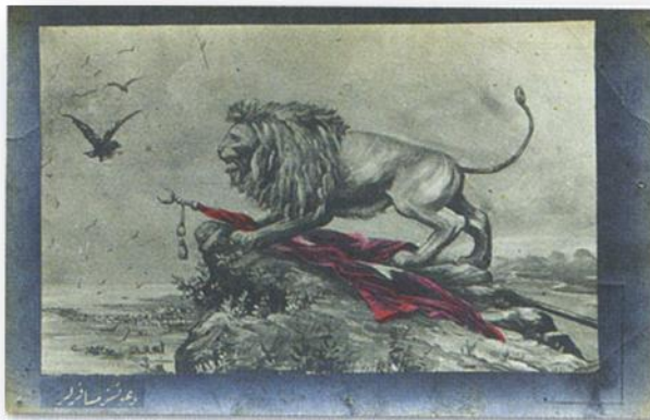
رعد سراسر از لرزه