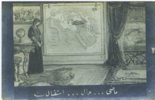
راضی... حال... استقبال