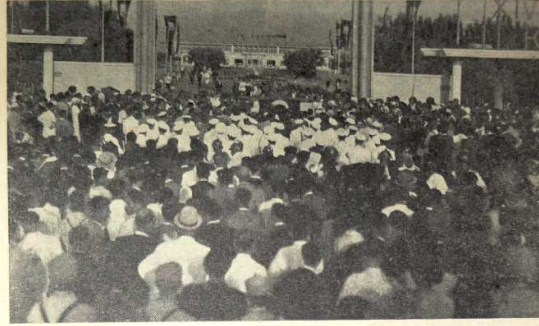
Ticaret Bakanı Fuarı açış nutkunu söylerken

Belediye Reisi Reşat Leblebicioğlu aynı mevsimde «Fuar Eglenceleri» adile bir aylık mahalli bir hareket yaptırmıştır.