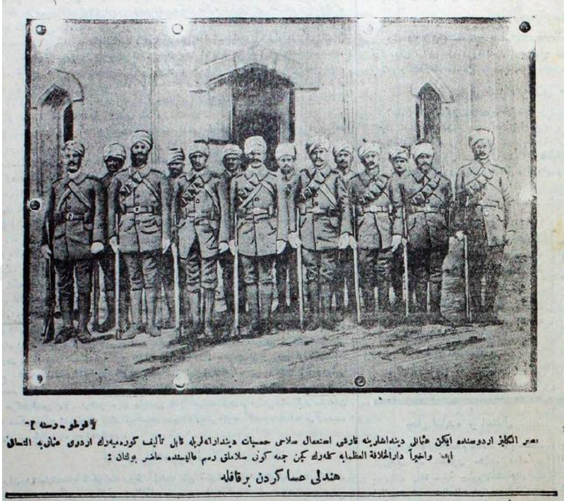
Hindli Askerlerden Bir Kabîle.