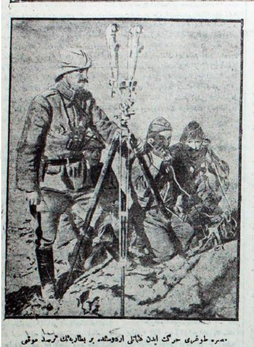
Mısır'a doğru hareket iden Osmanlı ordusunda bir bataryanın (.....)mevki'.