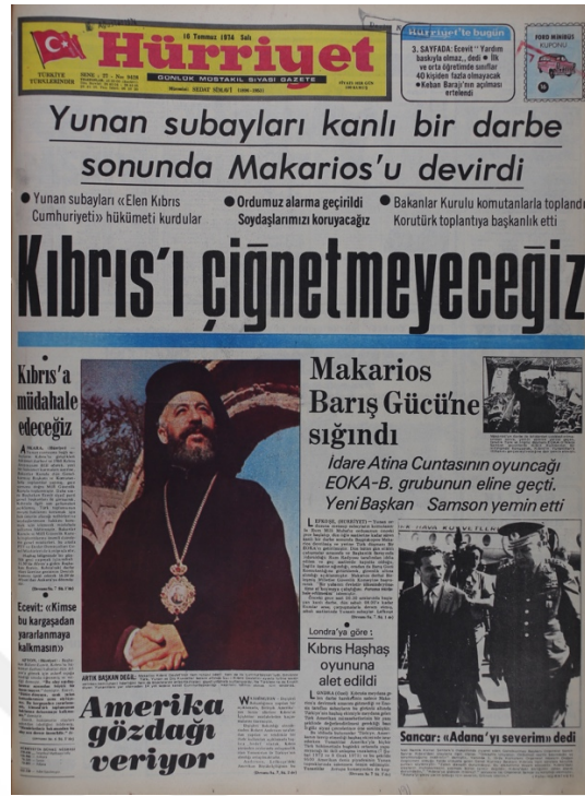
Hürriyet Gazetesi, 16 Temmuz, Sayı 9428