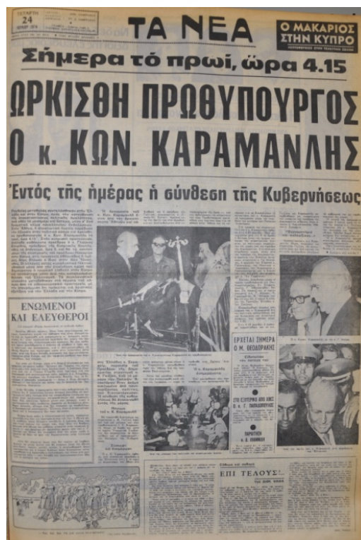
Ta Nea Gazetesi, 24 Temmuz 1974, Sayı 8916