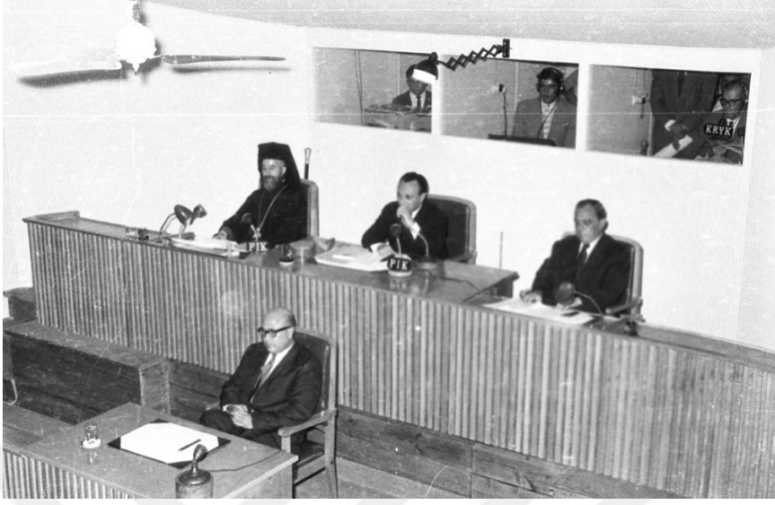
16.08.1960 Kıbrıs Cumhuriyeti Temsilciler Meclisi