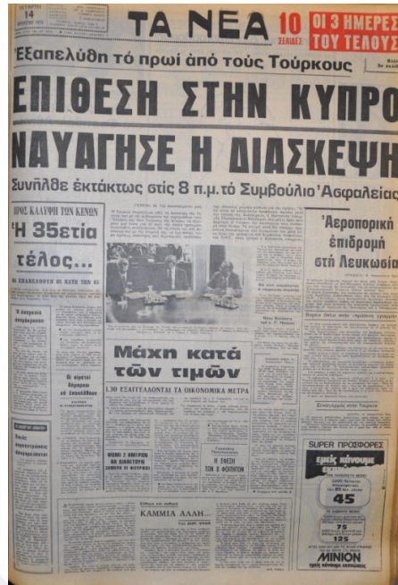
Ta Nea Gazetesi, 14 Ağustos 1974, Sayı 8933