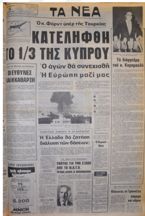
Ta Nea Gazetesi, 16 Ağustos 1974, Sayı 8934