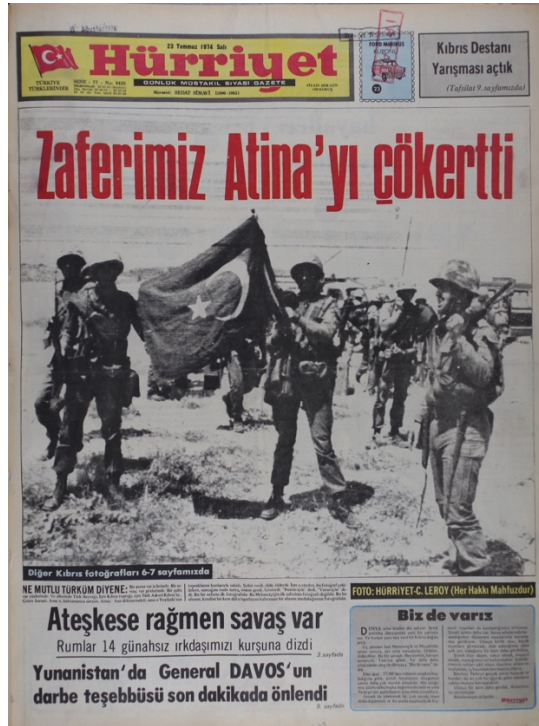
Hürriyet Gazetesi, 23 Temmuz 1974, Sayı 9435