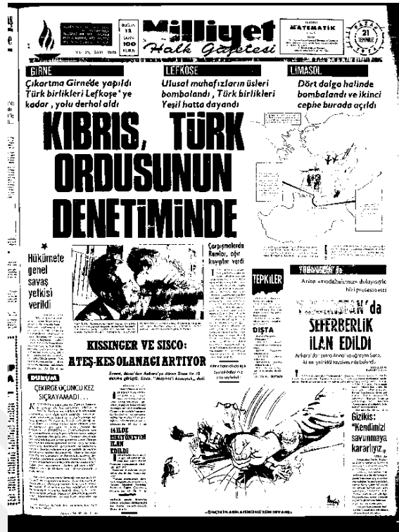
Milliyet Gazetesi, 21 Temmuz 1974, Sayı 9595