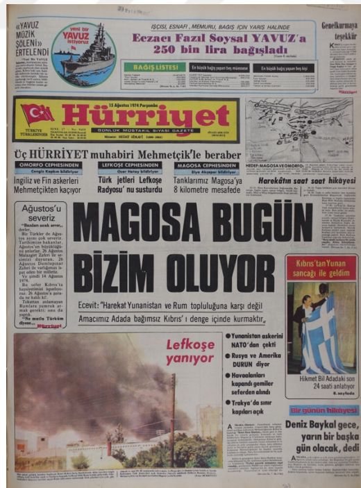
Hürriyet Gazetesi, 15 Ağustos 1974, Sayı 9458