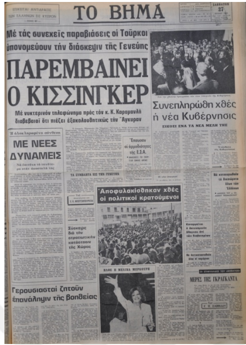
To Vima Gazetesi, 27 Temmuz 1974, Sayı 8947