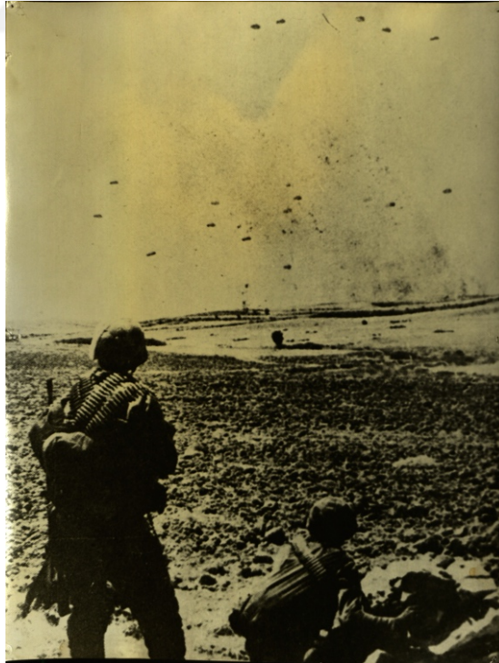
Türk Hava İndirmesi, KKTC Milli Arşiv ve Araştırma Dairesi, No. 36