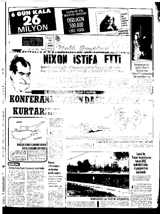
Milliyet Gazetesi, 9 Ağustos 1974, Sayı 9614