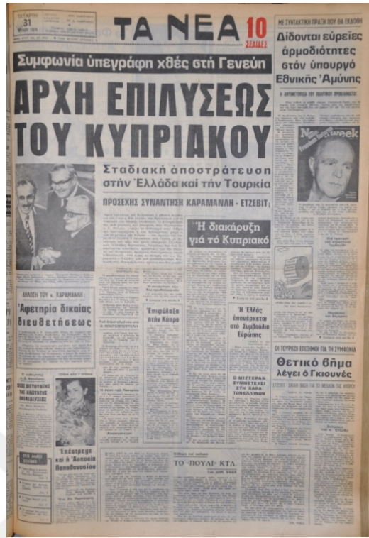
Ta Nea Gazetesi, 31 Temmuz 1974, Sayı 8922