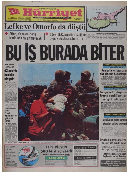
Hürriyet Gazetesi, 17 Ağustos 1974, 9460