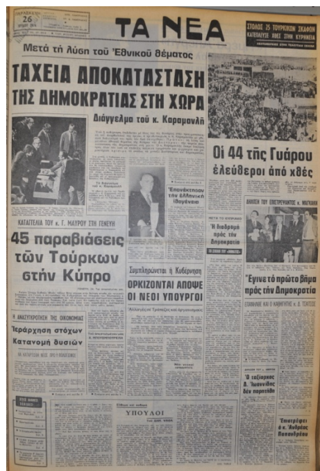
Ta Nea Gazetesi, 26 Temmuz 1974, Sayı 8918