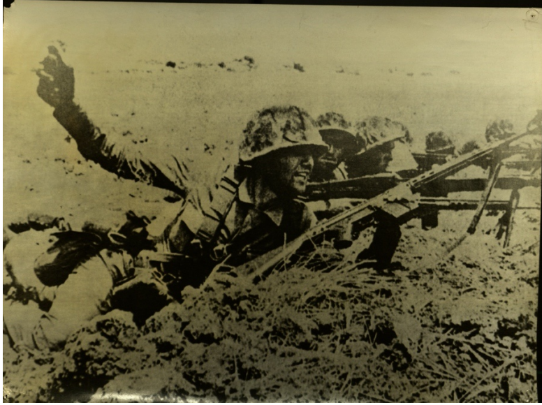
Taarruz sırasında Türk askerleri