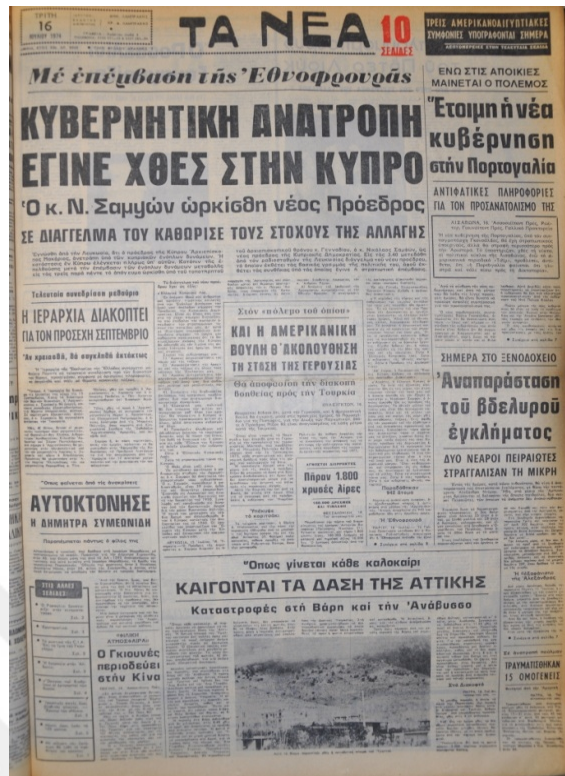
Ta Nea Gazetesi, 16 Temmuz 1974, Sayı 8909