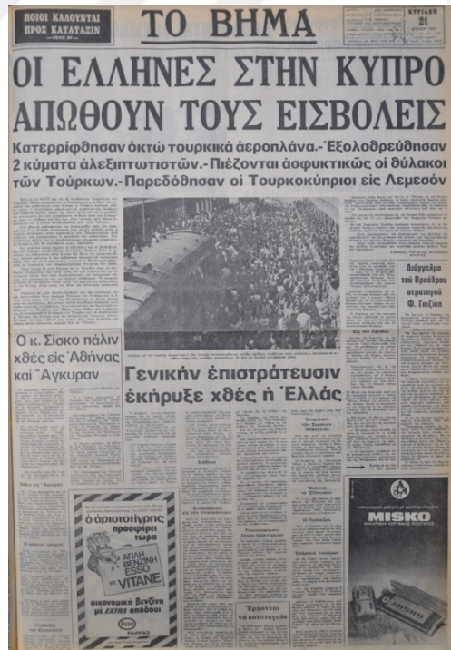
To Vima Gazetesi, 21 Temmuz 1974, Sayı 8942