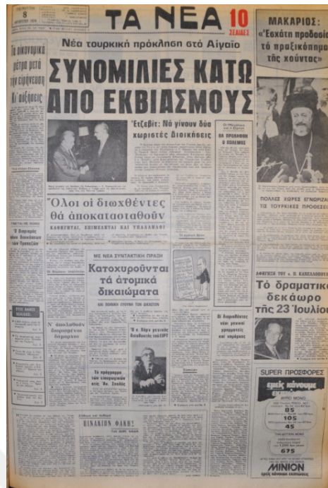
Ta Nea Gazetesi, 8 Ağustos 1974, Sayı 8929