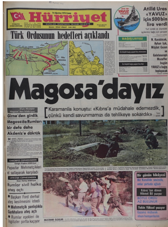
Hürriyet Gazetesi, 16 Ağustos 1974, Sayı 9459