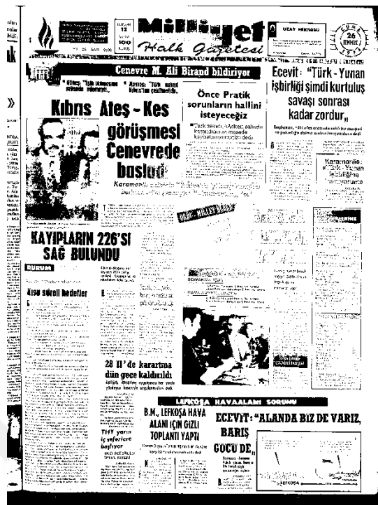
Milliyet Gazetesi, 26 Temmuz 1974, Sayı 9600