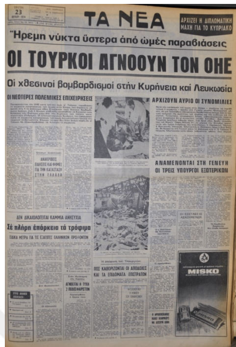
Ta Nea Gazetesi, 23 Temmuz 1974, Sayı 8915