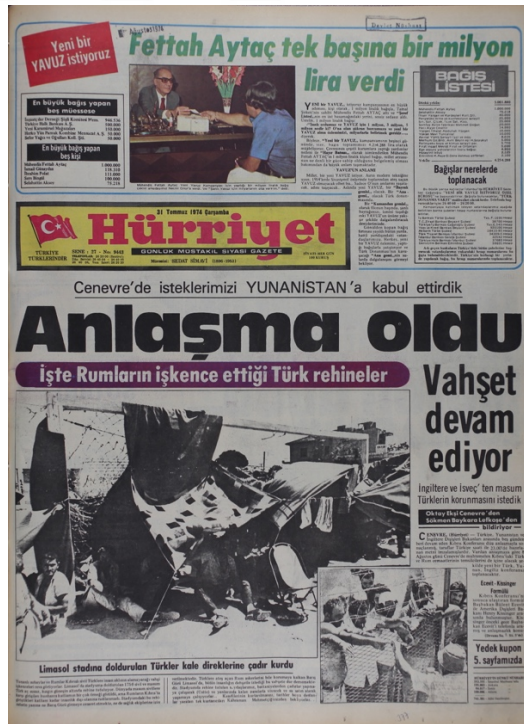
Hürriyet Gazetesi, 31 Temmuz, Sayı 9443