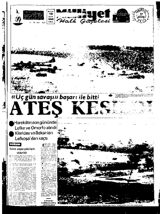
Milliyet Gazetesi, 17 Ağustos 1974, Sayı 9622