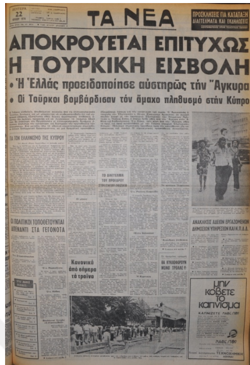
Ta Nea Gazetesi, 22 Temmuz 1974, Sayı 8914