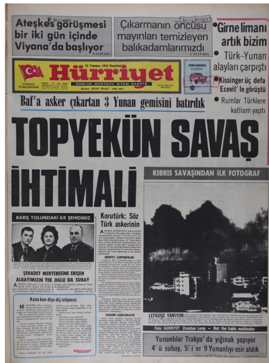
Hürriyet Gazetesi, 22 Temmuz 1974, Sayı 9434