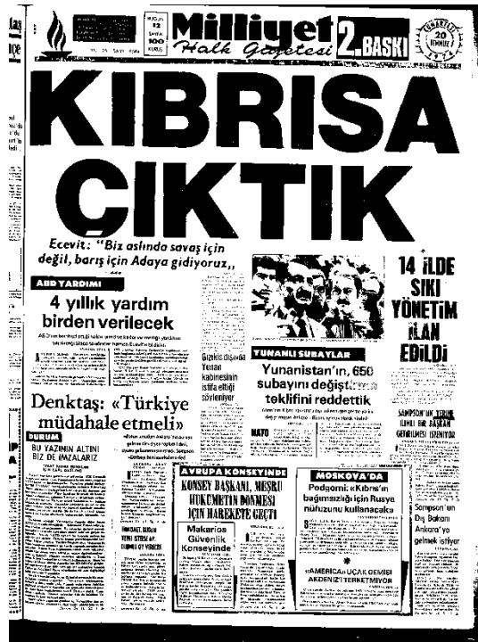
Milliyet Gazetesi, 2. Baskı, 20 Temmuz 1974, Sayı 9594