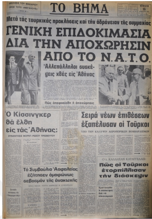
To Vima Gazetesi, 15 Ağustos 1974, Sayı 8963