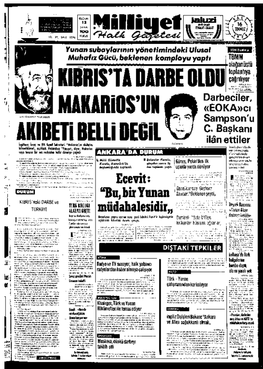
Milliyet Gazetesi, 16 Temmuz 1974, Sayı 9590