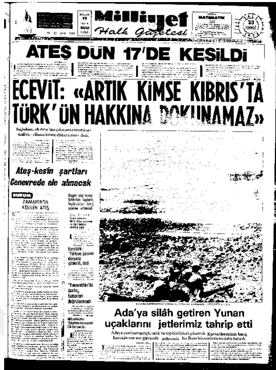
Milliyet Gazetesi, 23 Temmuz 1974, Sayı 9597