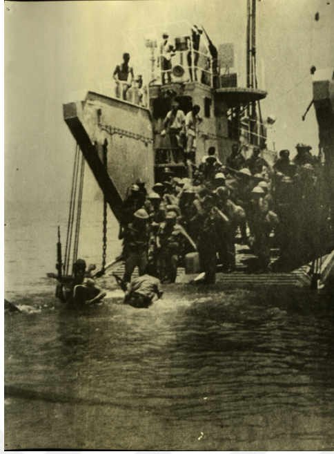
20 Temmuz'da karaya çıkan Askerler, KKTC Milli Arşiv ve Araştırma Dairesi, No. 31