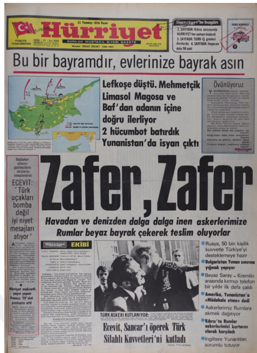
Hürriyet Gazetesi, 21 Temmuz 1974, Sayı 9433

ΓΡΑΦΕΙΟ ΔΗΜΟΣΙΩΝ ΠΛΗΡΟΦΟΡΙΩΝ ΑΝΑΚΟΙΝΩΣΕΩΝ PUBLIC INFORMATION OFFICE PRESS RELEASE