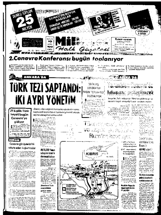
Milliyet Gazetesi, 8 Ağustos 1974, Sayı 9613