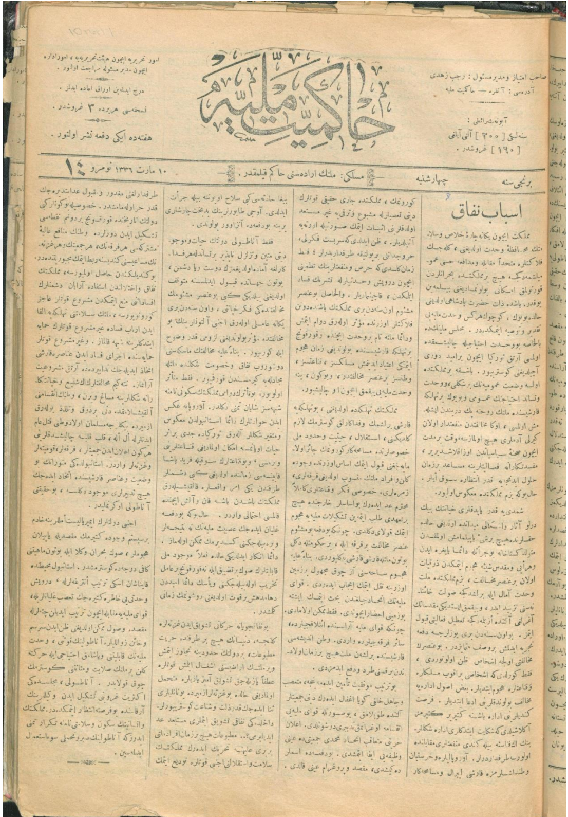
“Esbâb-ı Nifak”, Hâkimiyet-i Milliye, 10 Mart 1920, s. 1.