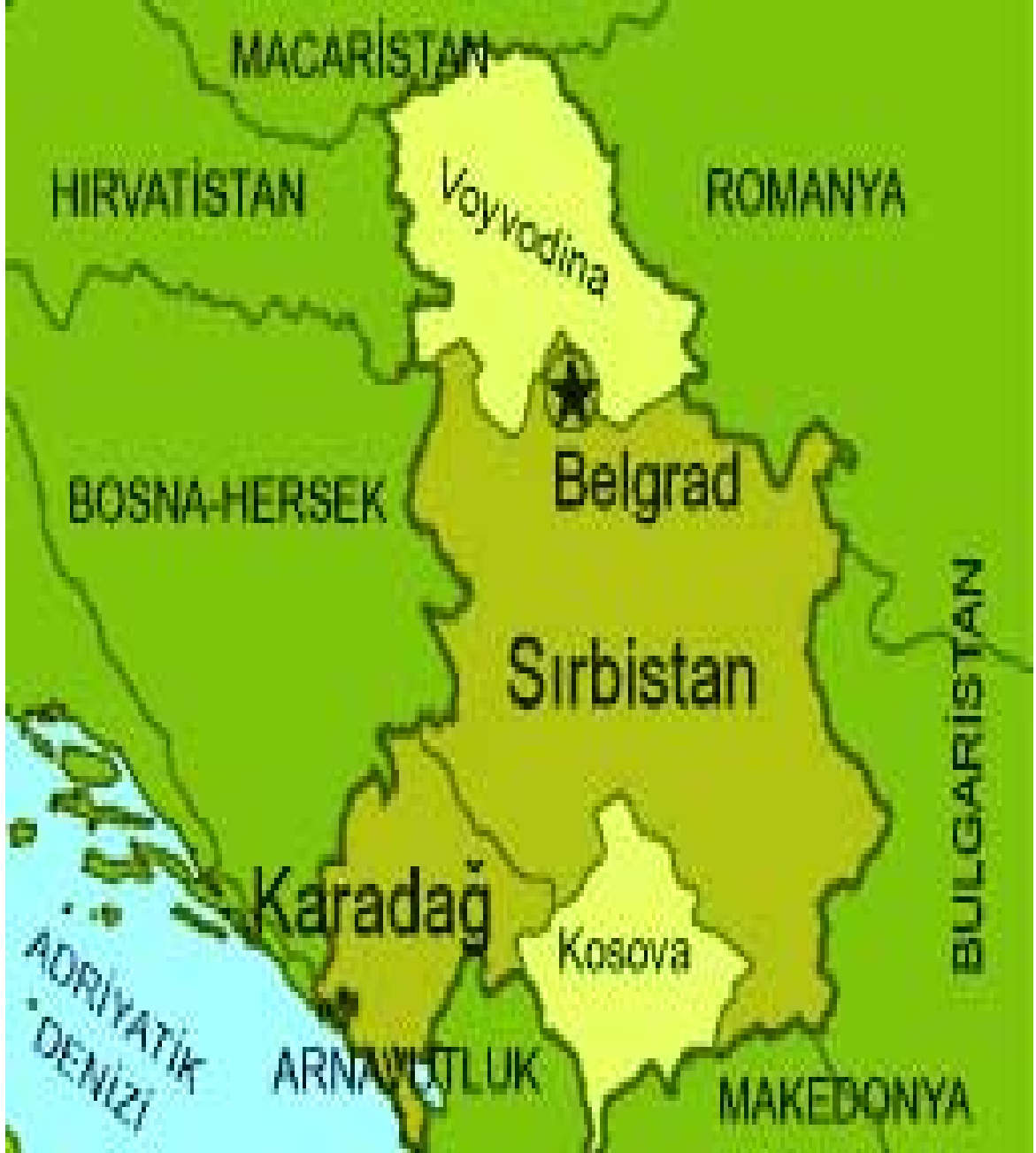
EK:4- Dağılan Yugoslavya Haritası 77