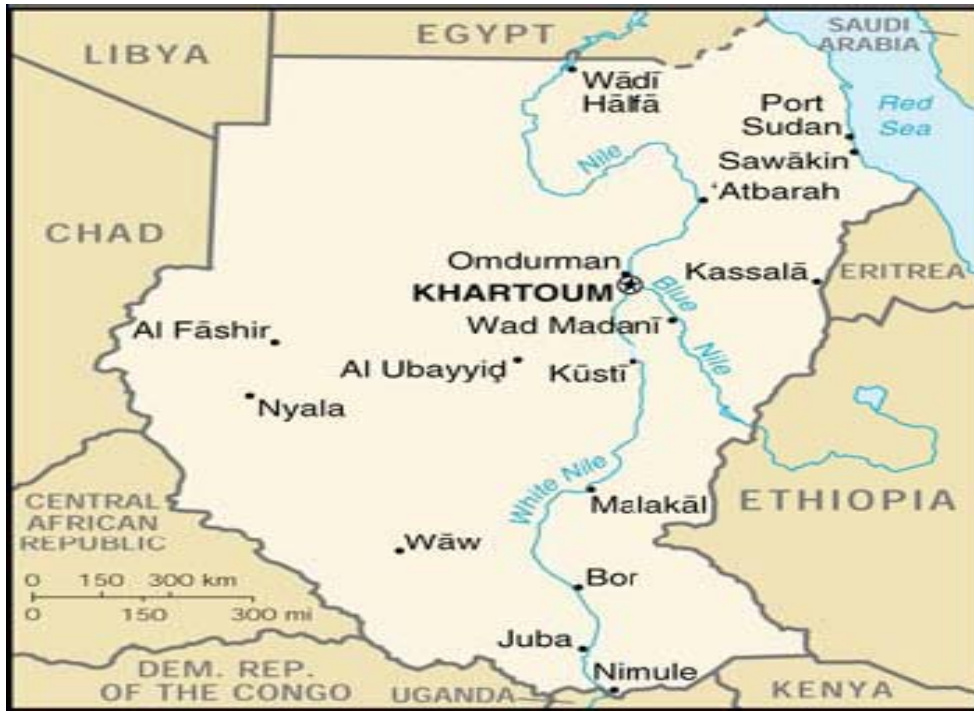
Harita 1: Sudan Ülke Haritası