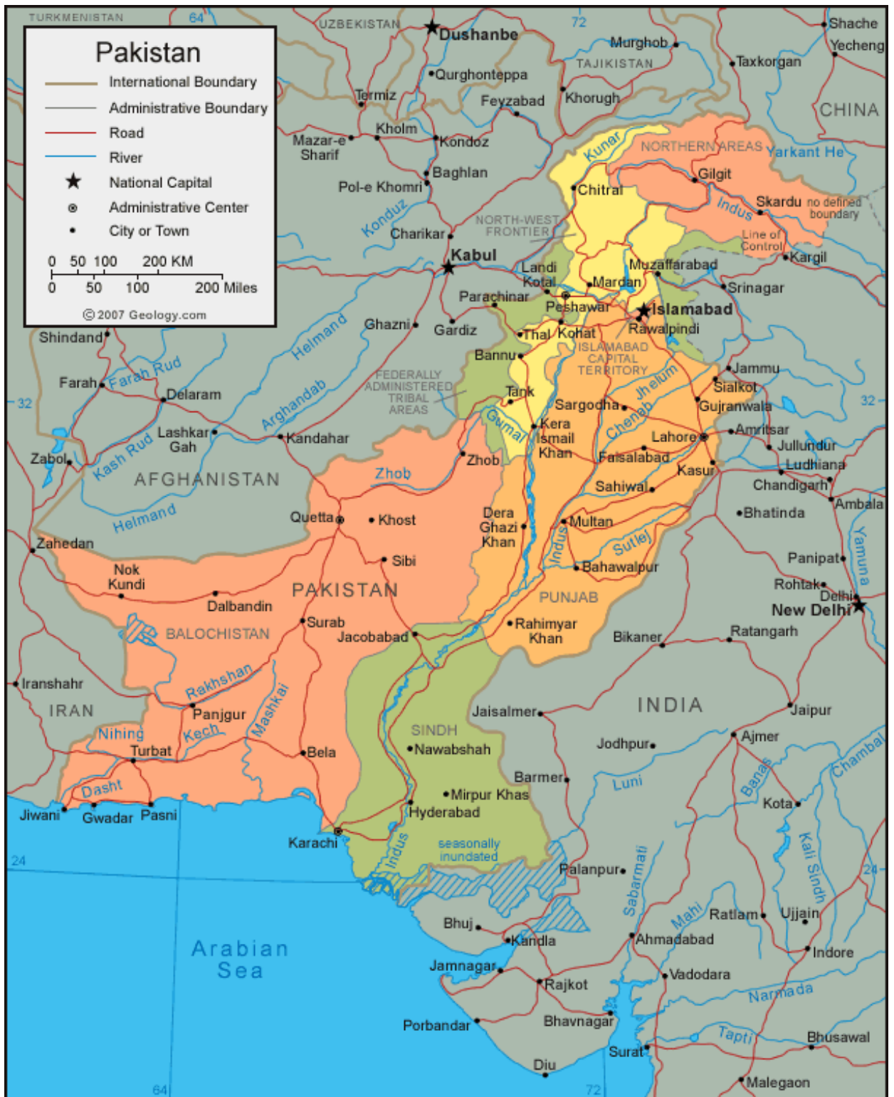
Ek-1: Pakistan Haritasi