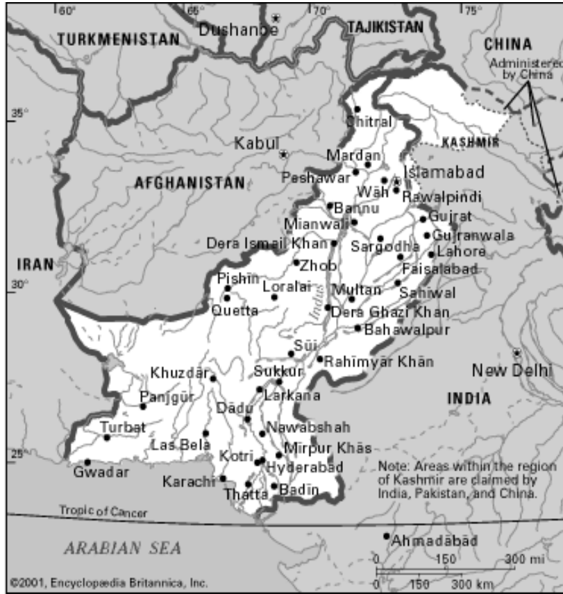
Tablo: Pakistan Sınır ve Bölge Haritası