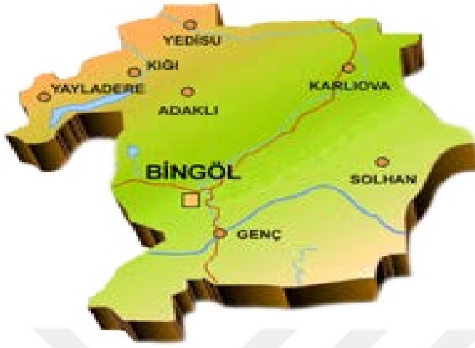
Bingöl haritası 56