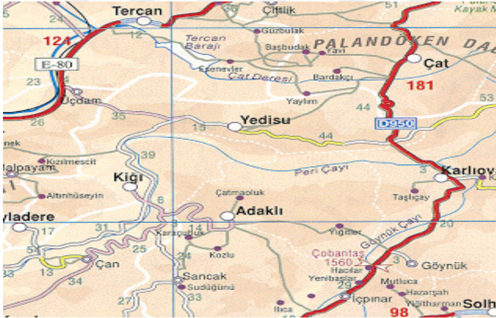
Kiğı haritası 57