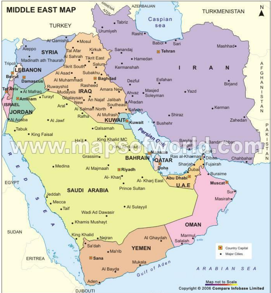
Harita 1: Orta Doğu Haritası

ülkelerin kapsam içine alınabilmesi için açık kapı bırakılmış olmasıdır. Bununla birlikte, özellikle ABD kaynaklarından, 27 ülkenin ilk planda BOP çerçevesinde değerlendirildiği anlaşılmıştır. Bu ülkeler şunlardır: Afganistan, Bahreyn, Birleşik Arap Emirlikleri, Cezayir, Cibuti, Fas, Filistin Özerk Yönetimi, Irak, İran, İsrail, Katar, Kuveyt, Kamar Adaları, Lübnan, Libya, Mısır, Moritanya, Pakistan, Somali, Suudi Arabistan, Sudan, Suriye, Tunus, Türkiye, Umman, Ürdün ve Yemen'dir. (Saklaya, 2004, 48:5).