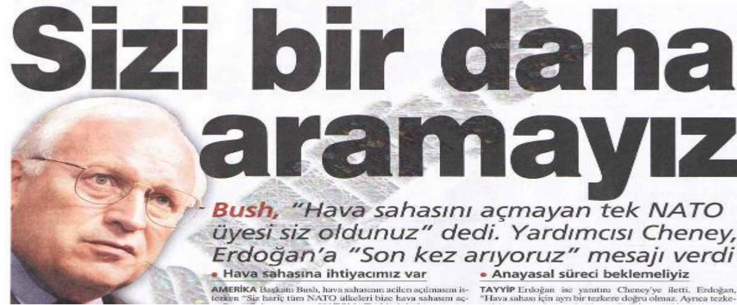
Şekil.19. Cheney Tehdit Haberi

Kaynak: Milliyet Gazetesi, 12.03.2003-16.03.2003