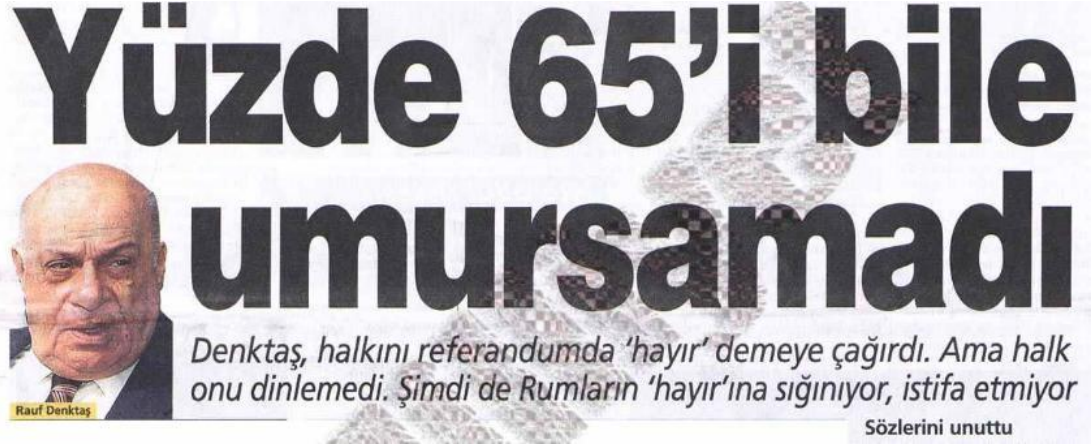
Şekil.22. Denktaş Referandum Sonucu Haberi