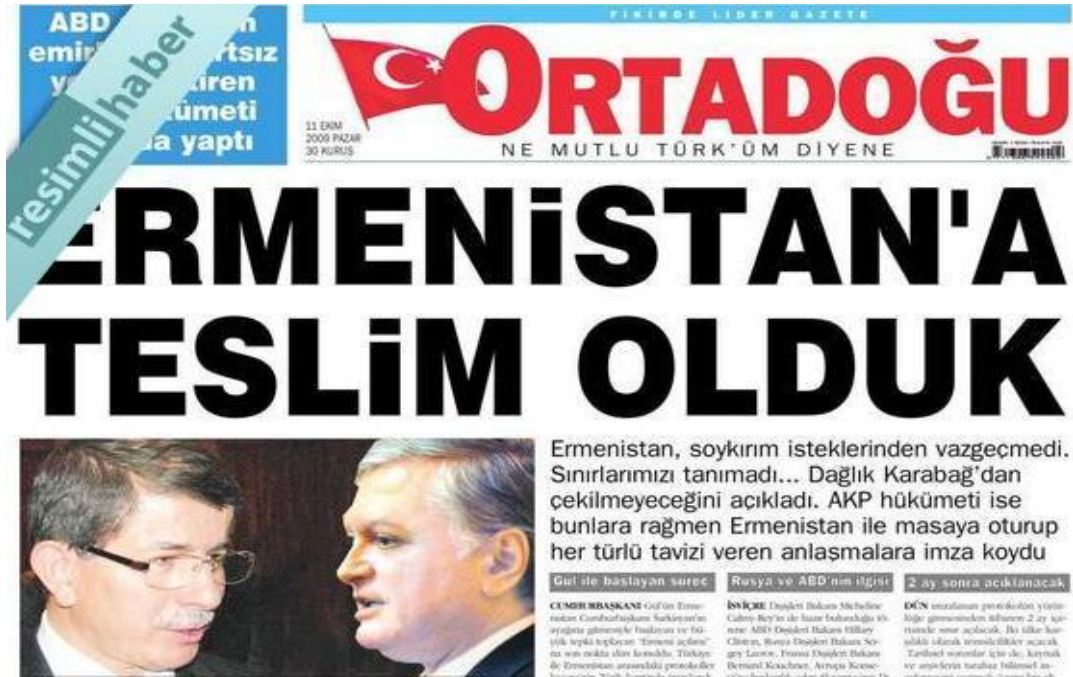
Şekil.30. Ermenistan'a Teslim Olduk Haberi

Cumhuriyet, "Sancılı Protokol" "Türkiye ile Ermenistan arasındaki normalleşme süreci krizle başladı", Sözcü, "Zoraki imza" "Türkiye-Ermenistan barış protokolünde soykırım inatlaşması büyük krize neden oldu. Devreye Amerika girdi, imzalar atıldı", Radikal, "Tarihi imzalar" "Türkiye ve Ermenistan arasındaki protokolün imzasından önce açıklama krizi çıktı. Clinton araya girdi. Zorlu pazarlıklar yapıldı."; Ortadoğu, "Ermenistan'a teslim olduk" "Ermenistan, soykırım isteklerinden vazgeçmedi. Sınırlarımızı tanımadı... Dağlık Karabağ'dan çekilmeyeceğini açıkladı. AKP hükümeti ise bunlara rağmen Ermenistan ile masaya oturup her türlü tavizi veren anlaşmalara imza koydu"; Star, "Tarihi sorun tarihe gömüldü" "Türkiye'nin komşularla sıfır sorun stratejisinde son sorun da çözüm yoluna girdi. Ermenistan'la sınır ve soykırım iddialarını çözecek protokol imzalandı. Son dakikada çıkan açıklama krizi Clinton'un girişimiyle çözüldü", Yeni Çağ, "Ermeniye teslimiyet" "Karabağ işgaline rağmen ABD baskısıyla masaya oturan iktidar imzayı attı". 171