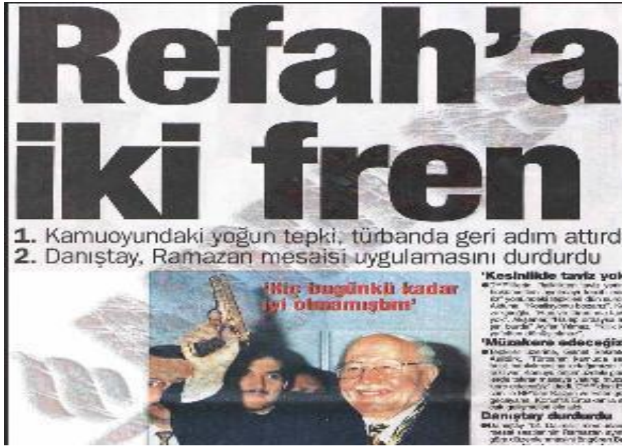
Şekil.3. Refah'a İki Fren Haberi

27 Ocak tarihli Milliyette ise büyük puntolarla "Türbana yeşil ışık" haberi giriliyor içerikte ise, Refah Parti'li bakan Esengün'ün "başörtüsü işini çözmek, imamhatipler'i açmak görevimizdir. Hacca karayolu ile gitmeyi sağlayıp kurban derisine uzanan ellerin önüne geçeceğiz dediği aktarılıyordu. Ertesi günün Milliyeti'nde ise "MGK'dan uyarı" haberi, adalet bakanı Kazan'ın sokak defilelerini edebe aykırı bulduğu için yasaklatacağı ve Refah Partisi'nin türban yasasını meclise sunacak aşamaya getirdiği haberleri ile birlikte veriliyordu. Yine bir ertesi gün ise Refah'a iki fren manşeti Erbakan'ın elinde silah tutan bir fotoğrafı ile birlikte servis ediliyor ve Halktan gelen tepkiler üzerine Refah Partisi'nin Türban Yasasında geri adım attığı vurgulanıyordu.