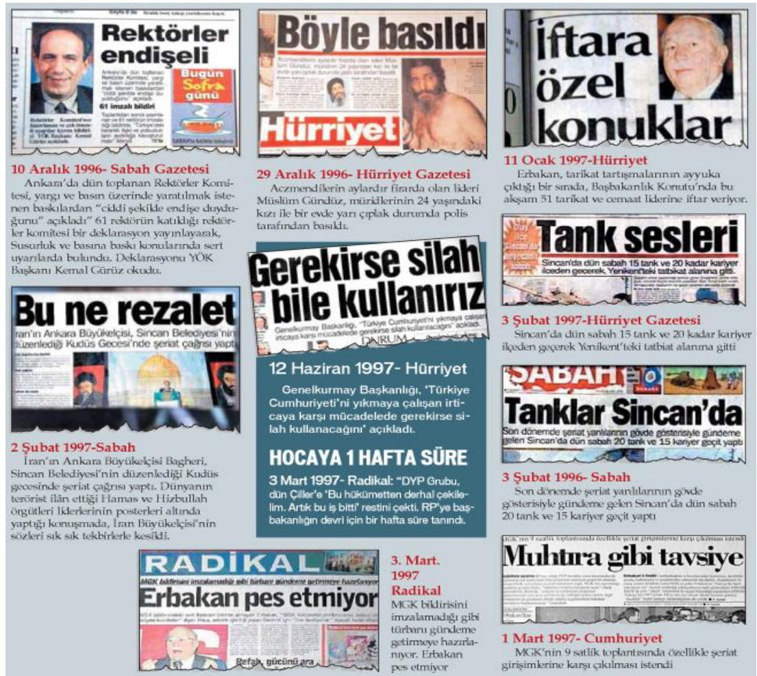
Şekil.6. 28 Şubat Basından Derlemeler

Yayın Yönetmeni olan ve ordunun hoşlanmayacağı manşetler atan Derya Sazak var, Umur Talu da var. Aydın Bey listeye bakıp diyor ki, 'bunları işten çıkarmam. Zor dönemlerde, asker sıkıştırınca gazeteci atan bir patron olamam.' Onun üzerine Çevik Bir diyor ki, 'O vakit bir subay göndeririz, gazeteyi o yönetir'. Aydın Doğan da 'peki yarın gönderin' diyor. Sertleşen ortamın sonunda Çevik Bir üslup değiştiriyor. 'Siz irticanın farkında değilsiniz. Bütün yazarları toplayın, 28 Şubat'a karşı çıkan ve sempati duyan bütün yazarlarıyla bir öğlen yemeği yiyelim. Türkiye'nin nasıl yeşilleştiğini, yüksek yargıya anlattığım gibi yazarlara da ben anlatırım' diyor. Çevik Bir'le birlikte yemek yedik. Bütün yazarlar var, sadece Umur Talu, protesto etmek için gelmedi..."