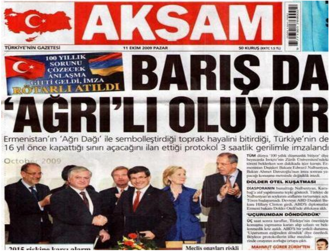
Şekil.28. Barış da Ağrı'lı Oluyor Haberi

Akşam, "Barış da Ağrı'lı oluyor" "Ermenistan'ın Ağrı Dağı ile sembolleştirdiği toprak hayalini bitirdiği, Türkiye'nin de 16 yıl önce kapattığı sınır açacağını ilan ettiği protokol 3 saatlik gerilimle imzalandı"; Hürriyet, "94 yıl sonra" "Zürih'te son dakika krizinin yaşandığı törende, Türkiye ile Ermenistan arasında ilişkileri iyileştirecek protokol, 1915 olaylarından 94 yıl sonra iki ülke dışişleri bakanları Davutoğlu ve Nalbantyan tarafından imzalandı"; Habertürk, "Bursa'ya bekleriz" "Ermenistan ile küskülüğü bitiren tarihi protokol Zürih'te dün imzalandı. İki ülke sınır kapısı iki ay içinde açılacak. Şimdi Türkiye Sarkisyan'ı çarşamba günkü maça bekliyor"