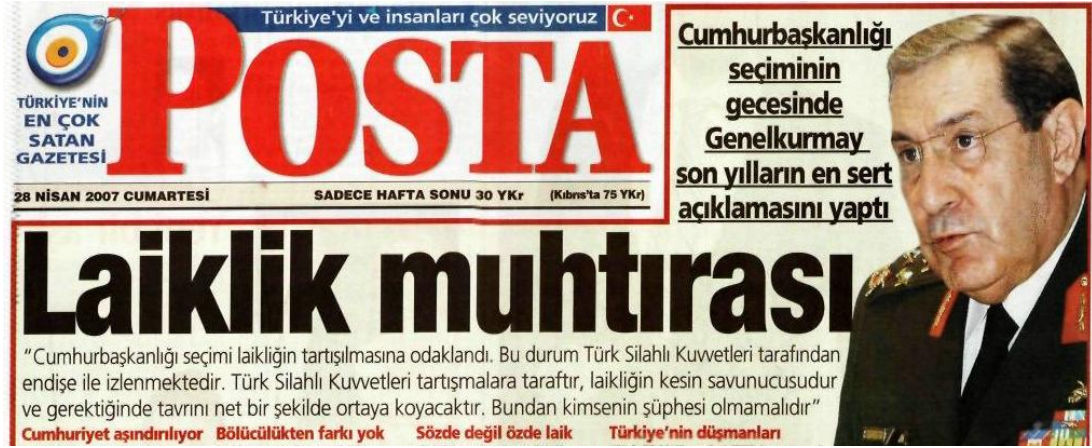
Şekil.25. Laiklik Muhtırası Haberi

Dış basındaki ilk haberi Ajans Frans Press geçiyor ve TSK'nın laiklikle ilgili uyarısını bülten başlığına alıyordu. Diğer önemli başlıklar ise şöyleydi: NYT, "Son yılların en keskin açıklaması"; Times, "Ordu sesini yükseltti"; BBC, "Türk ordusu uyardı"; FT, "Türk ordusundan dramatik müdahale"