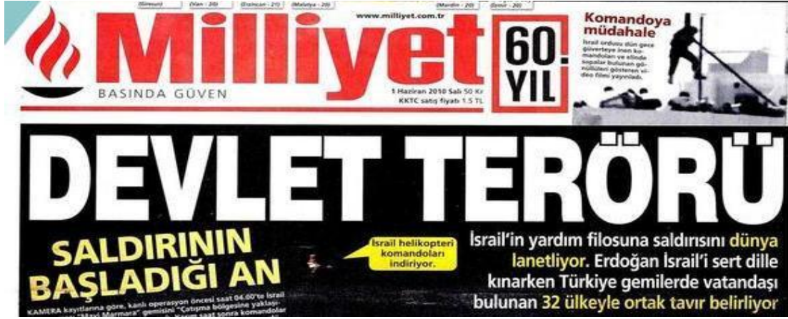
Şekil.32. Devlet Terörü Haberi