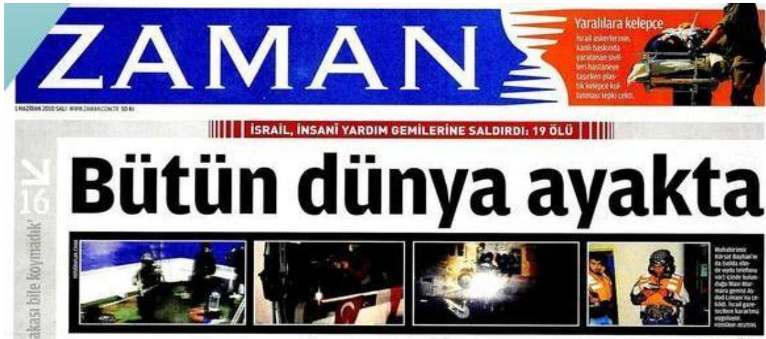
Şekil.33. Bütün Dünya Ayakta Haberi

Zaman, "Bütün dünya ayakta" "Dünya, Gazze'ye insani yardım götüran gemileri durdurmak için İsrail'in uluslararası sularda düzenlediği kanlı saldırıyla sarsıldı. 29 Barış gönüllüsünün hayatını kaybettiği baskının ardından Ankara, Tel Aviv'deki elçisini geri çağırdı"; Ortadoğu, İsrail 19 sivil'i katletti" "Gazze'ye gösterdiği hassasiyeti şehitlerine de göster Türkiye"; Star, "Hesap vereceksin" "İsrail terörü Gazze'ye yardım taşıyan konvoyu uluslararası sularda vurdu. Türkiye, tarihin en sert tepkisini gösterdi: hesap soracağız"; Yeni Çağ, "Kahpe ittifak" "Dışarıda İsrail, İçeride PKK vurdu"; Radikal, "İnsanlığa kurşunlar" "Açık denizde savaş suçu. İsrail, sivil yardım gemisinde ölüm saçtı". 173