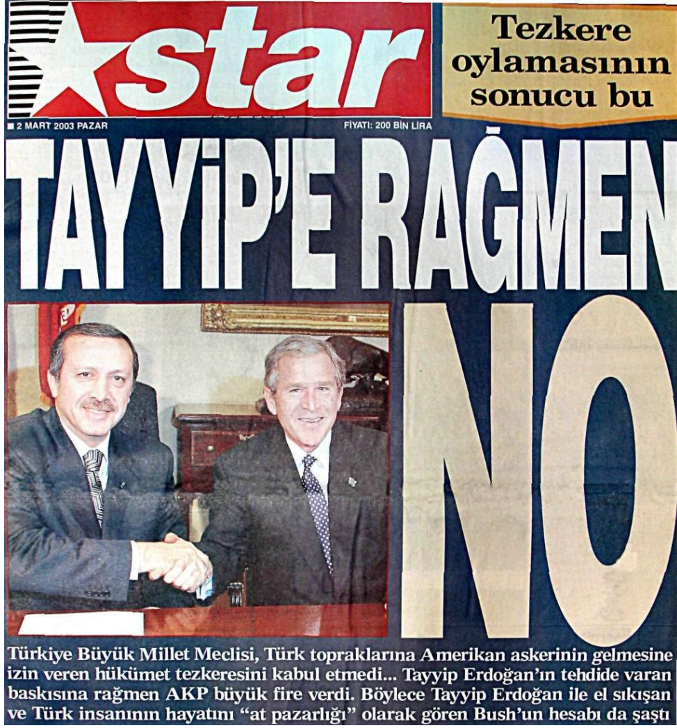
Şekil.17. Tezkere Oylamasının Sonucu Haberi