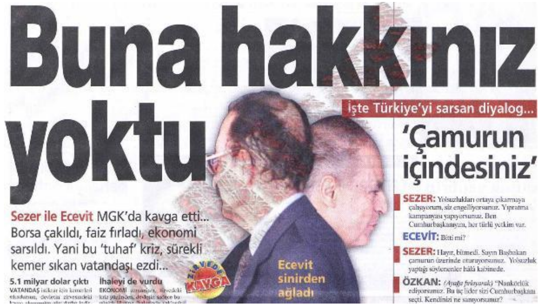
Şekil.13. Buna Hakkınız Yoktu Haberi

Milliyet "Buna hakkınız yoktu" "Sezer ile Ecevit MGK'da kavga etti... Borsa çakıldı, faiz fırladı, ekonomi sarsıldı. Yani bu 'tuhaf' kriz, sürekli kemer sıkamayan vatandaşları ezdi."