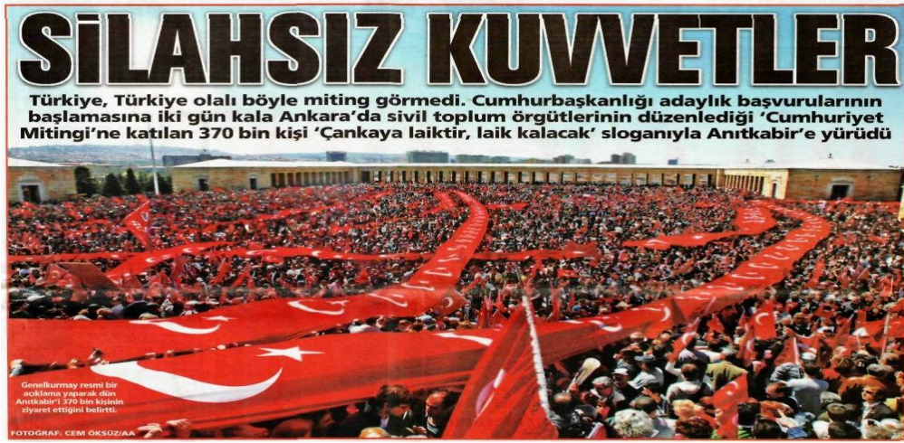
Şekil.24. Silahsız Kuvvetler Haberi

yaptığı haberler de duruma koşut şekilde oluşmaktaydı. İki farklı kutbun, birbirlerini bastırmaya çalıştıkları bir propaganda savaşı yaşanıyordu. Atılan bazı başlıklar şu şekildeydi.