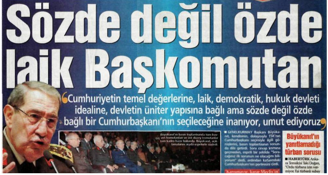
Şekil.23. Laiklik Uyarısı Haberi