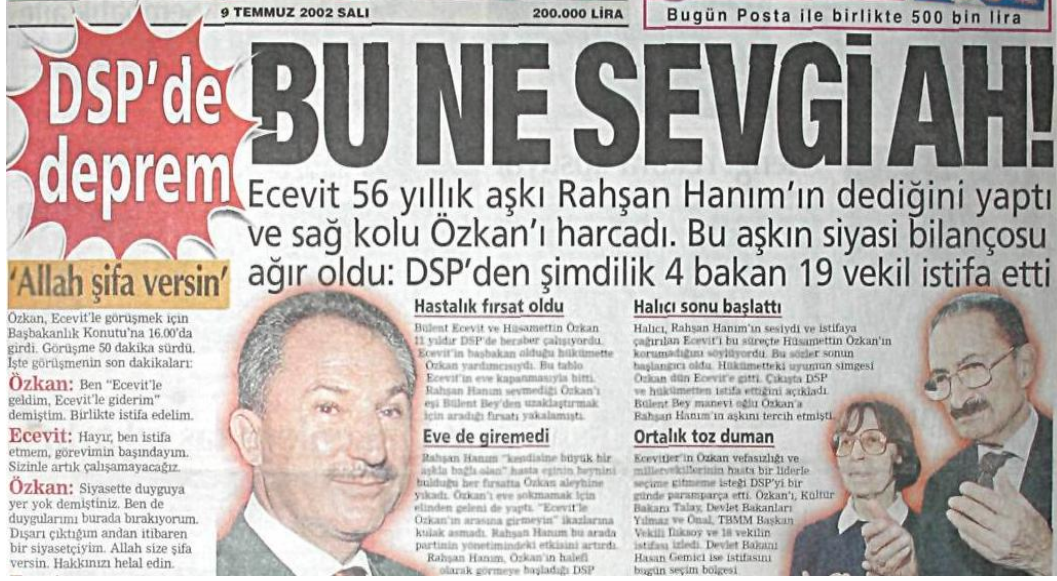
Şekil.16. DSP'de Deprem Haberi