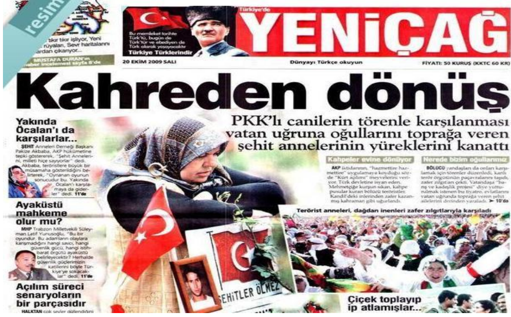
Şekil.27. Kahreden Dönüş Haberi