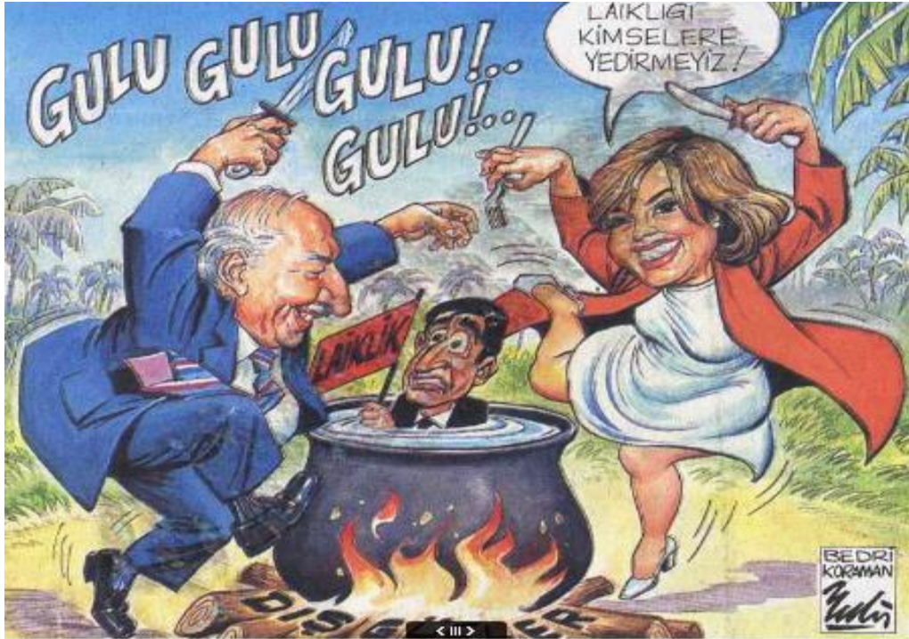
Şekil.4. Erbakan-Çiller Laiklik Karikatürü

4 Şubattaki Milliyet'te ise ilk sayfa baştan aşağı irticai tehlikeyi işleyen haberler ile doluydu. Manşetler şöyleydi. "Tehlikeli gidiş", "Türbana formül", "Sağduyu çağrısı"