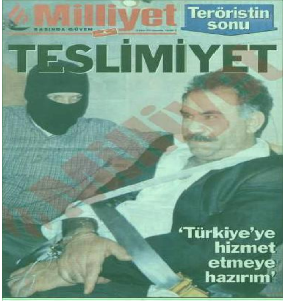
Şekil.8. Teslimiyet Haberi