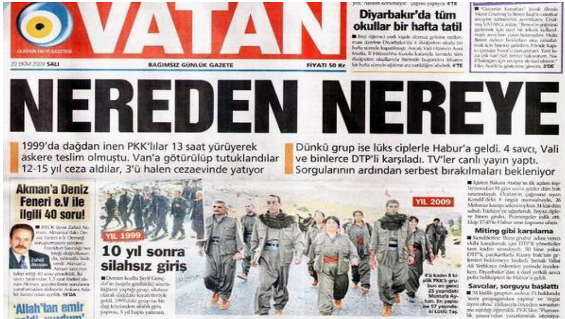
Şekil.26. Nereden Nereye Haberi

Habertürk, "150 bin dolarlık ciple indiler" "Kuzey Irak'taki Kandil ve Mahmur kamplarından gelen 34 PKK'lı sınıra son model ciplerle taşındı", Vatan, "Nereden nereye" "1999'da dağdan inen PKK'lılar 13 saat yürüyerek askere teslim olmuştu. Van'a götürülüp tutuklandılar 12-15 yıl ceza aldılar, 3'ü halen cezaevinde yatıyor. Dünkü grupsa lüks ciplerle Habur'a geldi. 4 savcı, vali ve binlerce DTP'li karşıladı. TV'ler canlı yayın yaptı. Sorgularının ardından serbest bırakılmaları bekleniyor"