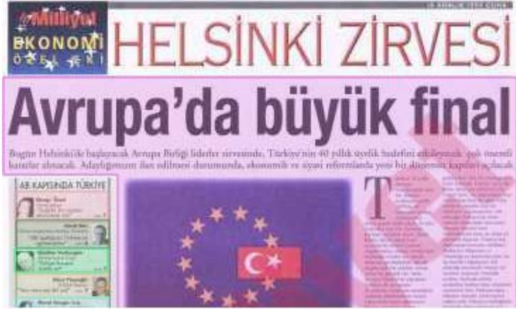
Şekil.10. Helsinki Zirvesi Haberi