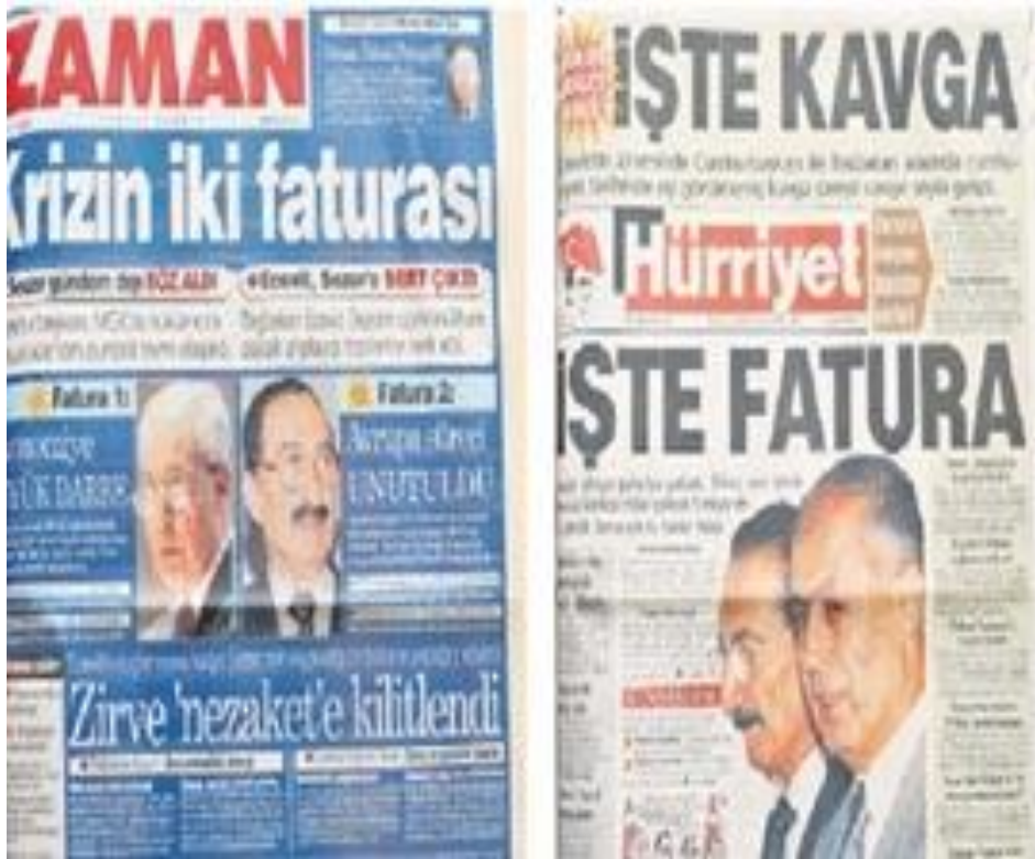
Şekil.12. Ekonomik Kriz Haberi

2001'deki ekonomik kriz cumhurbaşkanı Ahmet Necdet Sezer'in Başbakan'a anayasa kitapçığı fırlatması ile ortaya çıkan bir ekonomik çözüme sürecinin başlangıcı olmuştu. Aslında uzun süredir kötü giden ekonomi, biriken sorunlar ve artık sorunun kendisini oluşturan sistem çöküş sinyalleri veriyordu. MGK toplantısında yaşanan olay ise bu gidişatın patlayıp bir kriz olarak tüm ülkeyi sarmasına yol açmıştı. Medyada hükümeti suçlayan ifade ve görüşler her yerdeydi. Siyaset de medyanın yarattığı bu havadan etkilenerek bir yol ayrımı dönemine giriyor; DSP bölünüyor, AKP kuruluyor ve nihayet yılsonunda kasım seçimleri ile siyasette yeni bir sayfa açılıyordu.