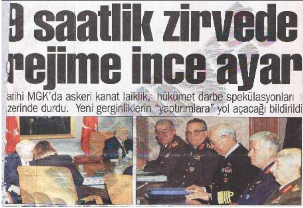
Şekil.5. MGK Sonrası Alman Kararlar Haberi