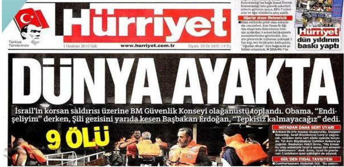
Şekil.31. Dünya Ayakta Haberi