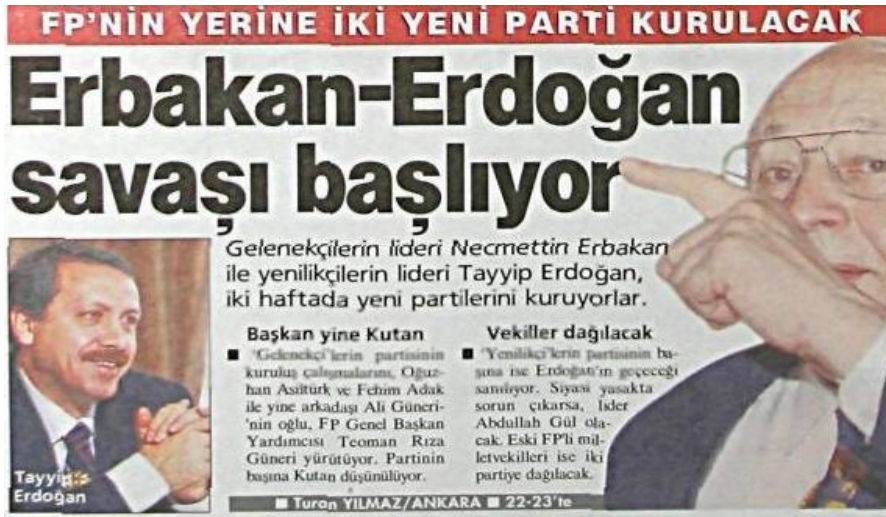
Şekil.15. Erbakan-Erdoğan Savaşı Haberi

Akit, "Kamuoyu MGK'daki Sezer-Ecevit kavgası ile şoka uğradı... Sezer'in 'hukuka saygılı olun' dediği Ecevit, devlet geleneğinde görülmeyen bir tavır sergileyerek toplantıyı terk etti ve 3 defa TV kameraları önüne geçti. Milli Gazete "Ne yaptığını bilmiyor" "Başbakan Ecevit'in Milli Güvenlik Kurulu'ndaki gerginliği kamuoyuna şok bir şekilde açıklaması piyasaları göçertti. Merkez Bankası'ndan döviz talebi 5 milyar dolara ulaştı, gecelik faiz oranları yüzde 760'a fırladı. Borsa 8 bin 500'e kadar düştü."