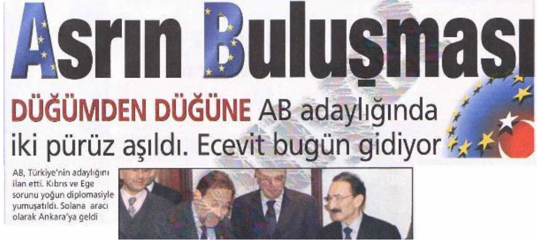
Şekil.11. Asrın Buluşması Haberi