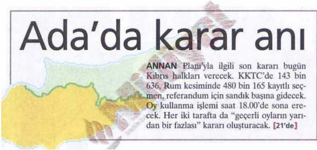
Şekil.20. Ada'da Karar Anı Haberi

Haber kanallarında tüm gün katılımcıların yorum ve tartışmalarına yer veriliyor, çok izlenen televizyon kanallarının çok izlenen ana haber bültenlerinde Kıbrıs asıl gündem maddesiydi. İnternetteki haber kaynakları da asıl esas gündem maddesi olarak Kıbrıs'taki referandumunu belirlemişlerdi.