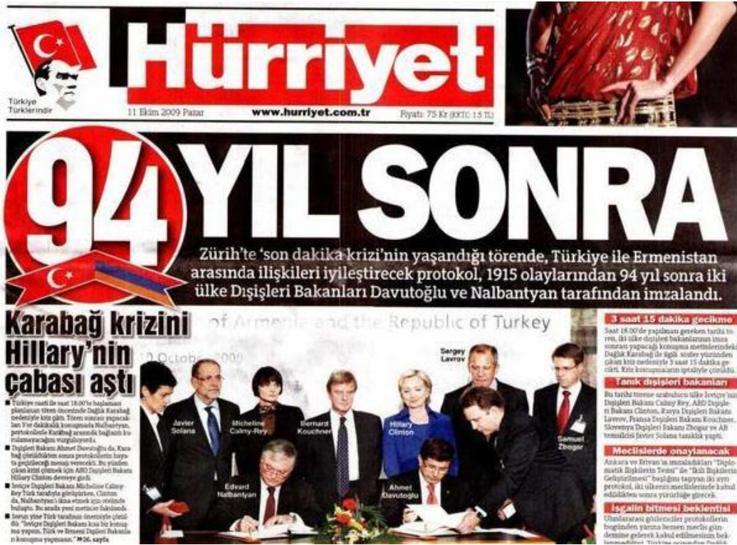
Şekil.29. 94 Yıl Sonra Haberi

Sabah, "Barış krizi aştı" " Türkiye-Ermenistan arasında ilişkileri normalleştirmeyi öngören çifte protokol, Zürih'te 3 saat süren krizin ardından imzalandı"; Milliyet, "Nefes kesen 3 saat" "Türkiye ile Ermenistan arasındaki tarihi protokol 3 saatlik gecikmeyle imzalandı. Kriz nedeni, bakanların konuşmalarındaki birer kelimeydi. İki bakan da konuşmaktan vazgeçince kriz aşıldı ve yeni dönem başladı"; Vatan, "Zoraki nikâh" "Ermeni bakan diaspora baskısıyla törende soykırım demek isteyince İsviçre'de kriz çıktı. Clinton, Ermenileri güçlkle ikna etti. Nalbantyan 3 saat sonra asık bir suratla protokolü imzaladı. Türkiye'nin önerisiyle bakanlar törende konuşmadı"; Posta, "Sessizce tarih yazdılar", Takvim, "Ermeni açılımı" "Türkiye ve Ermenistan 88 yıl sonra masaya oturdu. Komşunun çıkarttığı krize rağmen, yeni bir süreci başlatacak imzalar atıldı", Zaman, "Son dakika krizini Türkiye'nin teklifi çözdü" "Türkiye ile Ermenistan arasındaki imza töreni son dakika krizi yüzünden gecikmeyle yapılabildi".