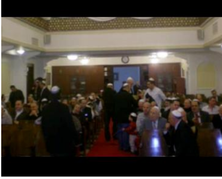
Fotoğraf 15: Genel sekreterin sinagog ortamındaki kutlamalardan bahsederken Musevi cemaatinin bir arada olduđu kutlamaları görürüz.