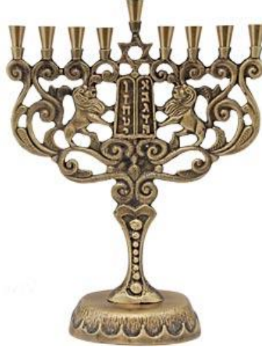
Şekiller 1 : Hanukiya: Dokuz kollu şamdandır.

“Işıklar Bayramında akıl, anlayış, hak ve adalet “ışık” ile sembolize edilir. Bu semboller karanlık, cehalet, haksızlık ve anlayışsızlığın alt edilmesi anlamına gelir.Hanukiya tüm sinagog ve Yahudi evlerinde, sekiz gece boyunca yakılan dokuz kollu şamdanın adıdır.Bu şamdanların üzerleri genelde aslan, altı köşeli yıldız ve benzeri motiflerle süslenir ve yapımında metal, teneke ya da cam kullanılır. Bazı Hanukiyalar yağla yanar ve mum yerine yağ filitreleri kullanılır. Her Yahudi mum veya kandillerin yakılışını izlemek zorundadır. Kislev ayının 24.günü, hava karardıktan hemen sonra yıldızlar gökyüzünde belirdiğinde Hanukiya'nın ilk mumları dualarla yakılır” (Altıntaş, 1996, s.62).