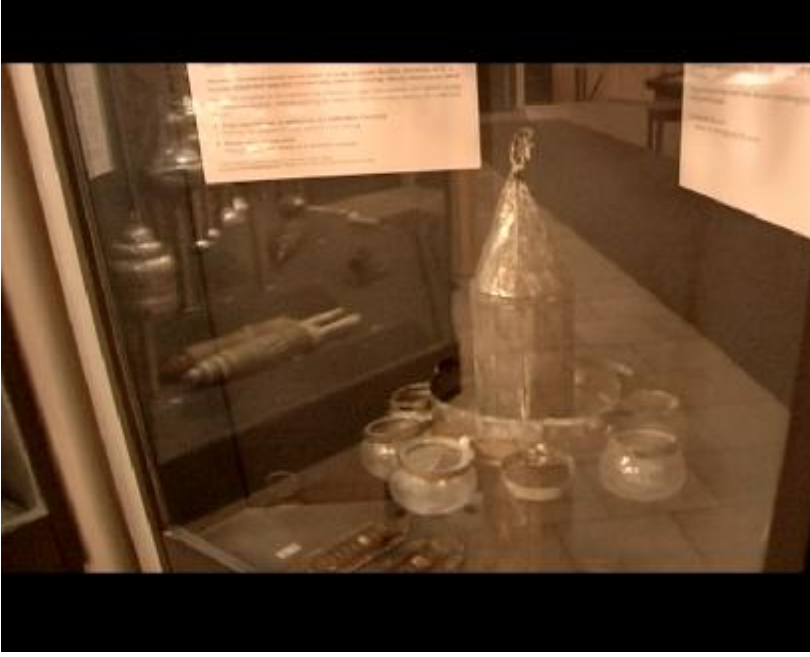
Fotoğraf 5: Burada Hanuka ile ilgili konuşulurken geçmişten günümüze gelen, İslam sanatı ve mimarisinden etkilenmiş Hanuka töreni şamdanlarını İslami motiflerle süslenmiş halini görüyoruz.