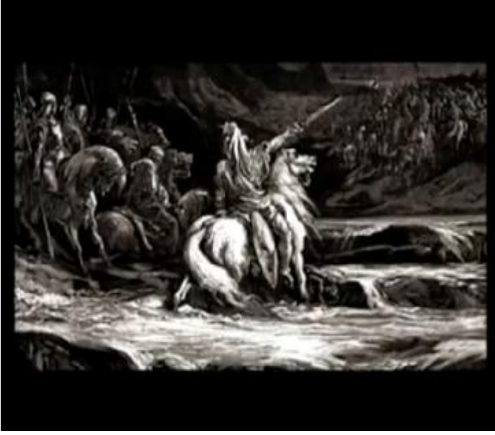
Fotoğraf 19: Gravürler ile anlatılan bir savaş. Yahudilerin karanlıktan aydınlığa çıkışlarını anlatıyor Madame Fanny.