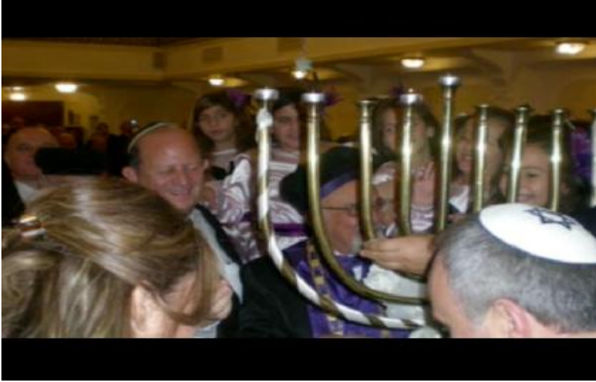
Fotoğraf 14: Caddebostan sinegogunda Musevi dini liderlerin katıldığı bir Hanuka töreni.