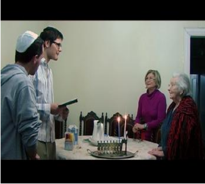
Fotoğraf 18: Ev ortamında Hanuka kutlama töreni, mumlar yakılır ve dualar edilir.