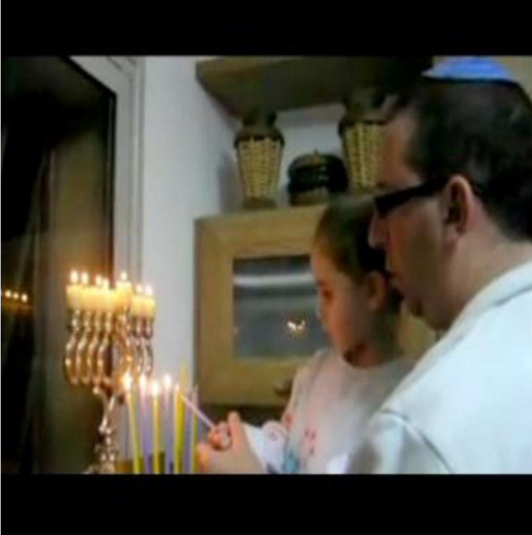
Fotoğraf 22: Ufak çocuklara geleneklerin öğretilmesinden bahsediyor.