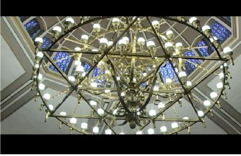
Fotoğraf 27: Törenin sonuna doğru sinegog içerisinde ışıkların arasında Davud'un yıldızını görürüz.