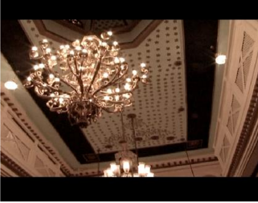
Fotoğraf 9: Bize Işıklar Bayramının tarihsel sürecinden ve neden adının Işıklar Bayramı olduğundan bahsediliyor.