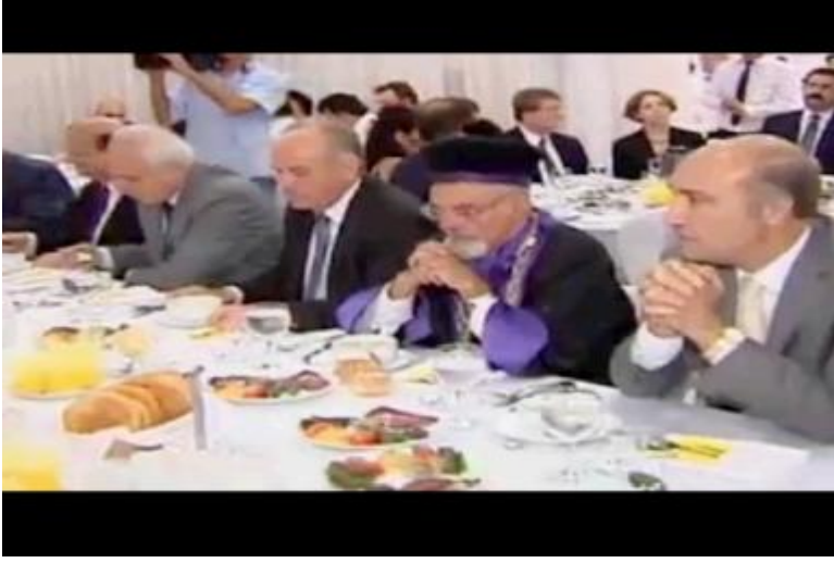
Fotoğraf 25: Genel sekreter bize Hanuka Bayramını Müslümanlarla ve Ramazan Bayramını da musevilerle kutlamaktan bahsederken.