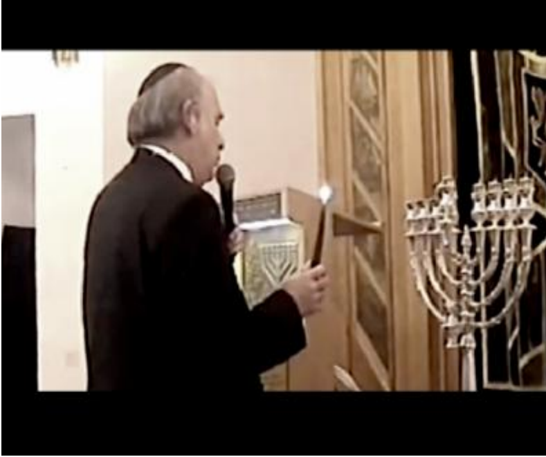
Fotoğraf 26: Sinegogta törensel Hanuka şamdanının, sekiz köşeli şamdanın yakılışı.