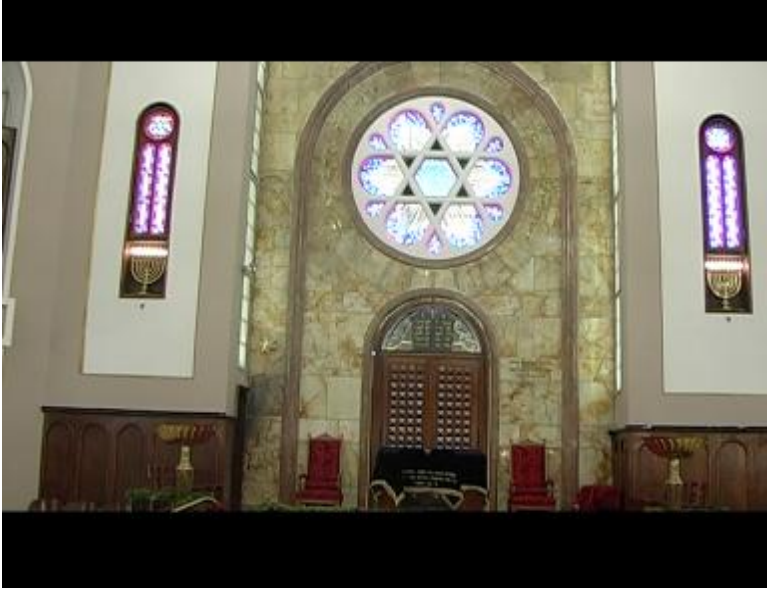
Fotoğraf 11: Sinegog ortamını ve törensel kutlama alanını görüyoruz.