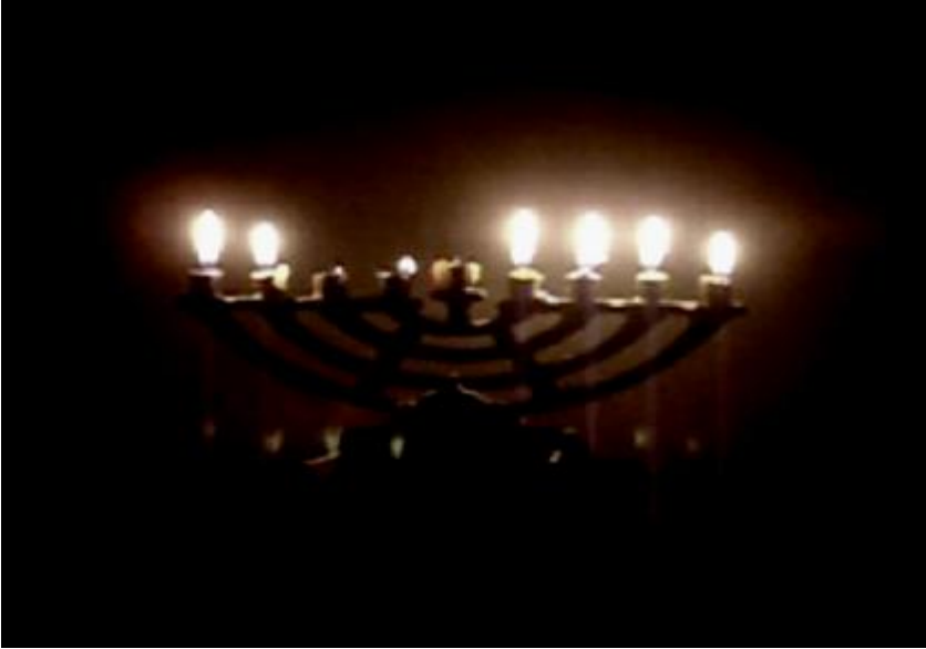
Fotoğraf 28: Ekran ağır bir şekilde kararmaya başlar ve sekiz köşeli şamdan belirir.