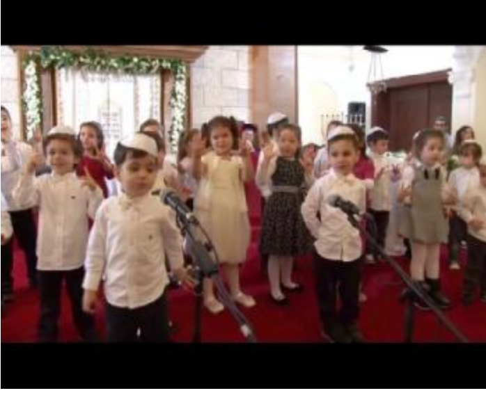
Fotoğraf 23: Sinegog ortamında ufak çocukların sergilediği gösterileri görüyoruz.