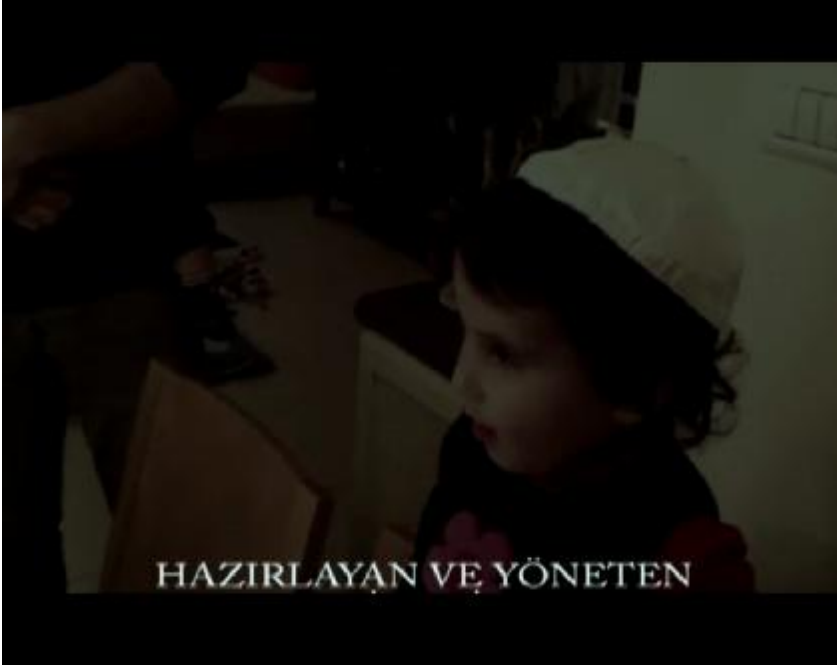
Fotoğraf 30: Koro Hanuka şarkısını söyler ve ekran yavaş yavaş kararmaya başlar ve jenerik akmaya başlar.