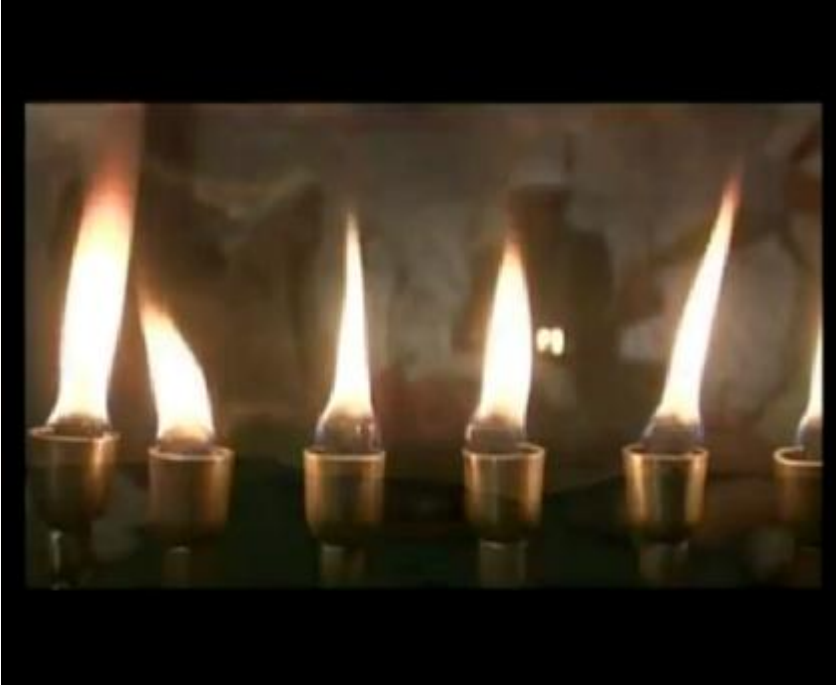
Fotoğraf 10: Işıklar bayramında zeytin yağı ile yapılan ve filtreler koyulup ateşlenen en doğal hanuka şamdanını görüyoruz.