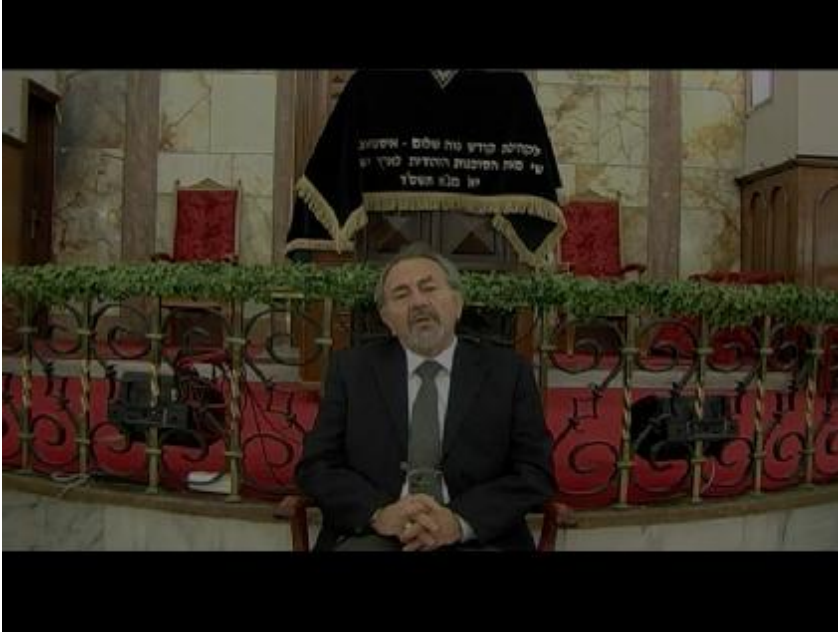
Fotoğraf 2: Film başladıktan sonra karşımıza sinagog ortamında konuşma yapan bir Hahambaşılık görevlisi çıkar ve Hanuka hakkında bilgi vermeye başlar.