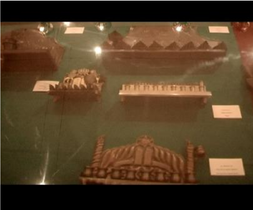
Fotoğraf 6: Belgeselimizin ilerleyen dakikalarında tarihten günümüze kadar gelmiş olan ağaç oymacılığı ile işlenmiş Hanuka şamdanlarını aktarıyoruz.