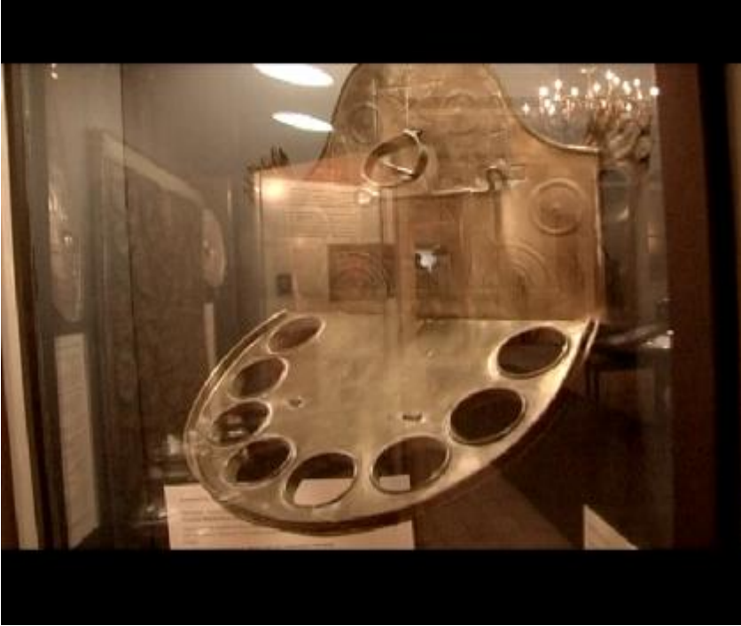
Fotoğraf 4: Hanuka şamdanlarının İslami motiflerle süslenmiş halini görüyoruz.