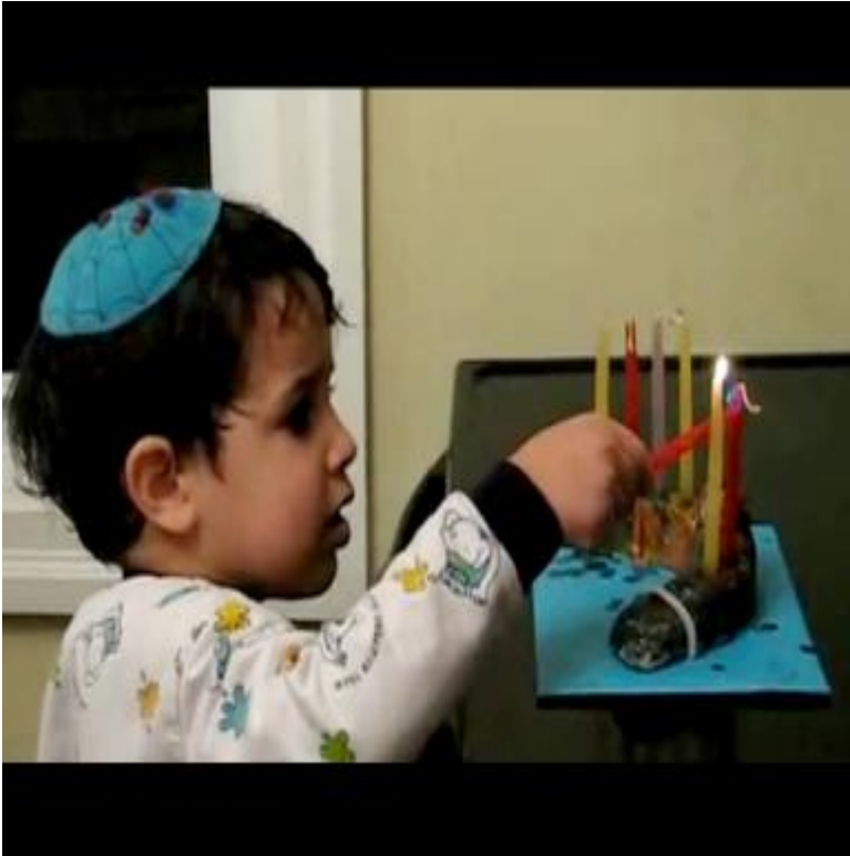
Fotoğraf 12: Evde kutlanan Hanuka töreninde bayramı sevdirmek adına ilk mumu evin en küçüğü yakarken görüyoruz.