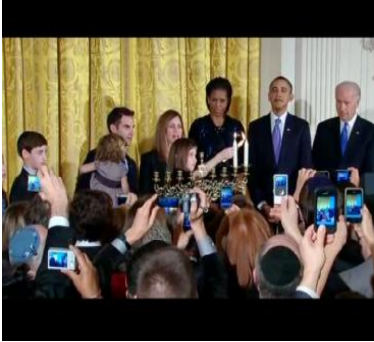
Fotoğraf 16: Avrupa ve Amerika'daki Hanuka töreninin kutlanışından bahsederken.