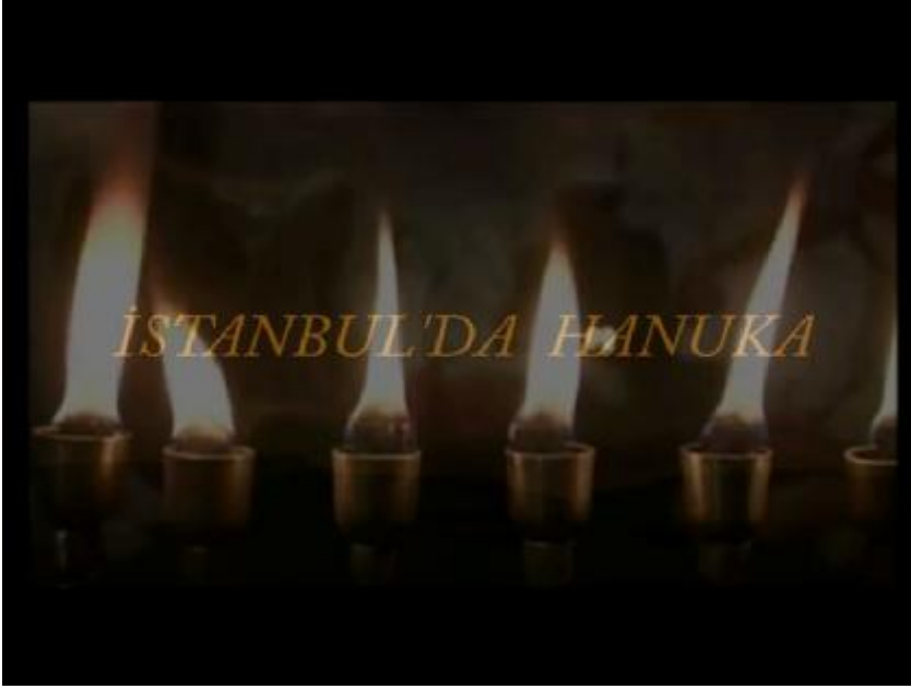
Fotoğraf 1: Eski Hanuka kandilleriyle filmin yazısı belirir ve bir anlatıcının konuşmasıyla film başlar.