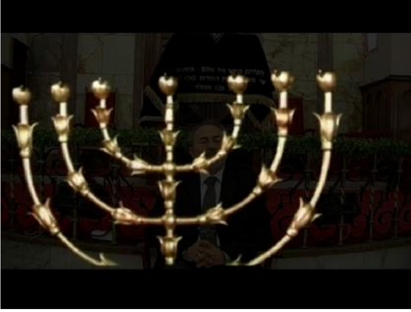
Fotoğraf 3: Merleyen dakikalarda Hanuka töreninde kullanılan simgesel Hanuka şamdanını görürüz.