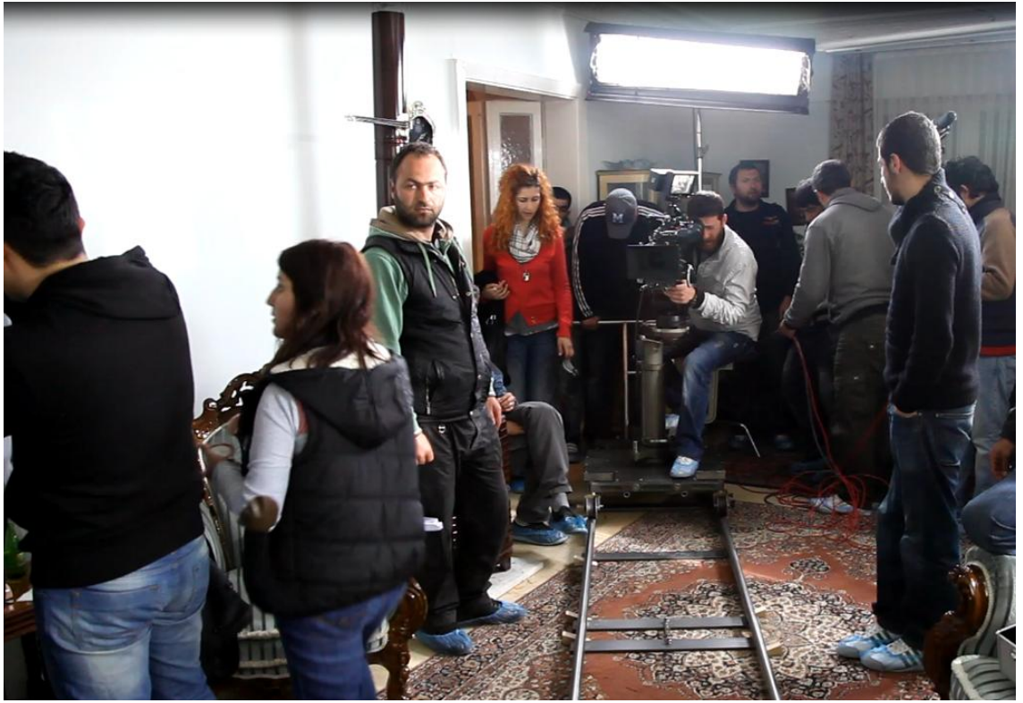
Öyle Bir Geçer Zaman Ki Dizisi (Set)