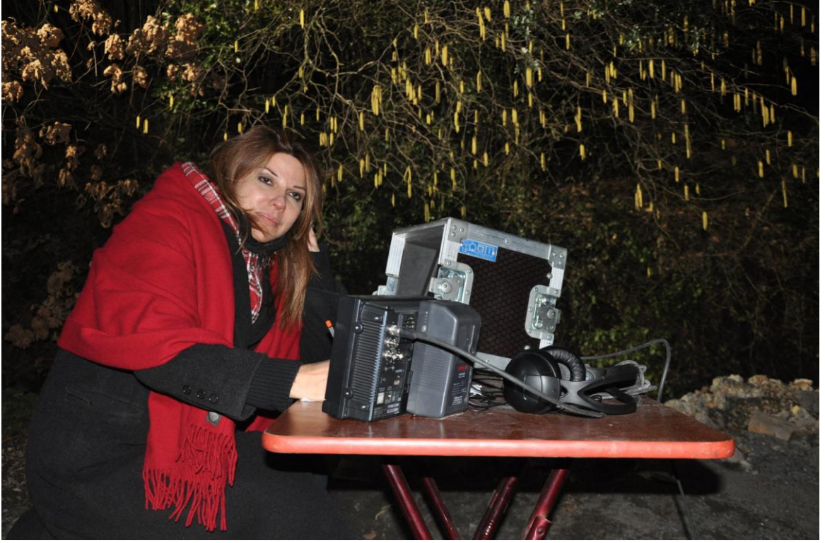
Palikarya filmi yönetmen