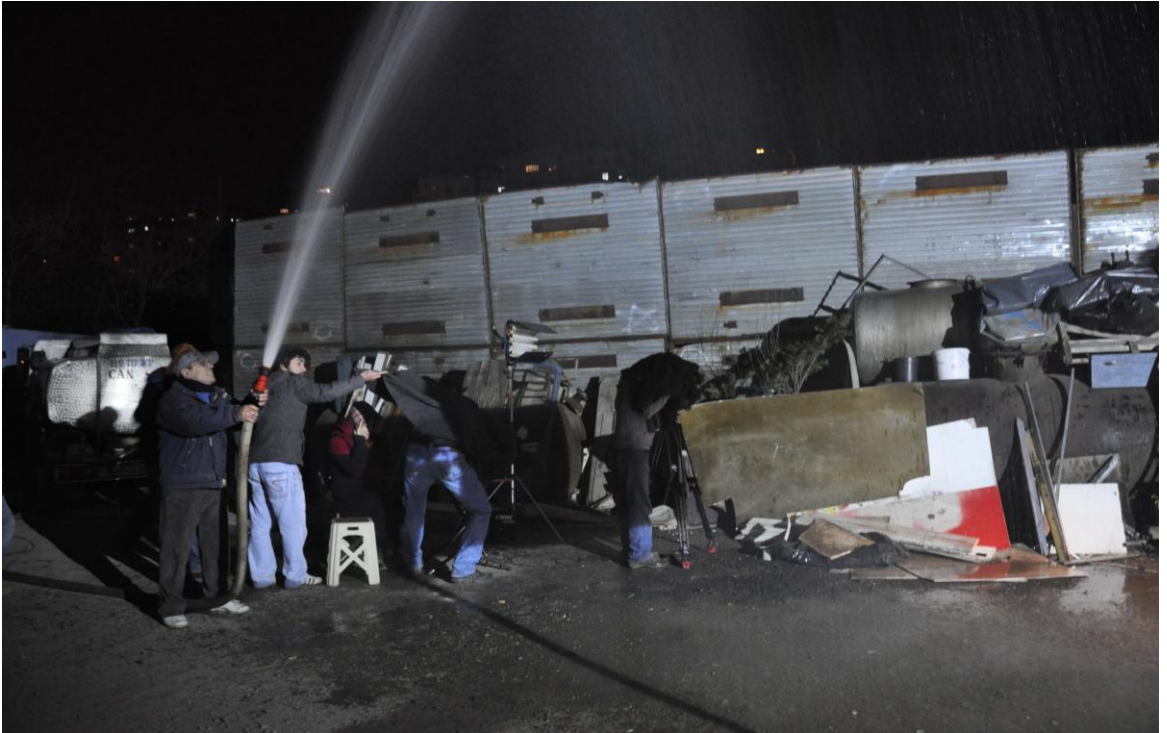
Palikarya filmi yağmur sahnesi