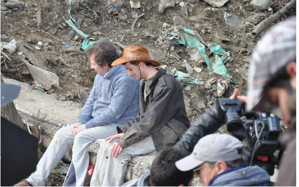
Palikarya filmi Palikarya ve Suskun Naci