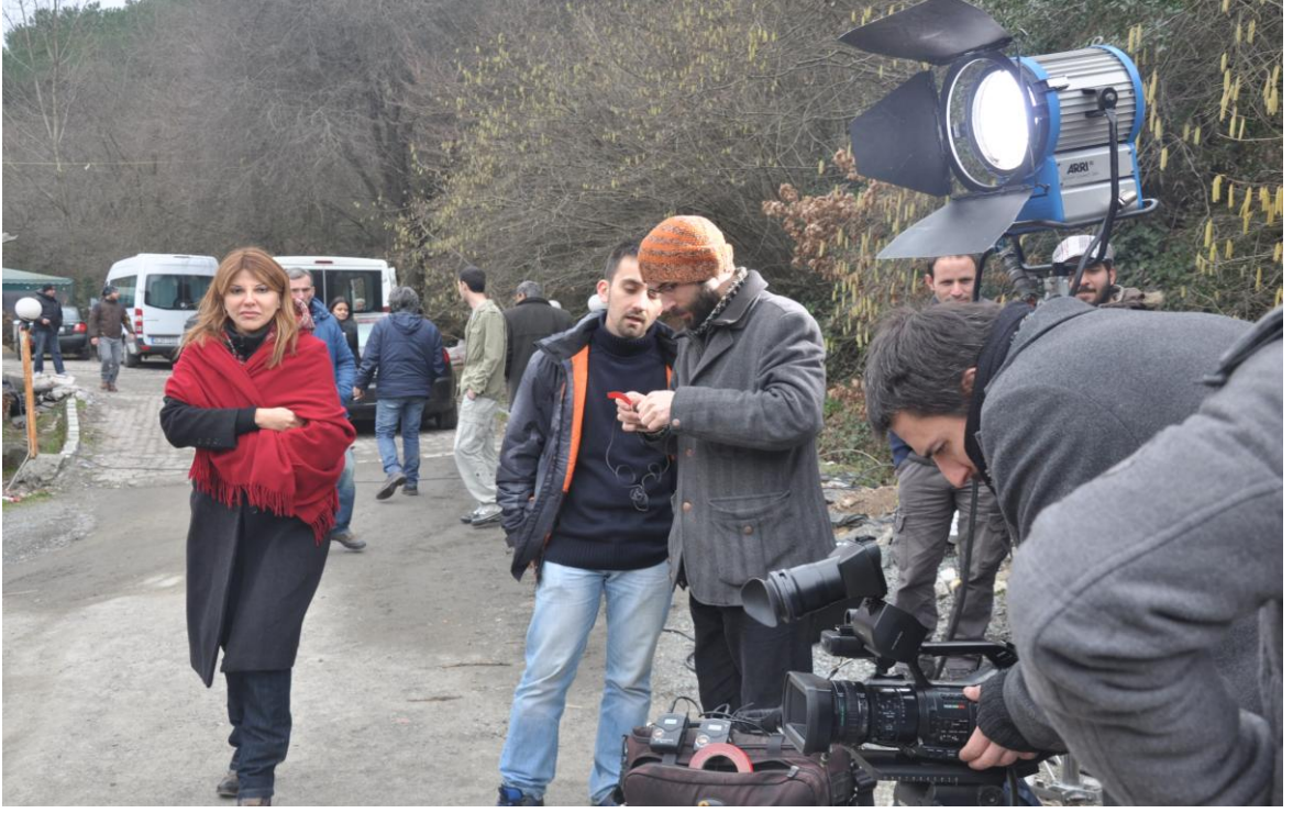
Palikarya filmi sokak çekimleri