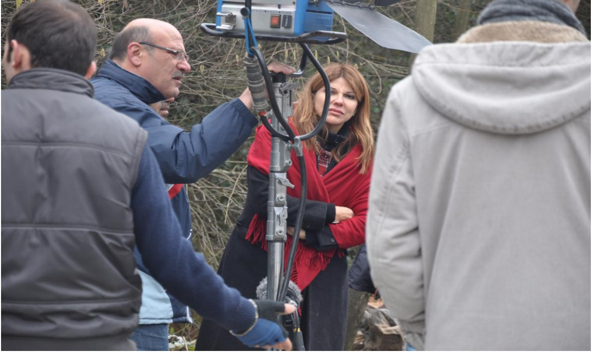
Palikarya filmi orman çekimlerinde yönetmen ve ekibi