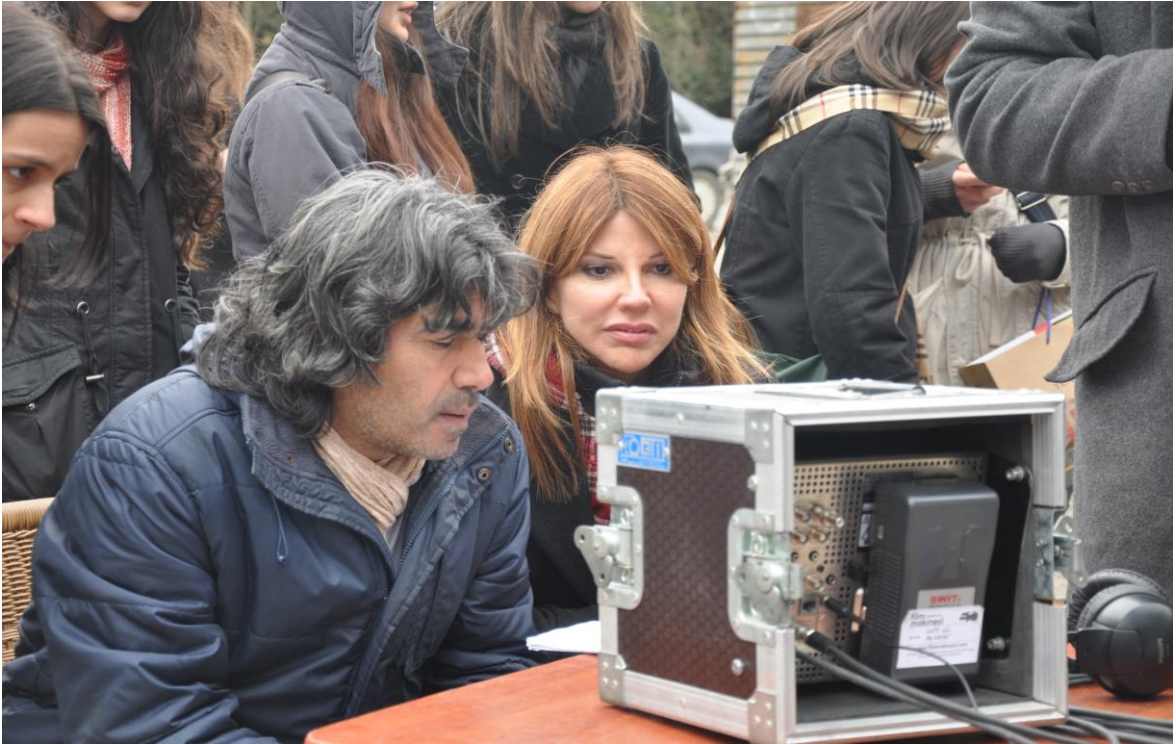
Palikarya filmi proje danışmanı ve yönetmen