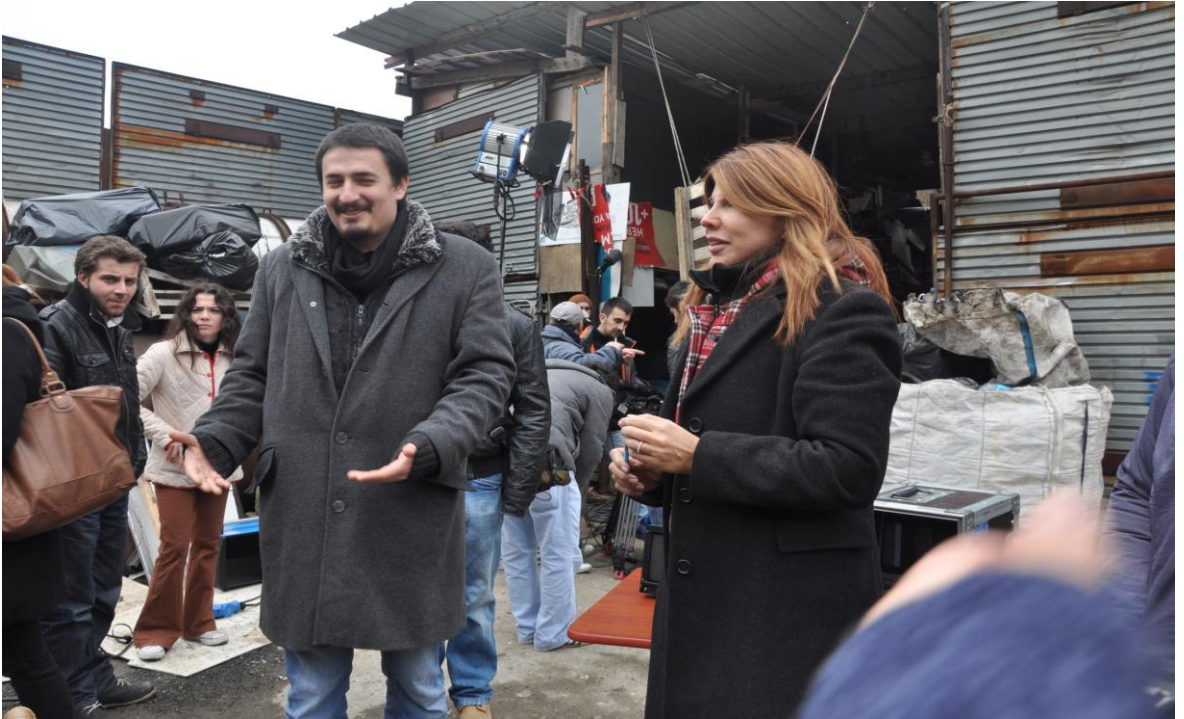
Palikarya filmi yapım koordinatörü ve yönetmen