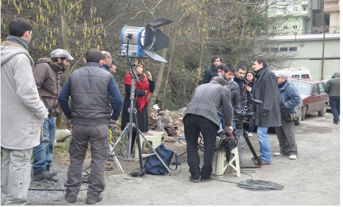
Palikarya filmi sokak çekimlerinde yönetmen ve film ekibi