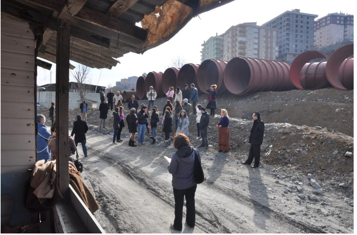
Palikarya filmi mahalle çekimleri