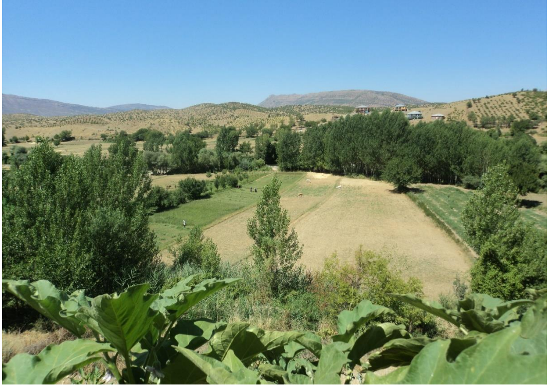
Ek-4: Çaybaşı Köyü