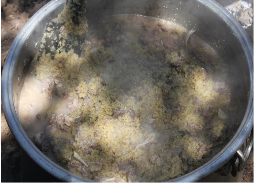
Ek-11: Geleneksel Düğün Yemeği