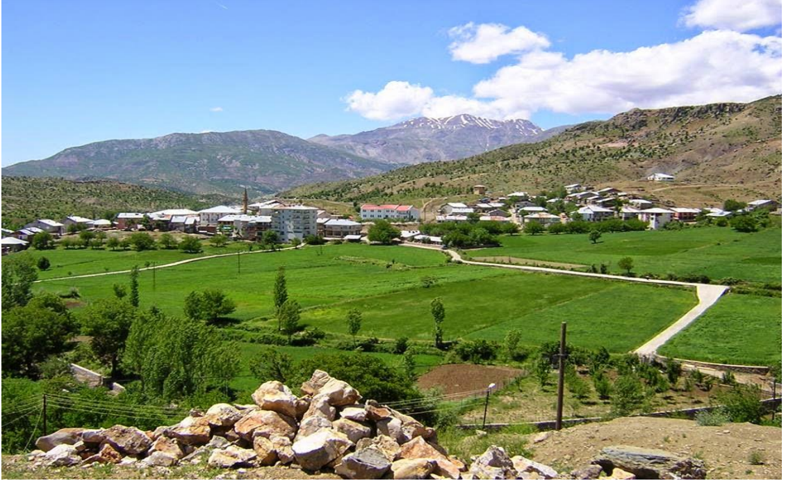
Ek-8: Servi Köyü