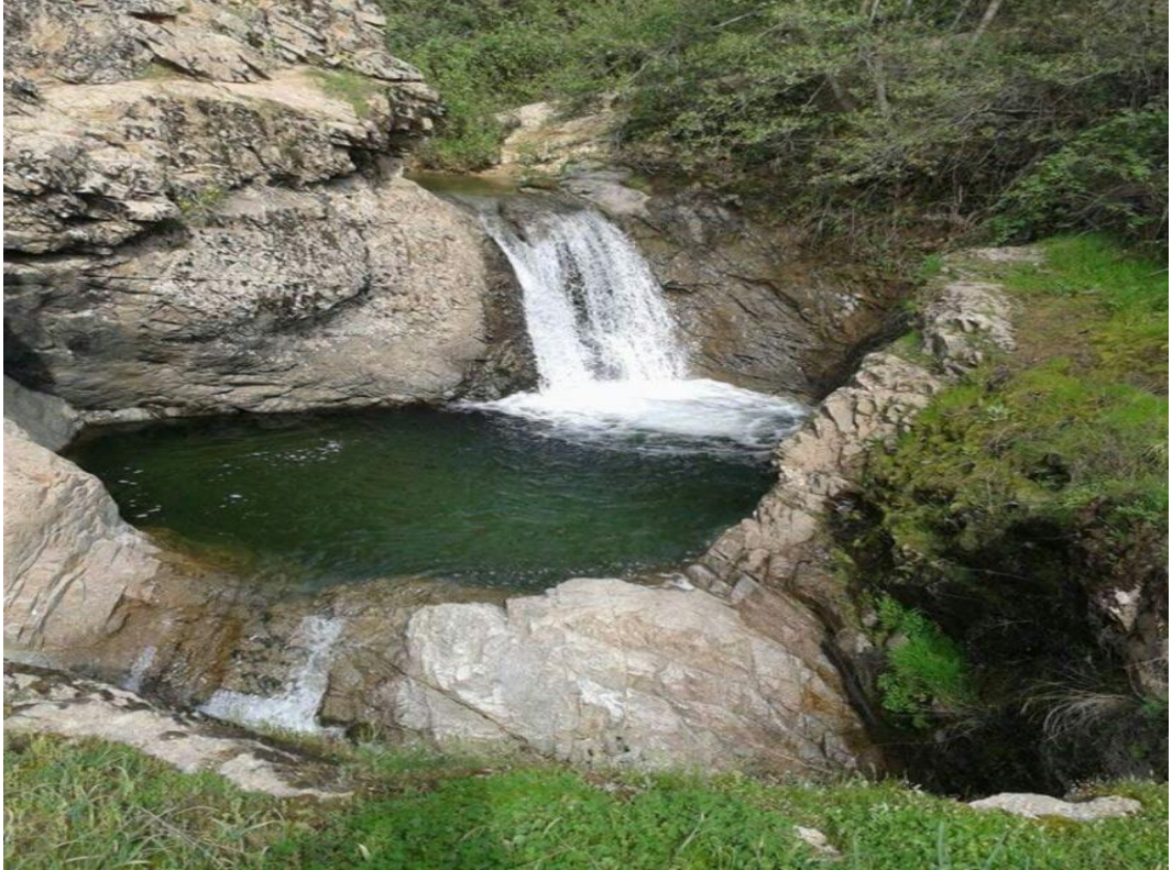
Ek-6: Gola Verari (Direkli Köyü)