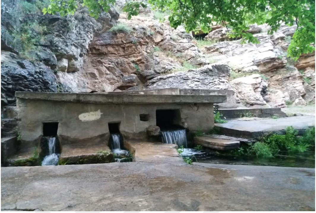
Ek-7: Harmancık Köyü Soğuk Su