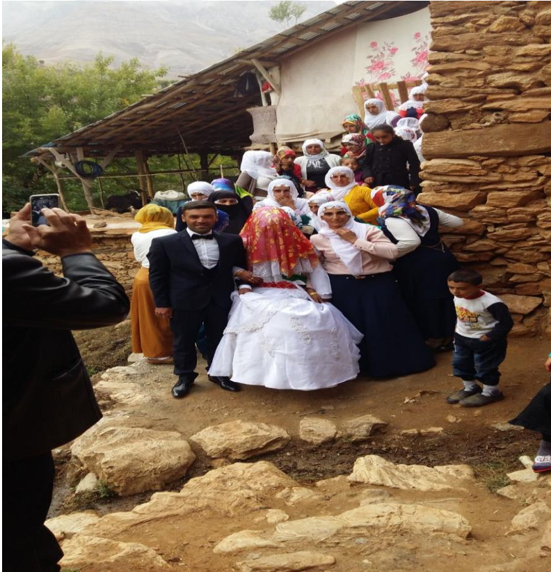
Ek-12: Bölgede Bir Düğün