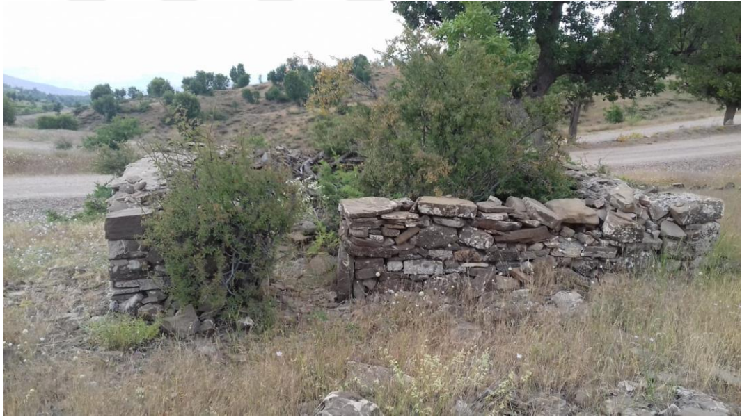
Ek-14: Ziyara Celaleddin