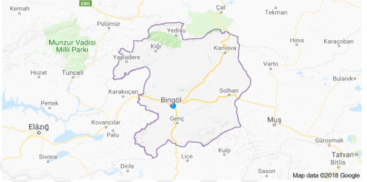
Ek-1: Bingöl İl Haritası