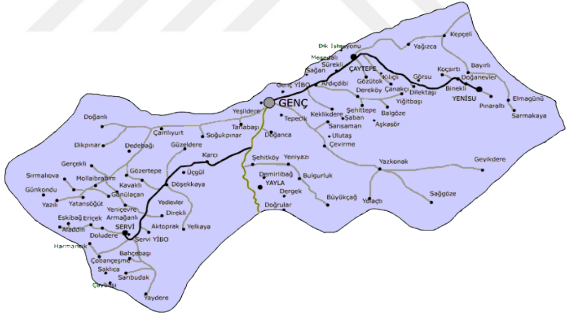
Ek-2: Genç İlçesi Haritası