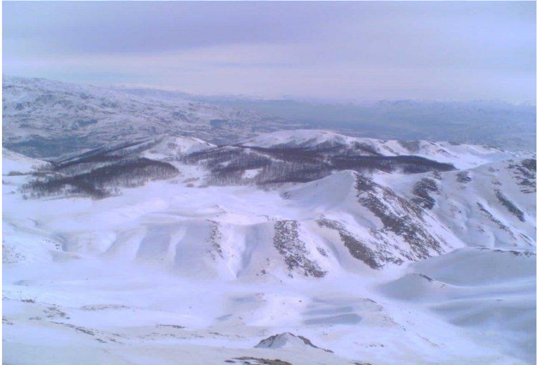
Ek-10: Gola Şekeran