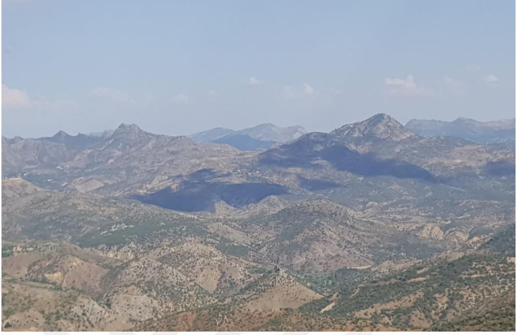
Ek-5: Çögürlü Mezrasından Sivan Bölgesi Görüntüsü