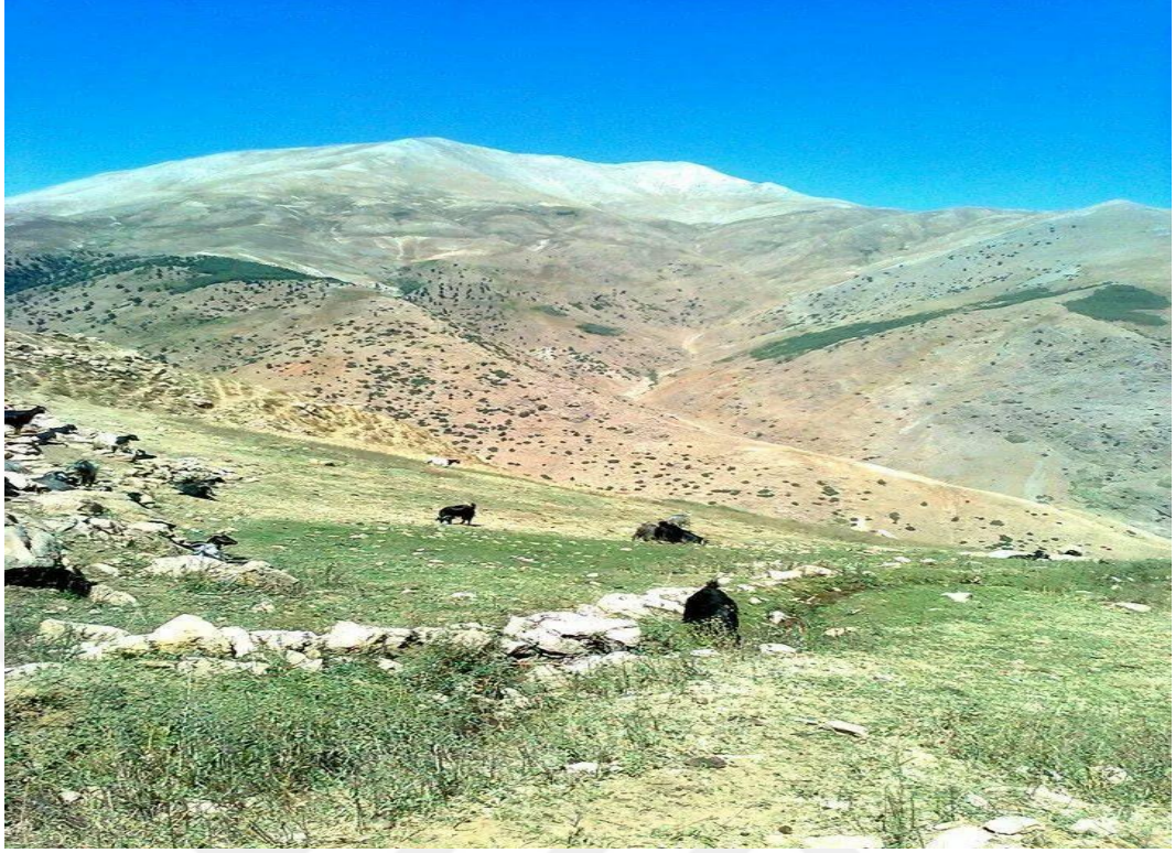
Ek-13: Kuy Şarık