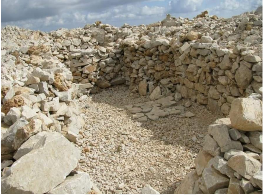
Ek-9: Kuy Şarık Camisi