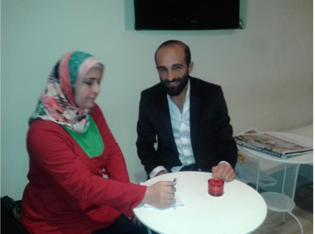
OĞLUMUN DRAMA ÖĞRETMENİ İLE RÖPORTAJ YAPARKEN