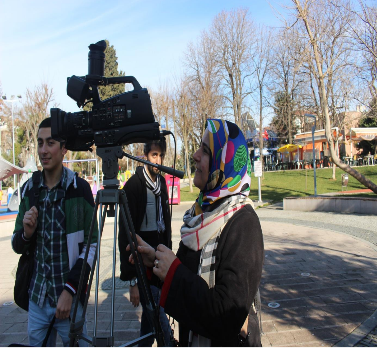
DIŐ ÇEKİM BAKIRKÖY PARKI