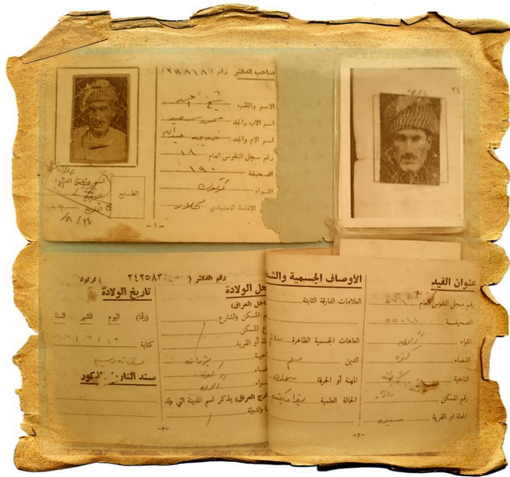
په گه زنامه ی شاکلی