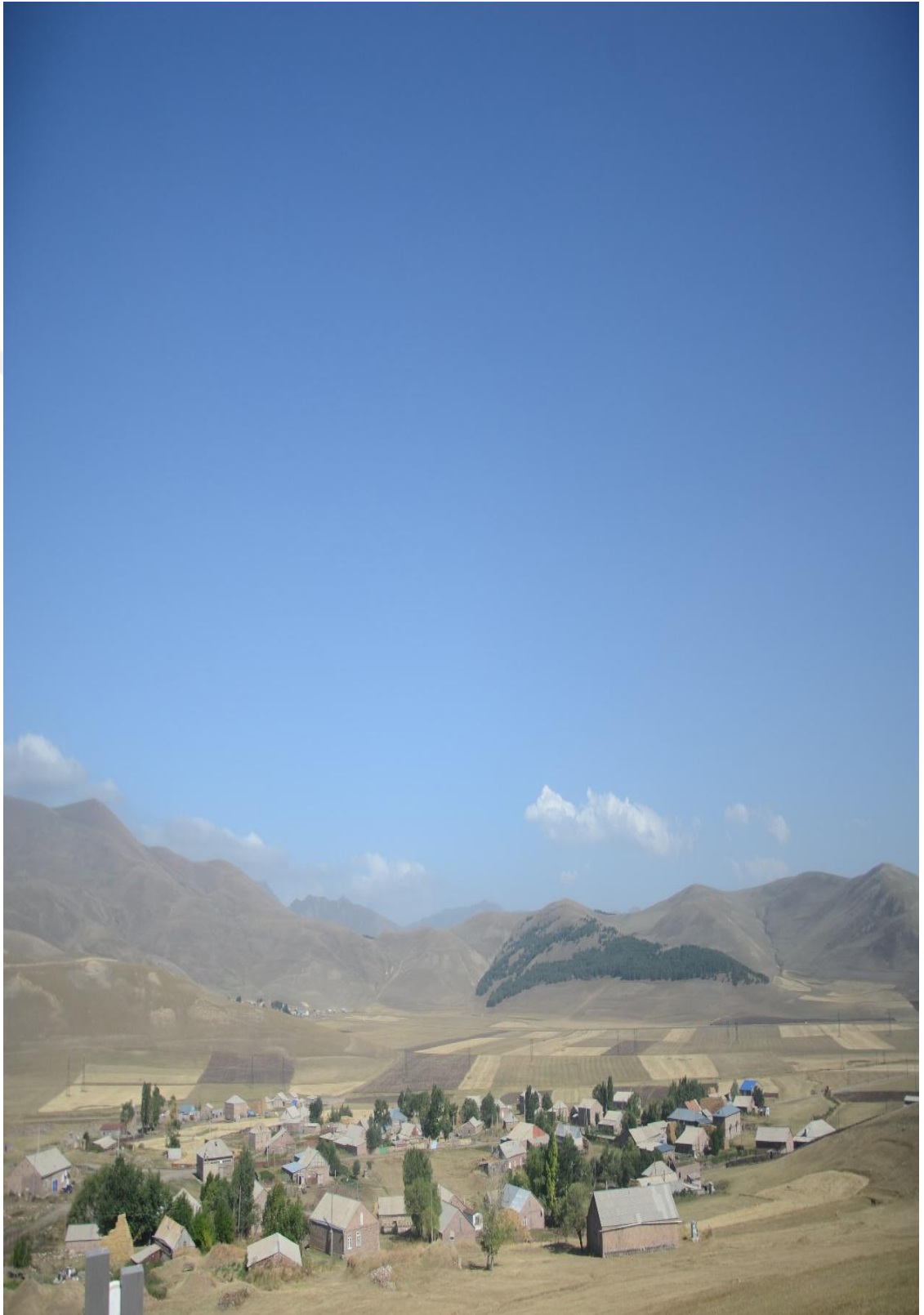
Wêneyê duyem: Ji dûr va Gundê Pampê-Îlon-2017