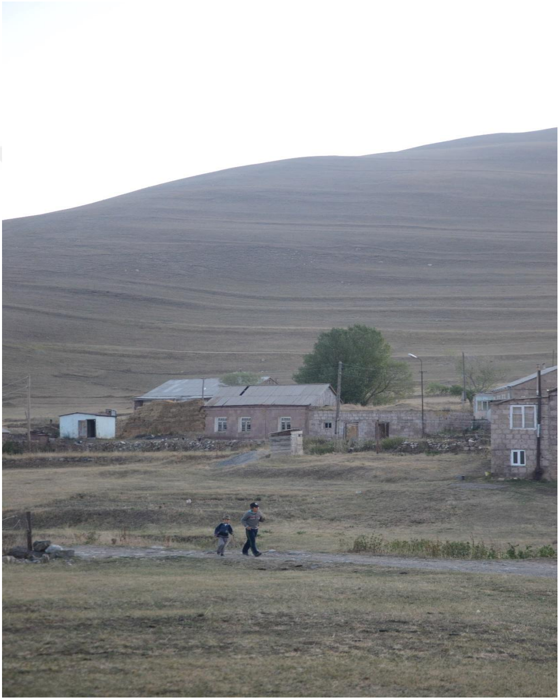
Wêneyê nehem: Berêvareka Gundê Pampê-Îlon-2017