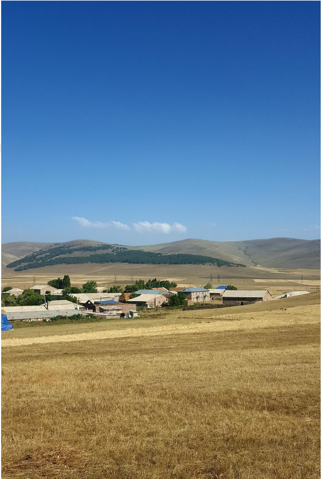
Wêneyê sêyem: Ji nêz va Gundê Pampê- Îlon-2017