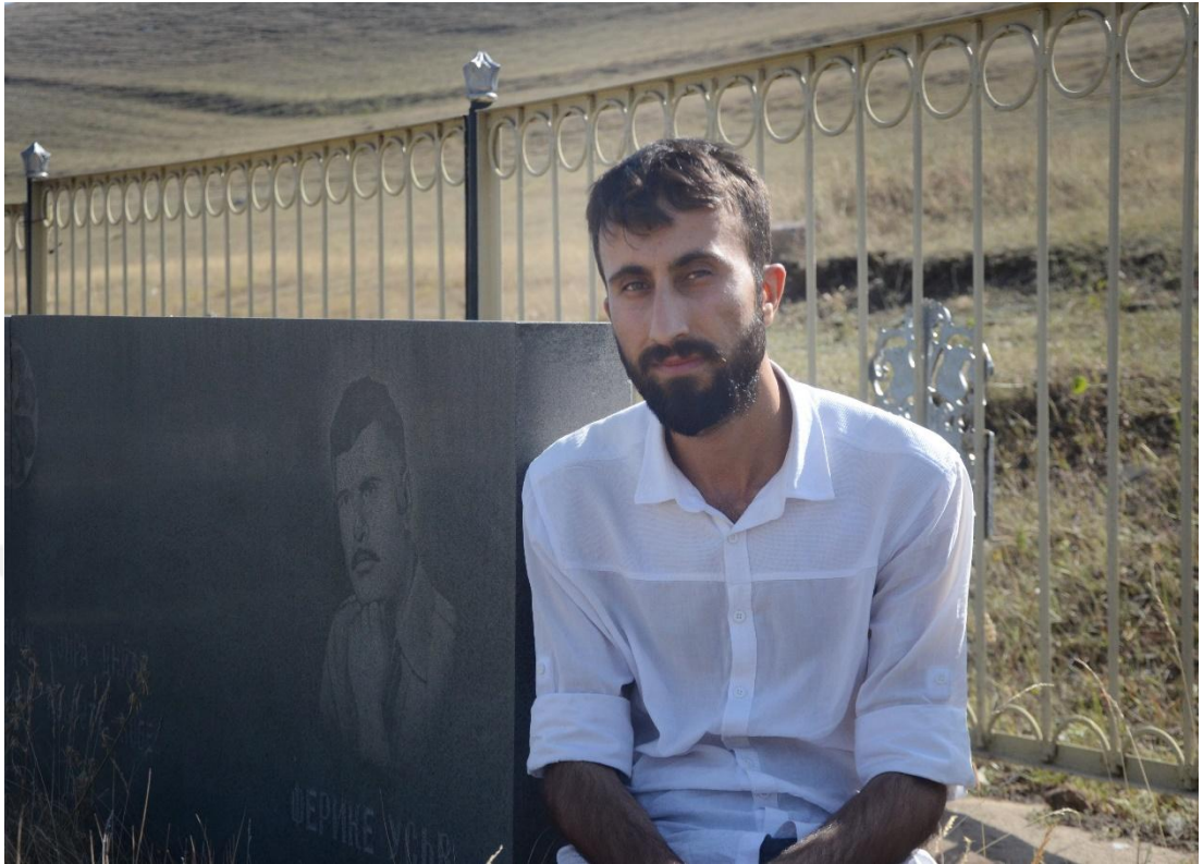
Wêneyê yanzdehem: Mem Artemêt li ser tirba Fêrikê Ûsiv-Îlon-2017