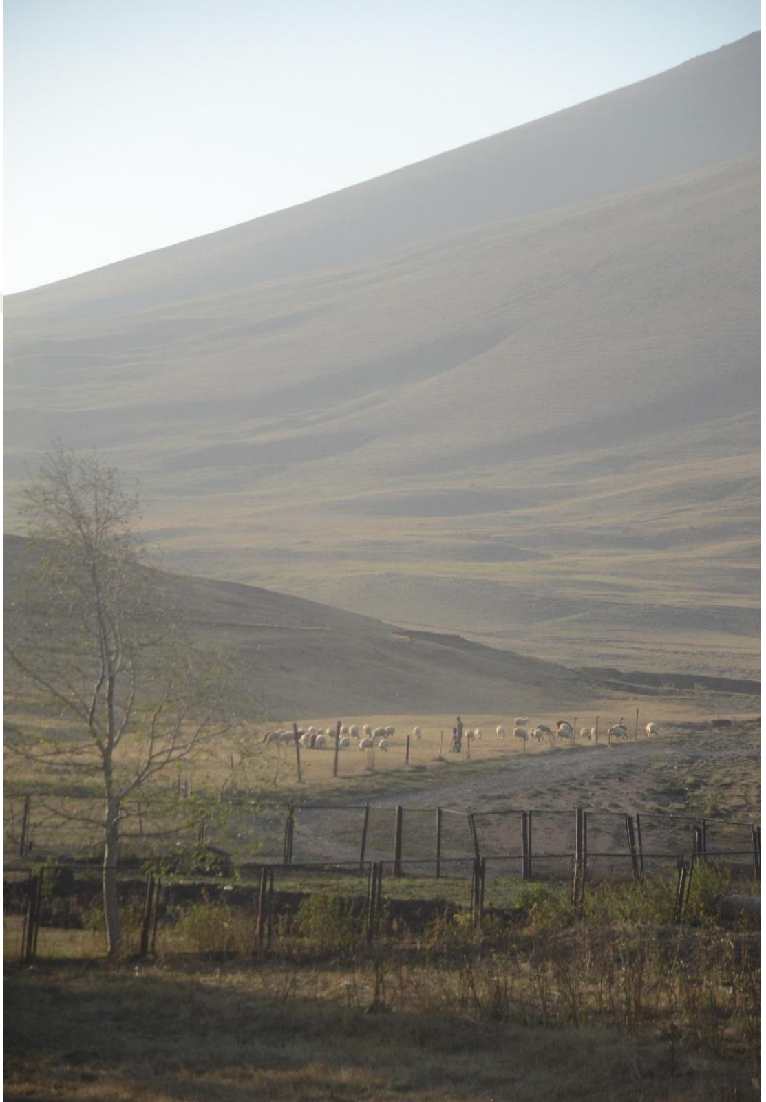
Wêneyê heftem: Dibûrên Pampê-Îlon-2017