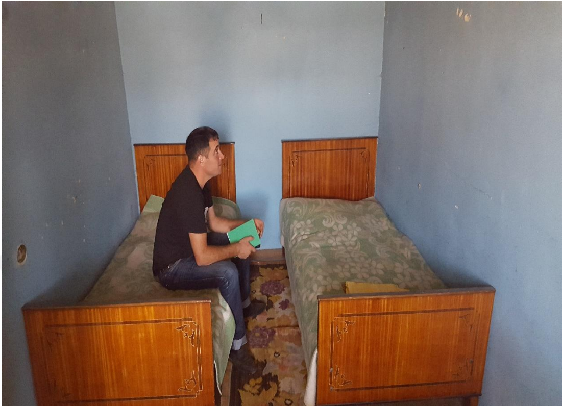
Wêneyê çarem: Nevîyê birayê Fêrikê Êsiv di odeyeka mal-mûzeyaya Fêrikê Êsiv da (navê neviyê birayê wî jî Fêrik e)-Gundê Pampê-Îlon-2017