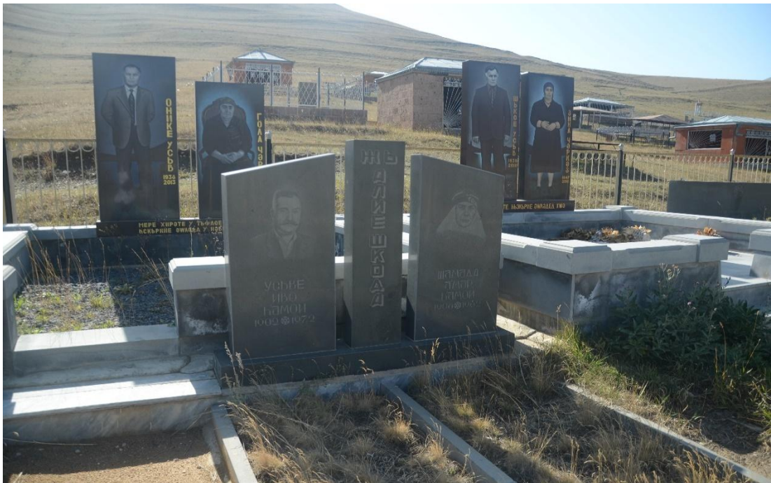
Wêneyê pêncem: Qebriştana mala Êsivê Îvo-Gundê Pampê-Îlon-2017