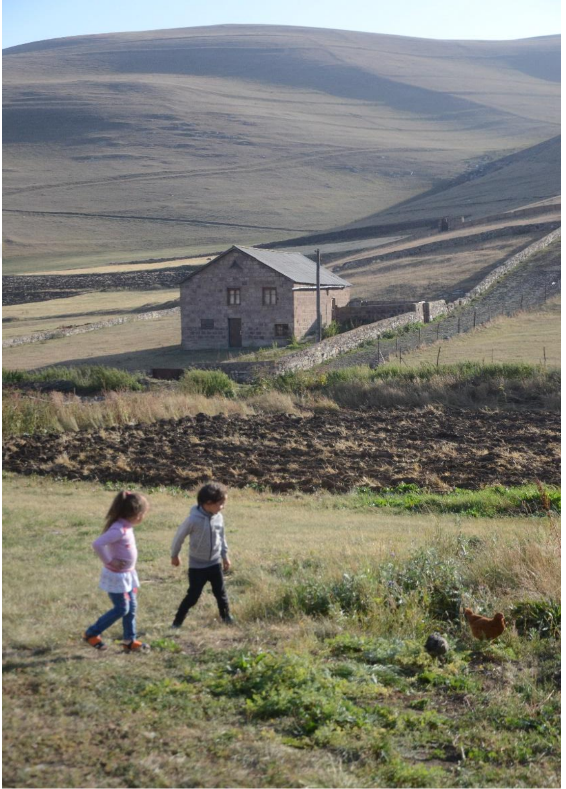
Wêneyê şeşem: Zaroyên mala Ûsiv li gund dilîzin-Gundê Pampê-Îlon-2017