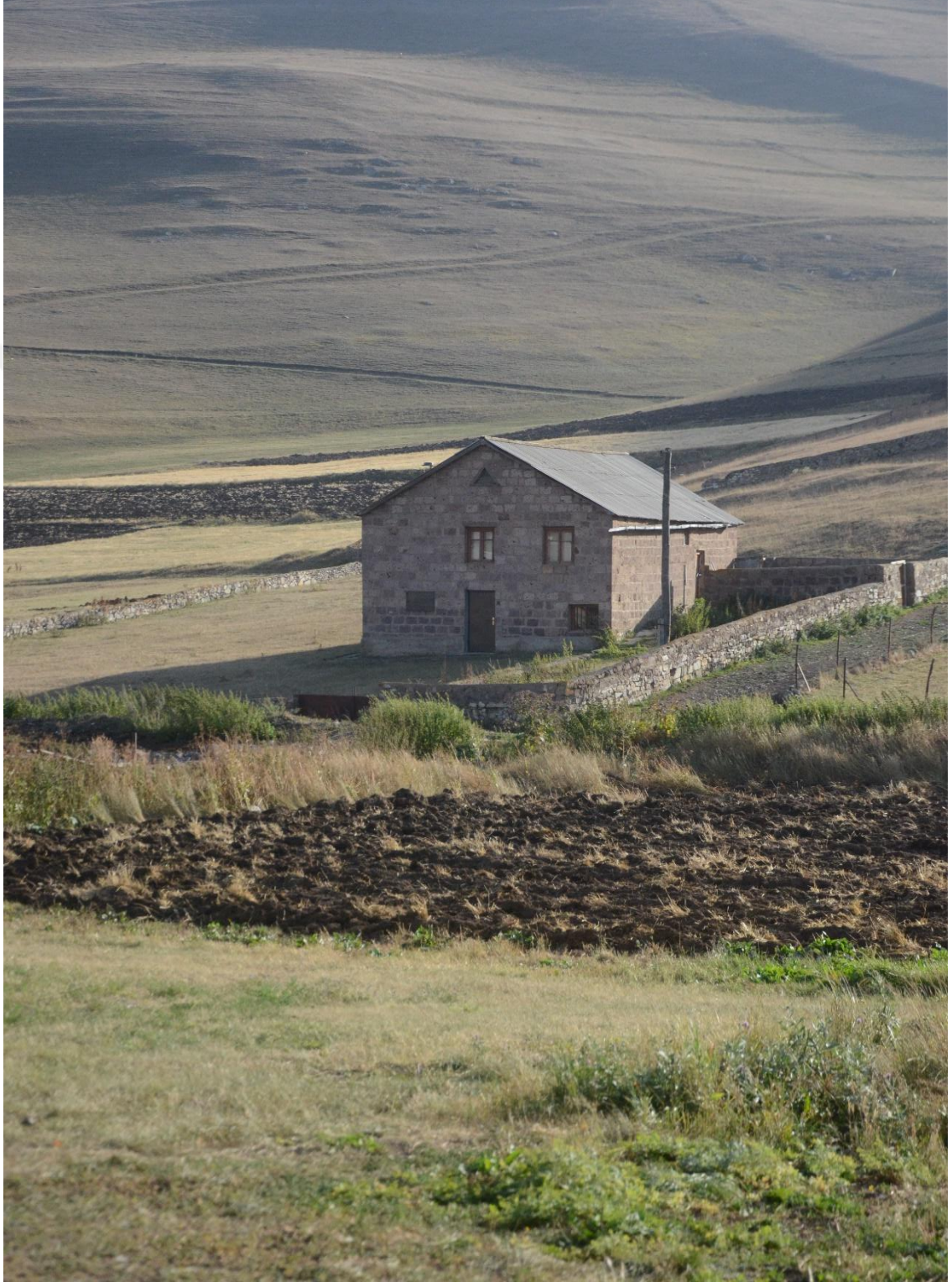
Wêneyê yekem: Mal-mûzeyaya Fêrîkê Ûsiv-Gundê Pampê (Navê niha: Sîpan) Rewan-Ermenistan-Îlon-2017