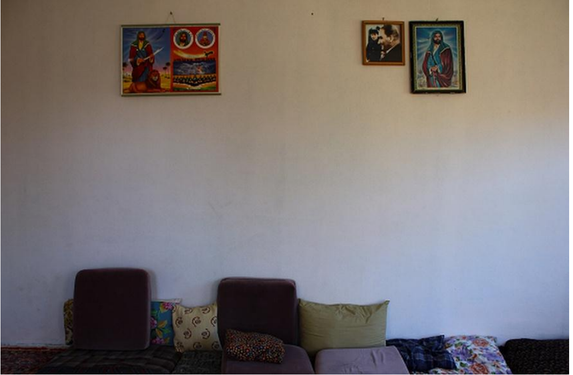
Resim 7: Köy Evleri (Gülşen AKGÜN AYAYDIN)