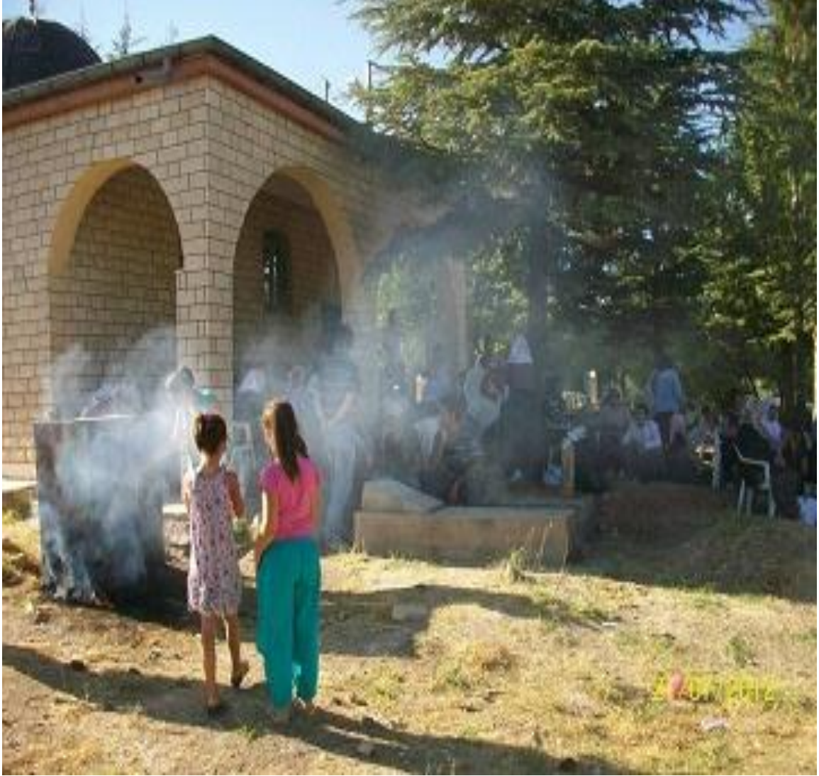
Resim 1: Koca Seyit Türbesi (Gülşen AKGÜN AYAYDIN )