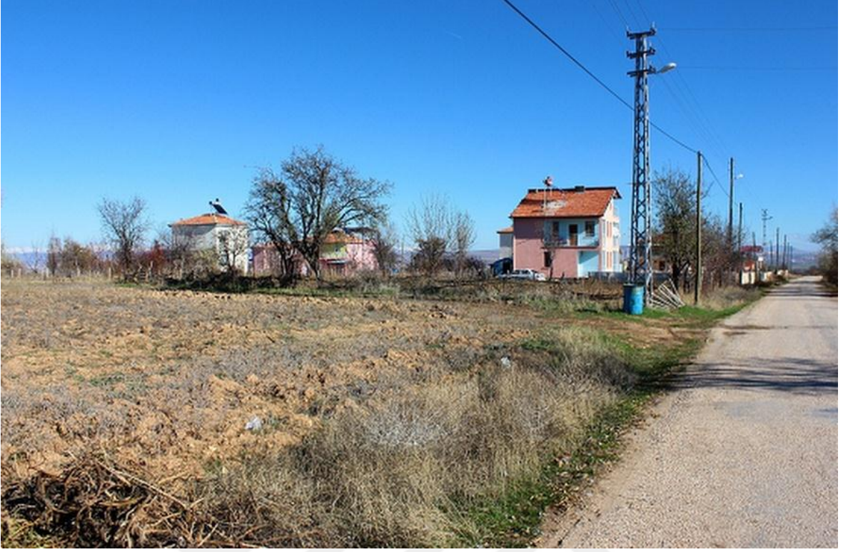
Resim 6: Köy Evleri (Gülşen AKGÜN AYAYDIN)