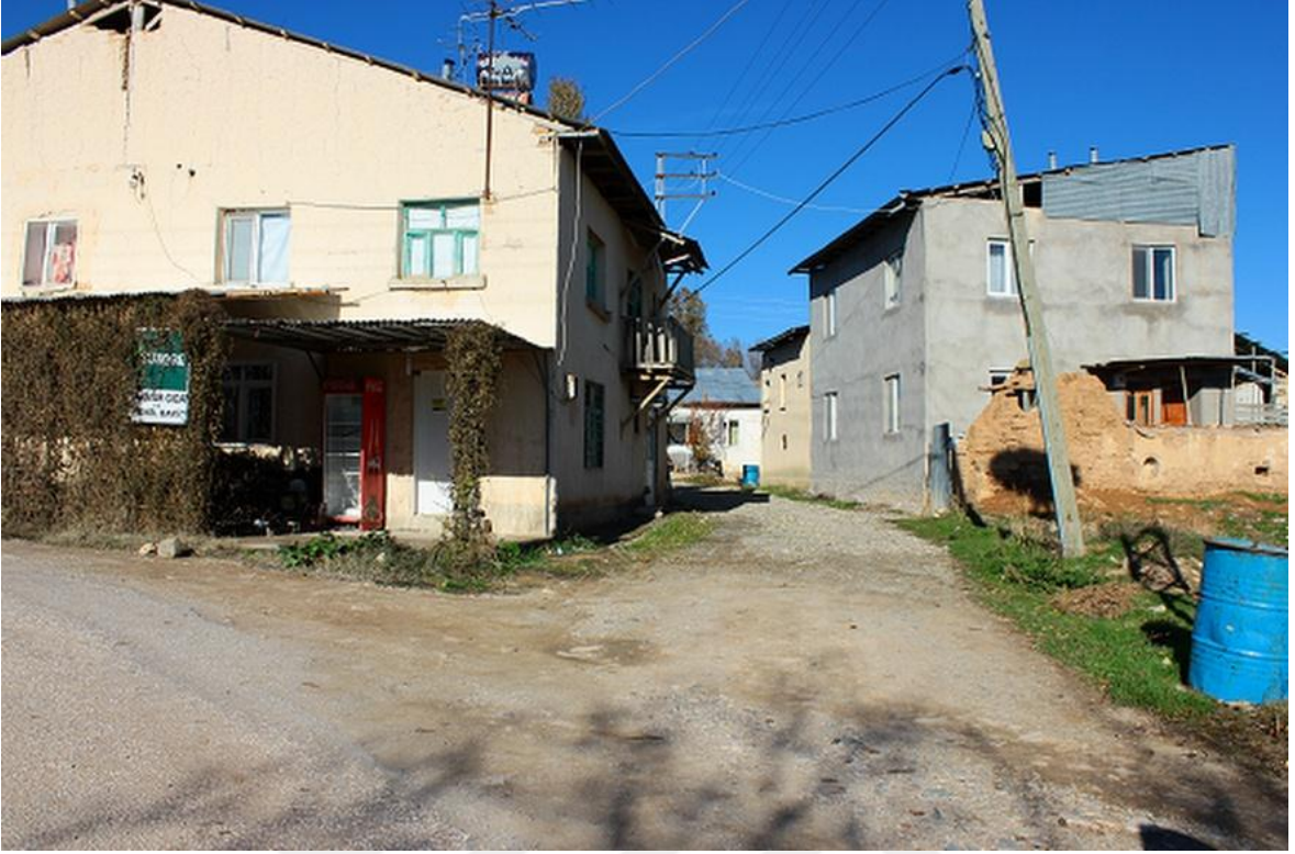
Resim 4: Köy Evleri (Gülşen AKGÜN AYAYDIN)