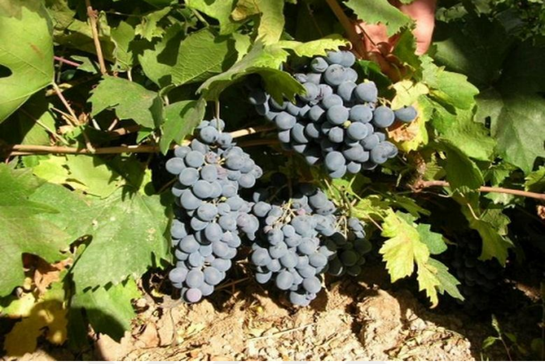
Resim 8: Üzüm Bağları (Gülşen AKGÜN AYAYDIN)