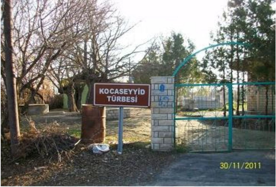
Resim 2: Koca Seyit Türbesi (Gülşen AKGÜN AYAYDIN)