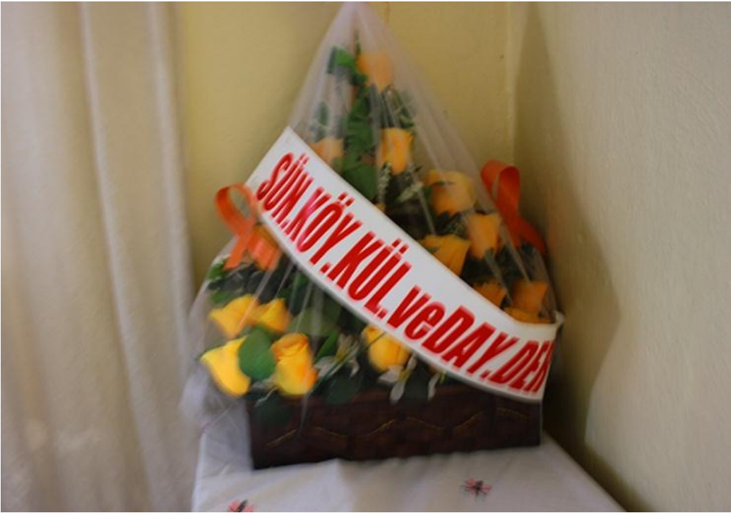
Resim 9: Köy Evleri (Gülşen AKGÜN AYAYDIN)