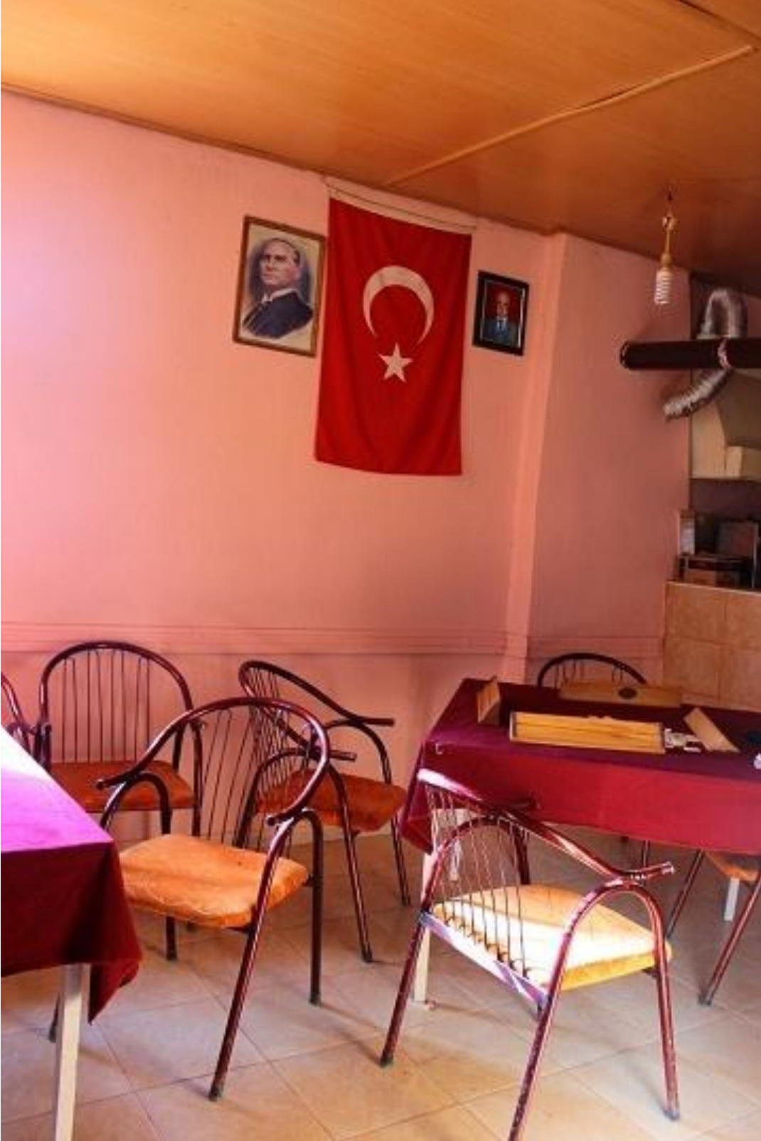
Resim 10: Köy Kahvesi (Gülşen AKGÜN AYAYDIN)