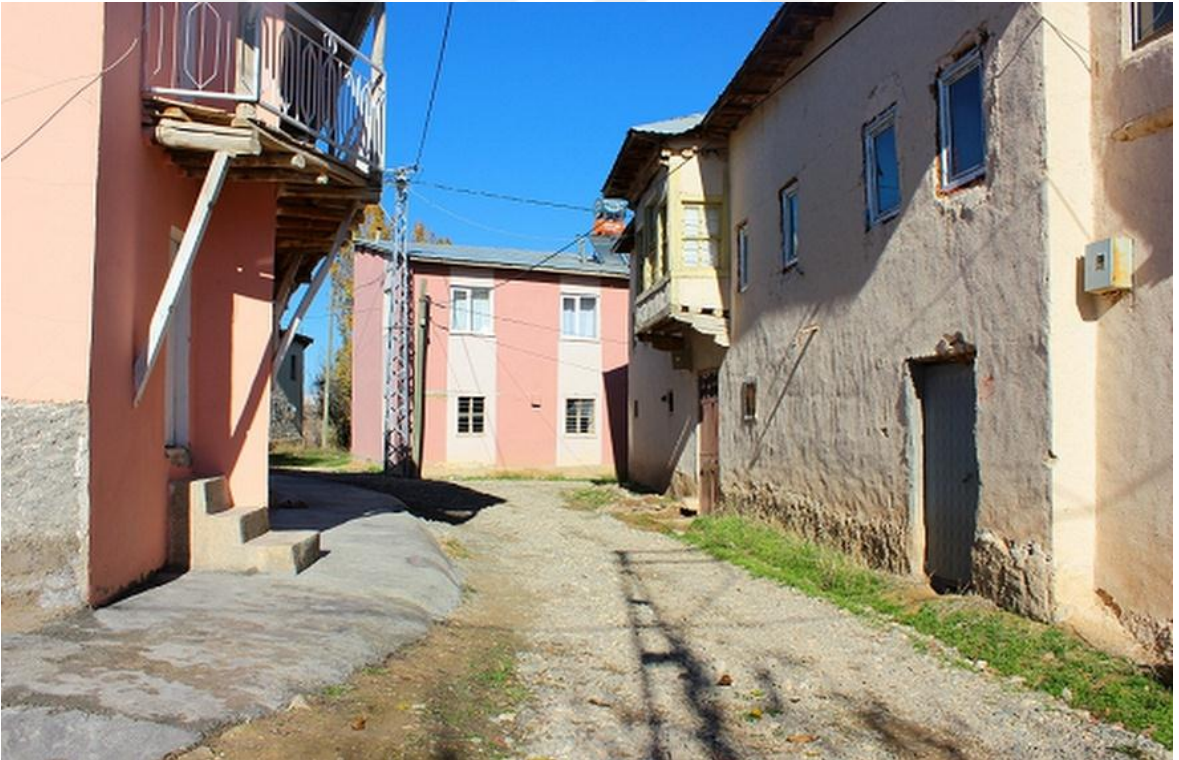
Resim 5: Köy Evleri (Gülşen AKGÜN AYAYDIN)