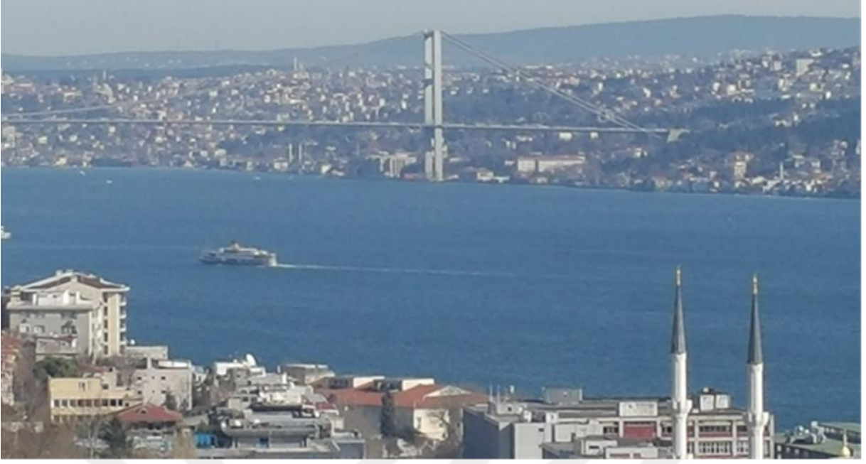
Resim 3: Galata Kulesinden Boğaziçi Köprüsünün görünümü.