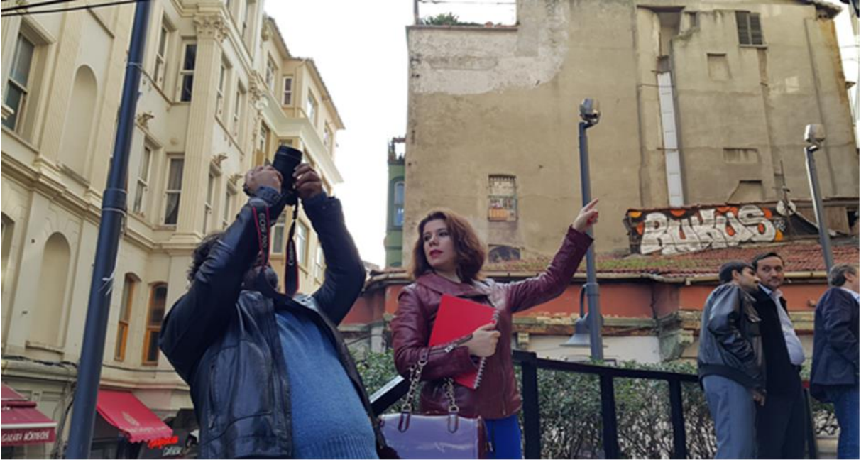
Resim 17: Galata Kulesi. CANON 70D profesyonel fotoğraf makinesi ile çekilmiştir.