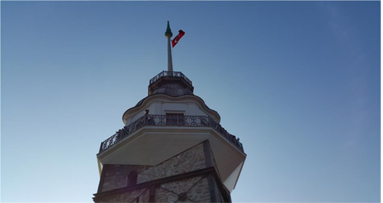
Resim 9: Bir başka açıdan Kız Kulesi.