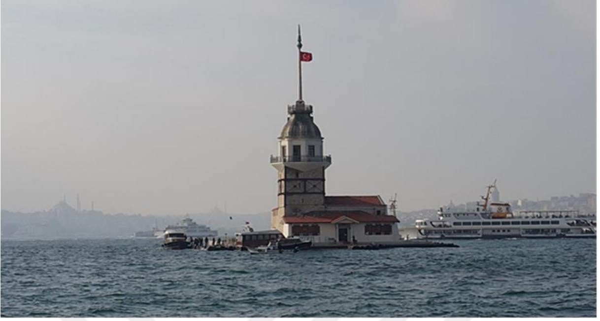
Resim 8: Üsküdar Salacak' dan Kız Kulesi'nin görünümü.