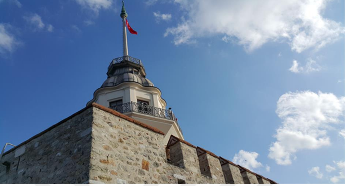
Resim 10: Salacak Kız Kulesi'nin arkadan görünümü.