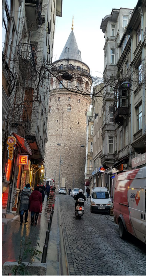
Resim 5: Galata Kulesi.