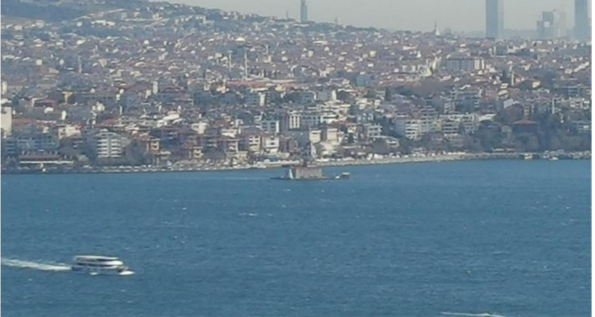
Resim 2: Galata Kulesinden Kız Kulesinin görünümü.