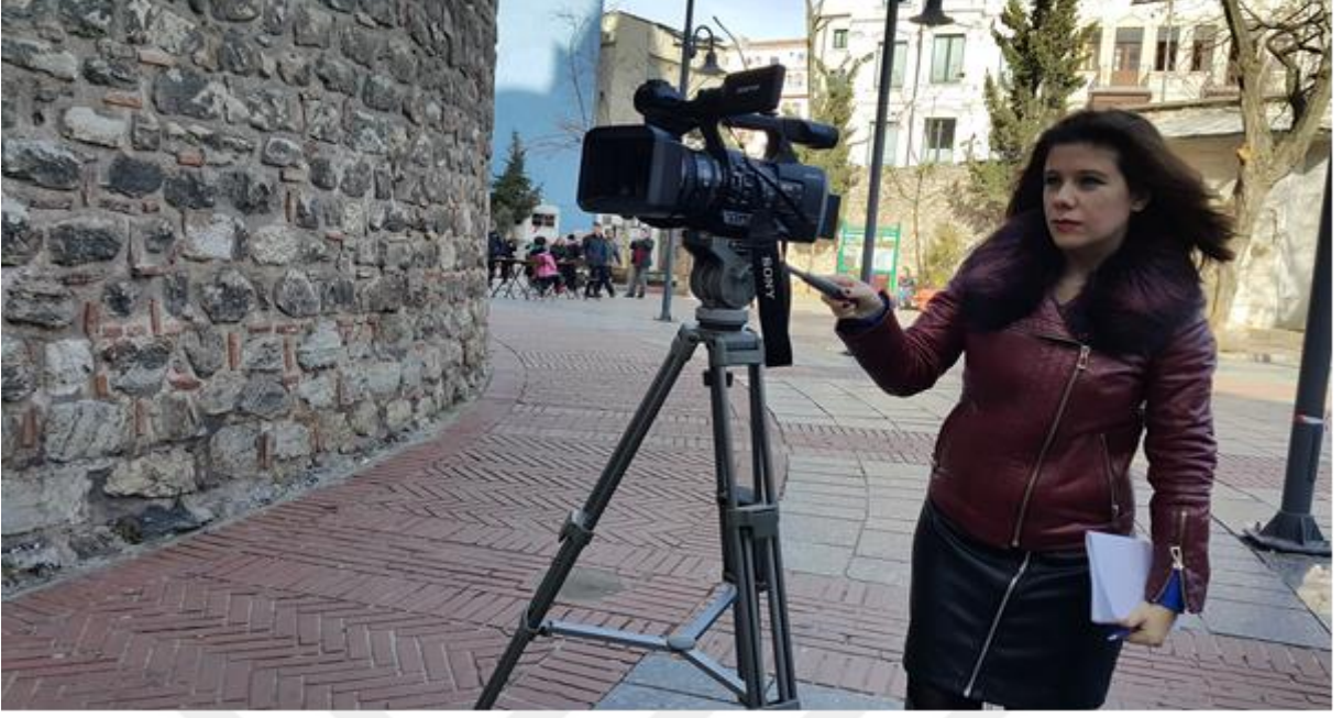
Resim 16: Galata Kulesi. SONY TXW X160 (X180) 2015 profesyonel kamera ile çekilmiştir.