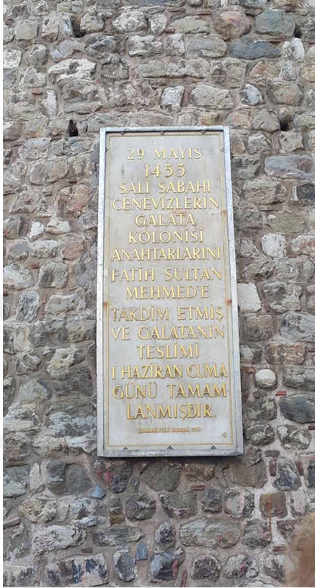
Resim 4: Galata Kulesi.