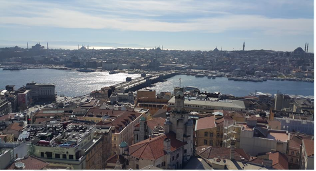
Resim 1: Galata Kulesi'nin balkon kısmından gerçekleştirilmiştir.