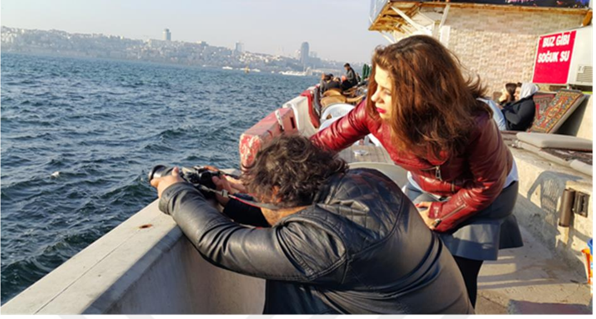
Resim 18: Salacak Kız Kulesi. CANON 70D profesyonel fotoğraf makinesi ile çekilmiştir.