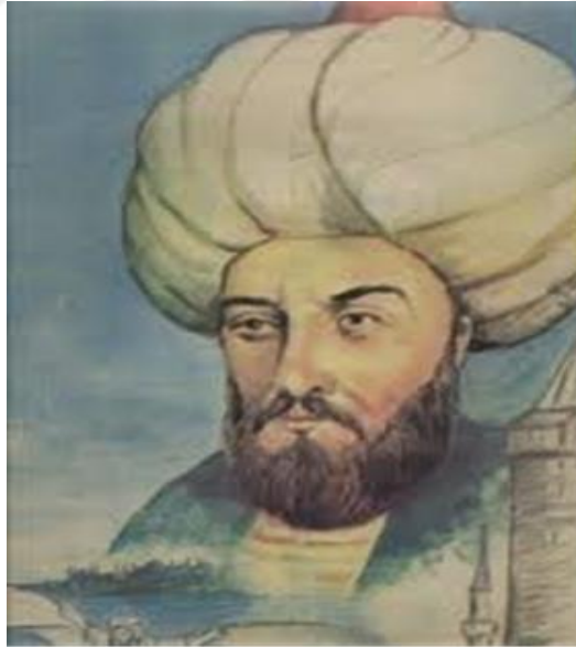
Resim 7: Hezarfen Ahmet elebi (temsili)