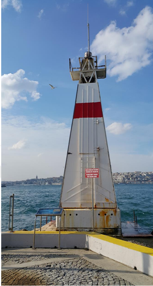
Resim 11: Kız Kulesi'nin arka tarafında bulunan Deniz Feneri.