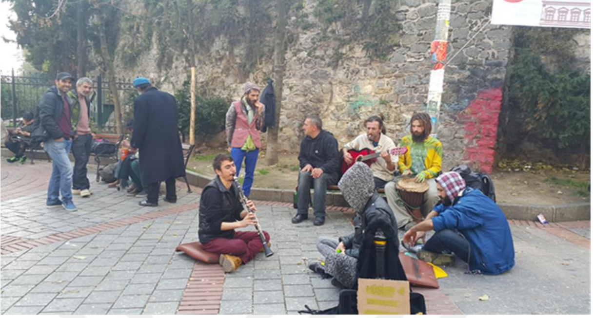
Resim 6: Galata Kulesinin etrafını çepeçevre saran sokak algıcıları; gnn her saatinde insanları eęlendirmekten mutluluk duyuyor.