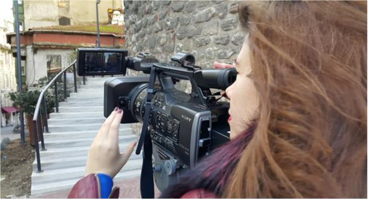
Resim 15: Galata Kulesi. SONY TXW X160 (X180) 2015 profesyonel kamera ile çekilmiştir.