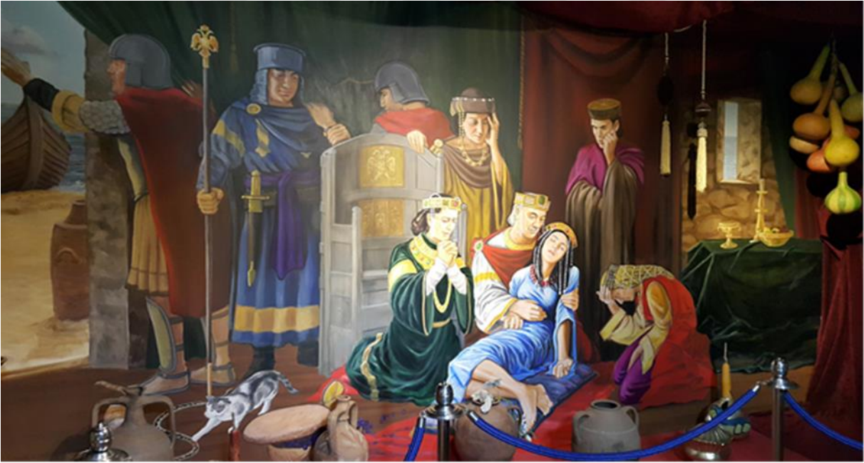
Resim 13: Kuleye gönderilen üzüm sepetiyle kuleye gelip prensesi sokan yılanın yarattığı trajediyi canlandıran bu resim Kız Kulesi'nin içinde yer almaktadır.