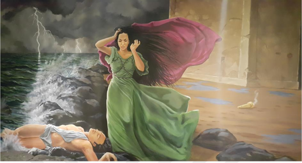
Resim 12: Hero ile Leanders'in hüznü aşkını anlatan bu resim Kız Kulesi'nin içinde yer almaktadır.