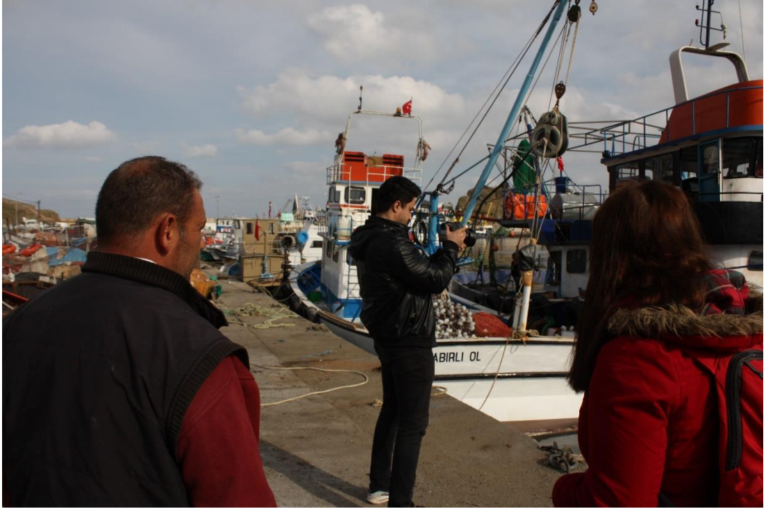
14 Kasım 2015 – Kamera arkası görüntü