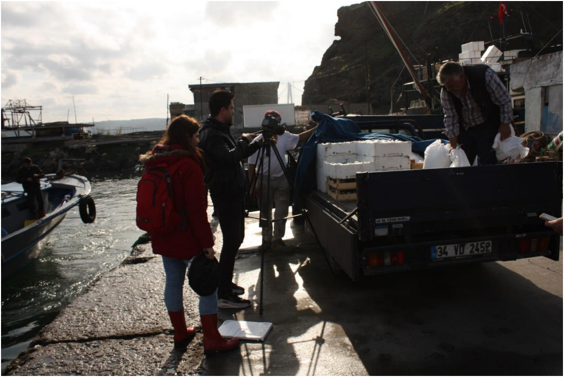
14 Kasım 2015 – Kamera arkası görüntü