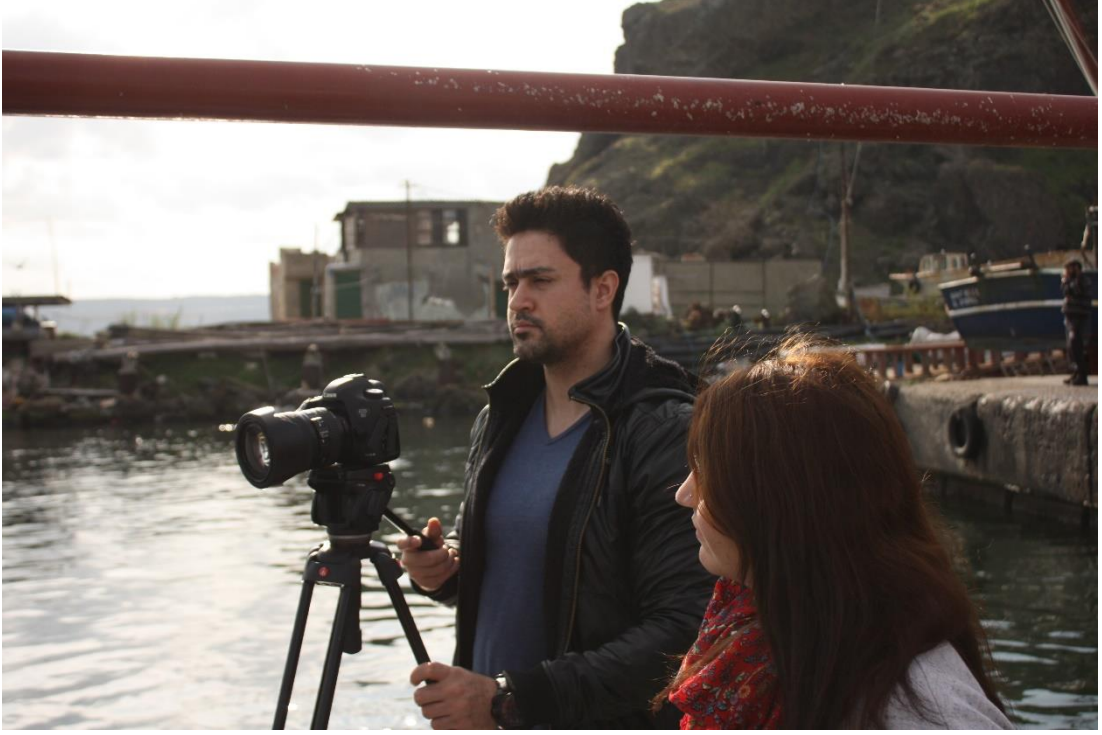
15 Kasım 2015 – Kamera arkası görüntü