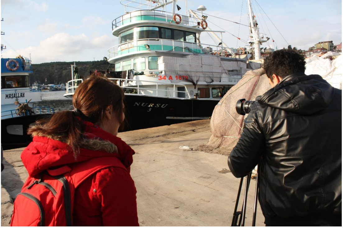
14 Kasım 2015 – Kamera arkası görüntü