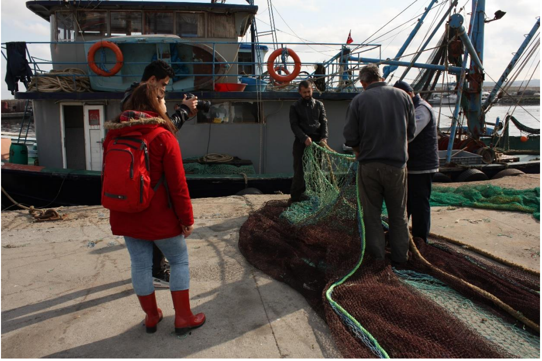
14 Kasım 2015 – Kamera arkası görüntü