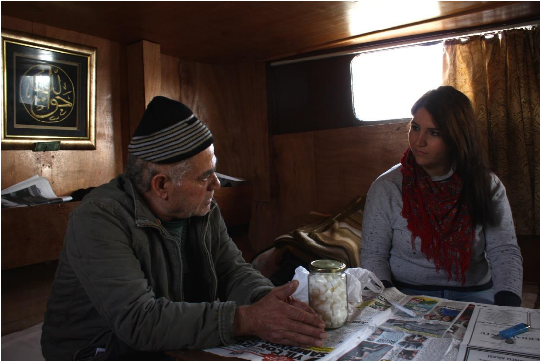
15 Kasım 2015 – Kamera arkası görüntü