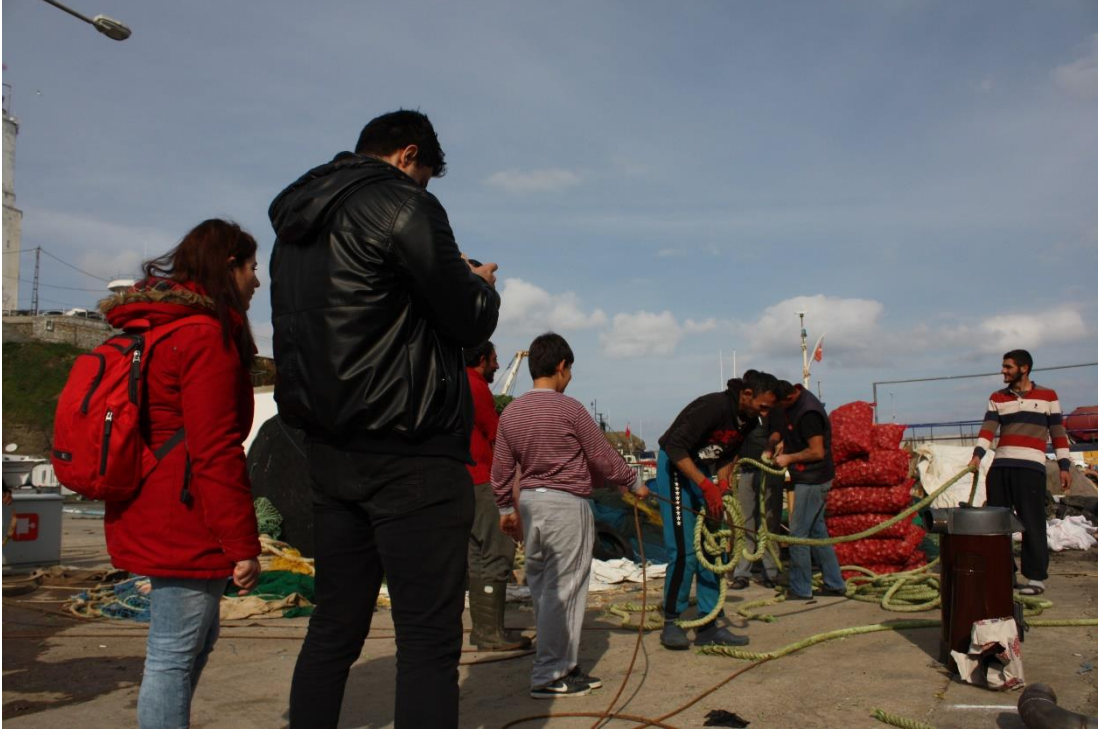
14 Kasım 2015 – Kamera arkası görüntü