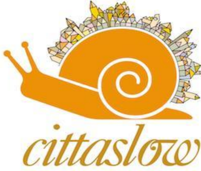
Şekil 2. Salyangoz figürü üzerine inşa edilen resmi Cittaslow logosu

Kaynak: M. H. Ergüven, Cittaslow – Yaşamaya Değer Şehirlerin Uluslararası Birliği: Vize Örneği, Organizasyon Ve Yönetim Bilimleri Dergisi. 1