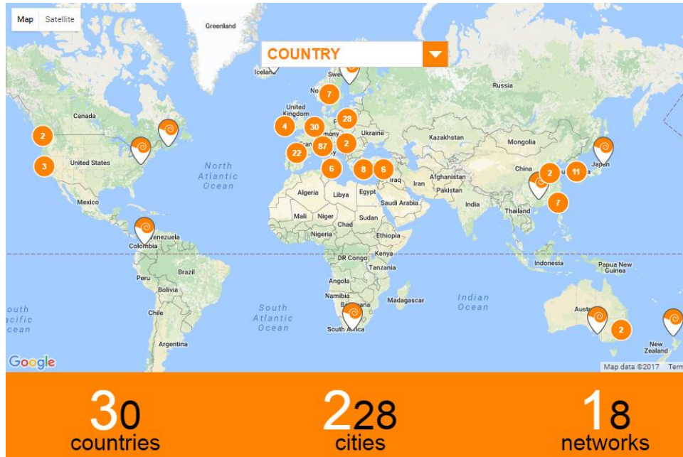
Şekil 1. Cittaslow Network Ağ Haritası