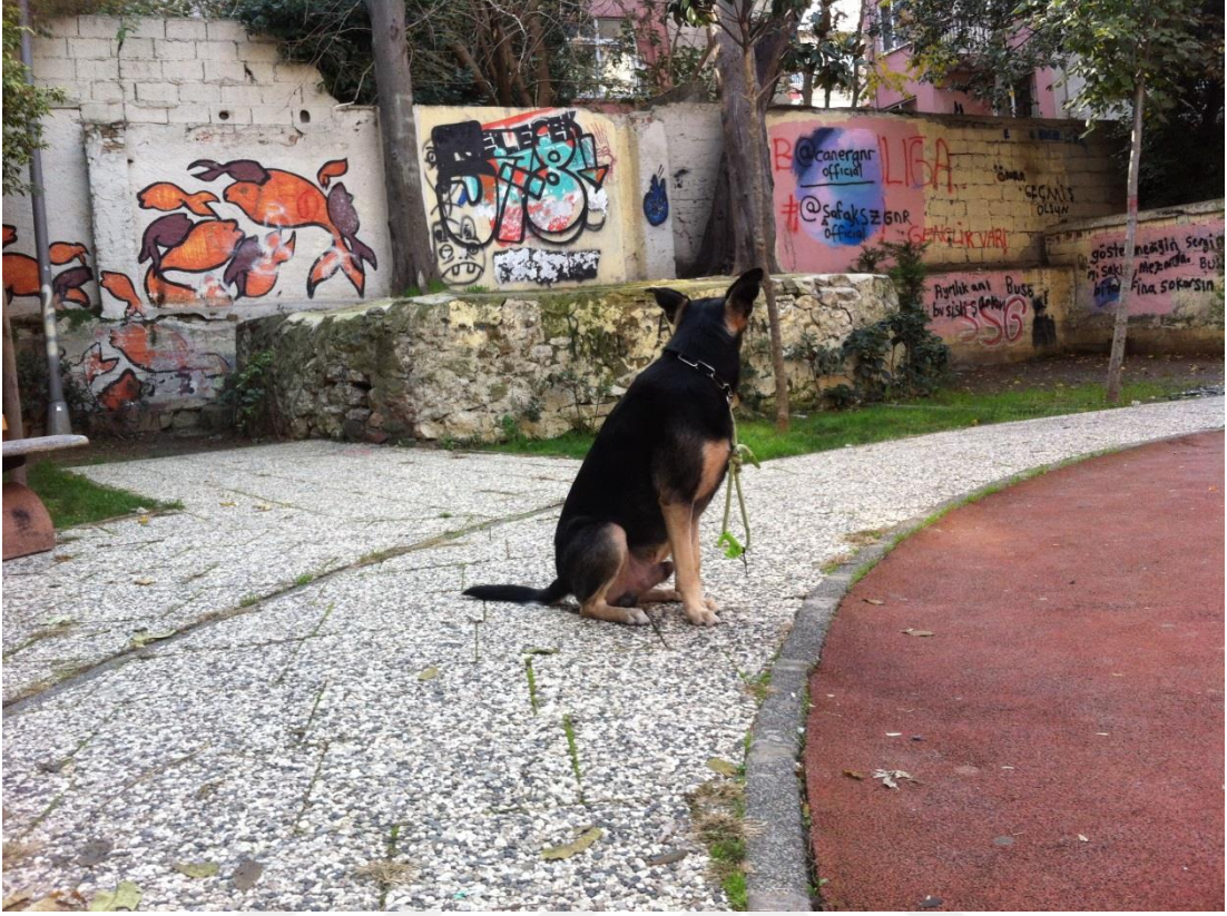
Fotoğraf V: Köpek ve mekân bir arada görülsün diye hazırlık çalışması...