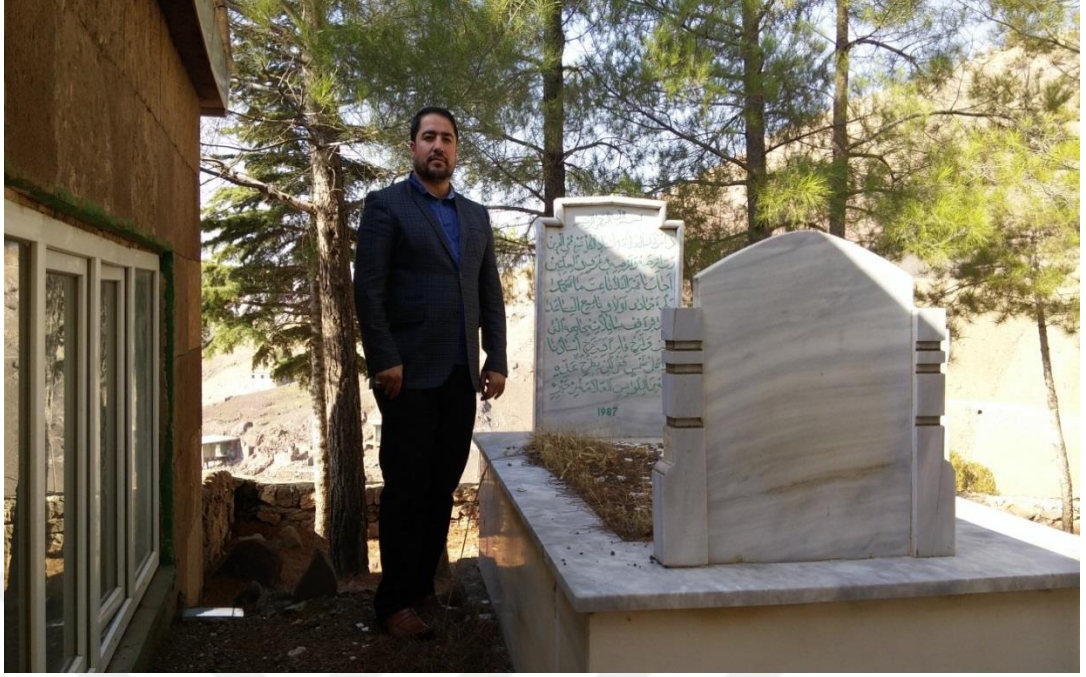
RESİM:4 Mezarımı ziyaret