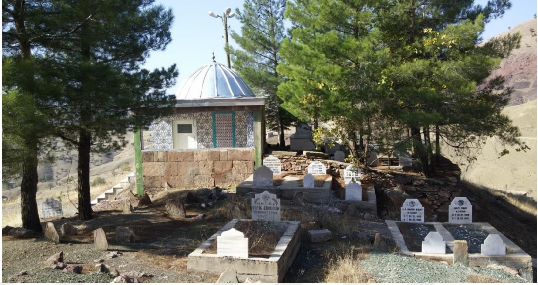
RESİM: 2 268 Yeşilçevre’de bulunan küçük köy kabristanıdır.