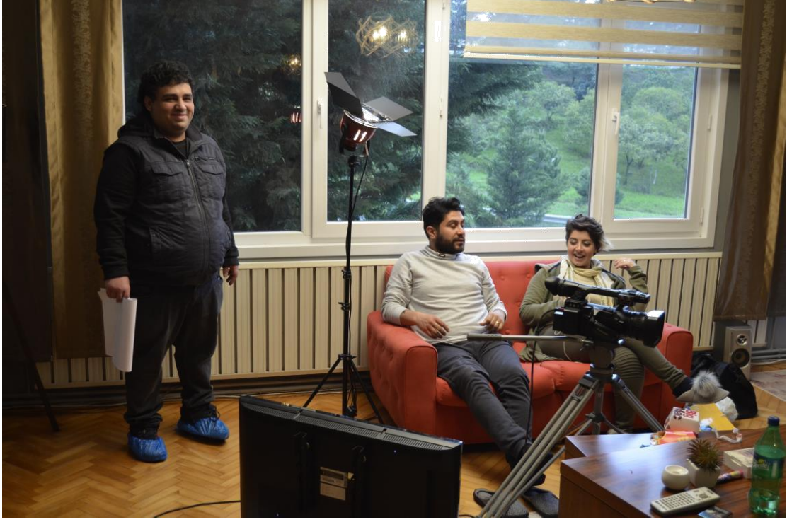
Resim 9: Yönetmen, yardımcı yönetmenlerle birlikte...