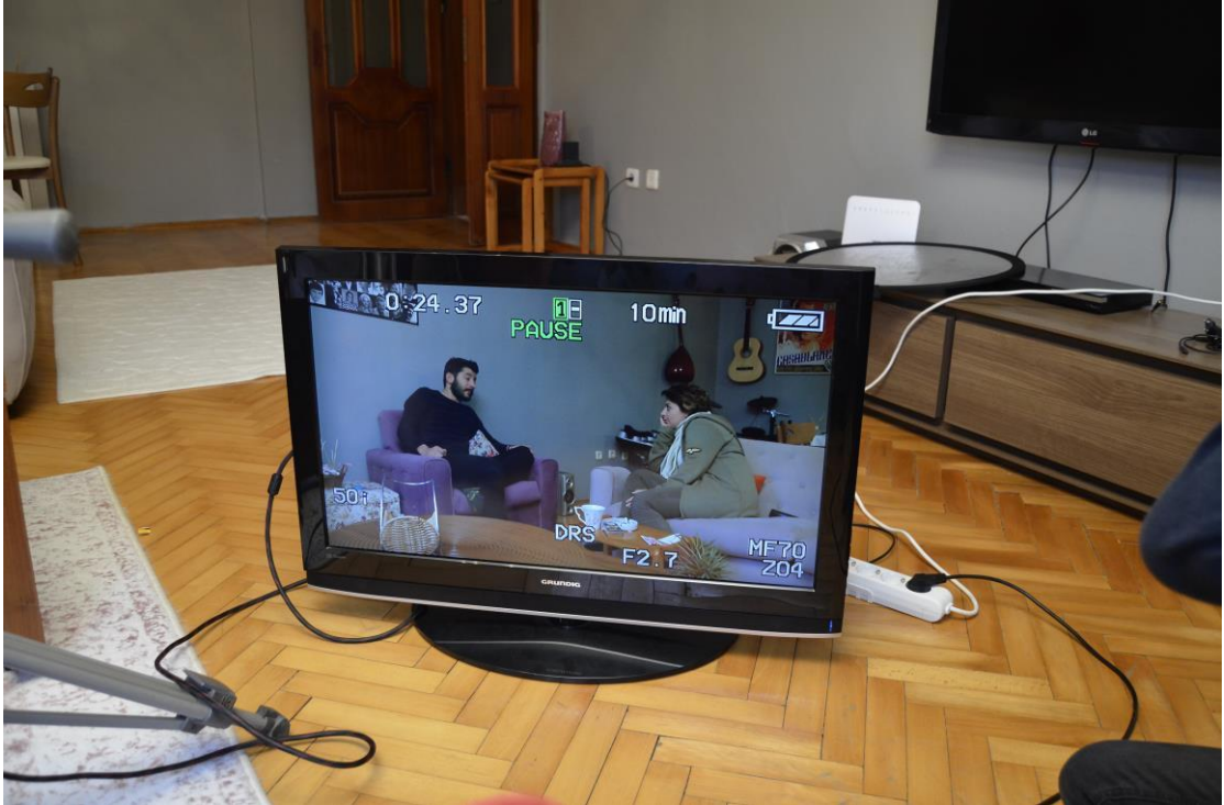
Resim 6: Kerim ile Aslı'nın konuşmaları öncesi, sette hazırlık aşaması