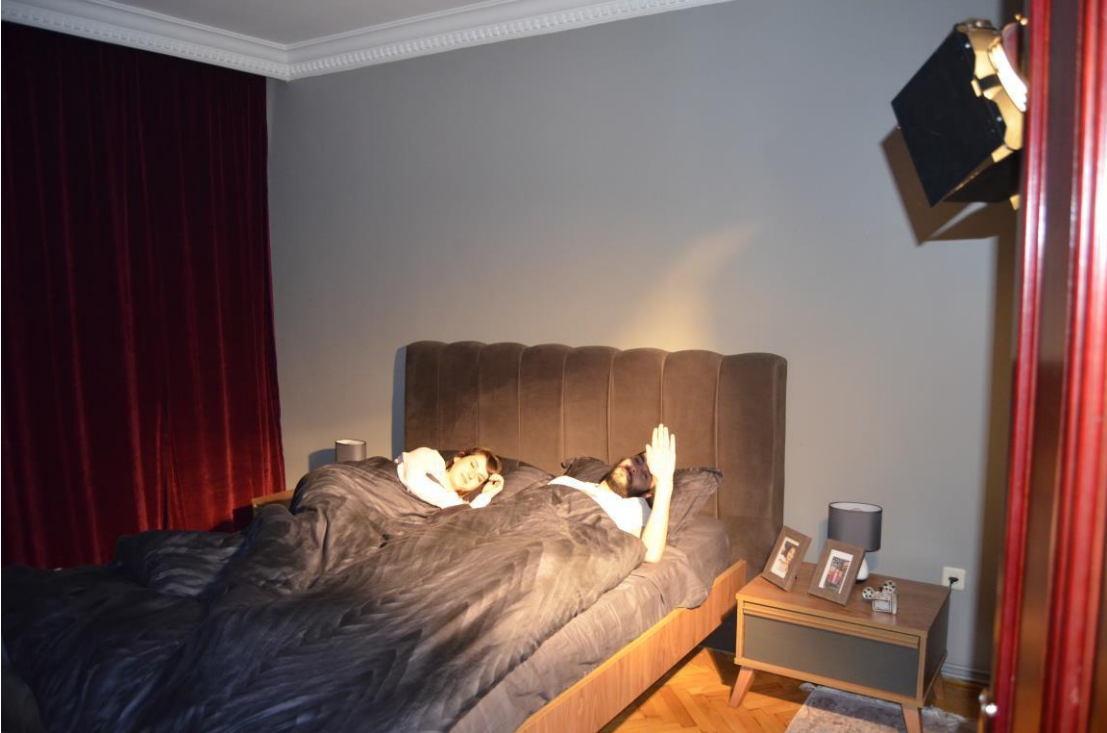
Resim 4: Kerim ile Aslı'nın birlikte uyuduğu diğer set fotoğrafı