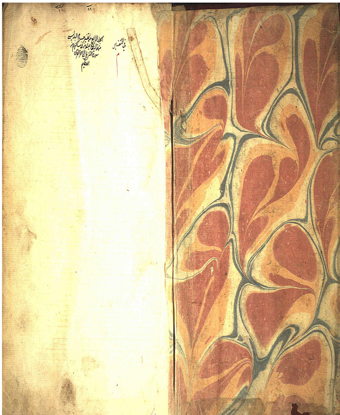
نسخة الأصل صفحة الغلاف للمجلد الرابع