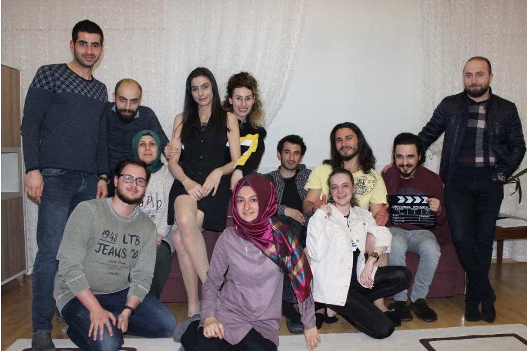
Fotoğraf 5-6 Set Ekibimle 1.Gün Öğlen Yemeği Yerken Ve 2. Gün Çekimleri Bitirdiğimiz Anı Gösteren Fotoğraflar.