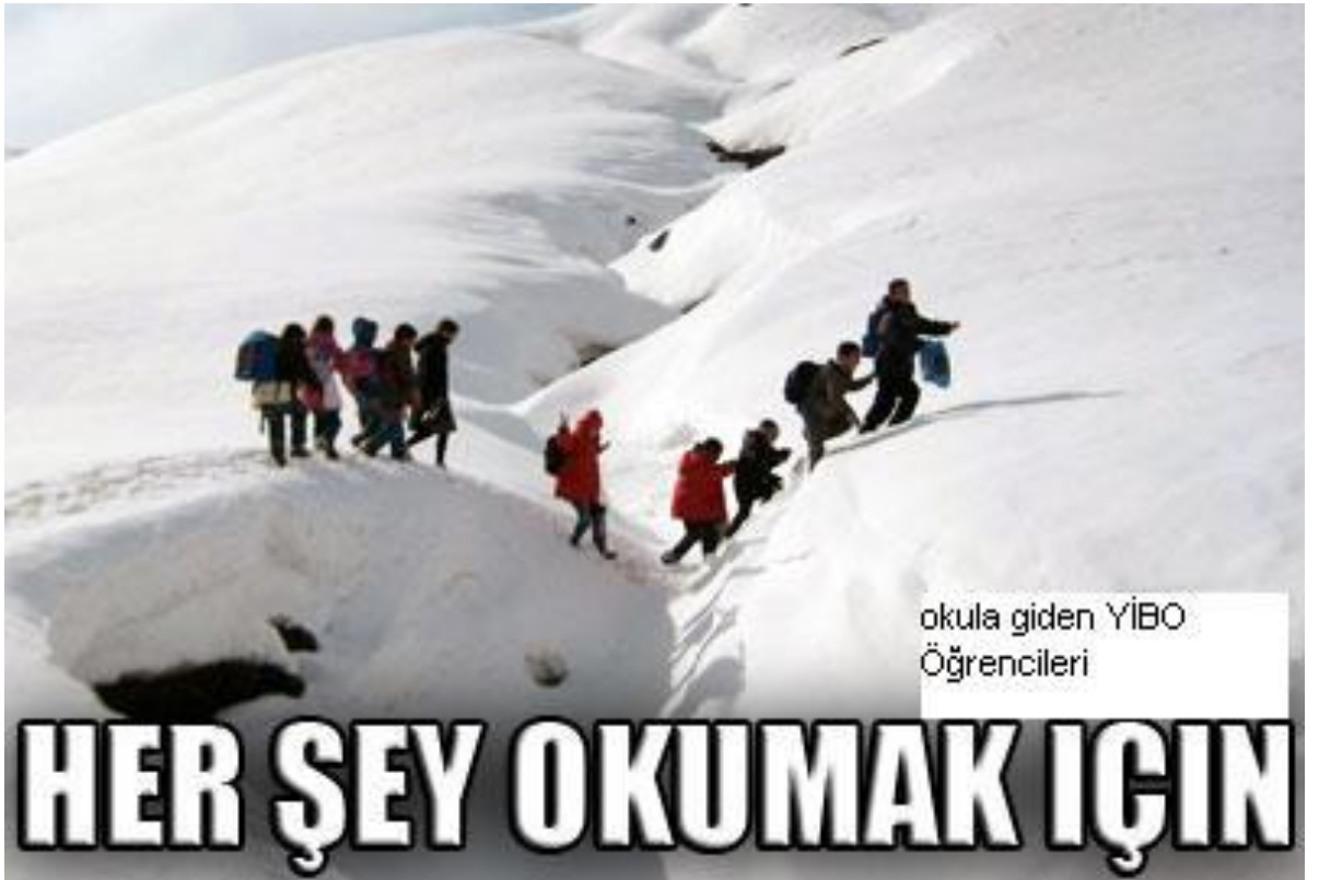
okula giden YİBO Öğrencileri