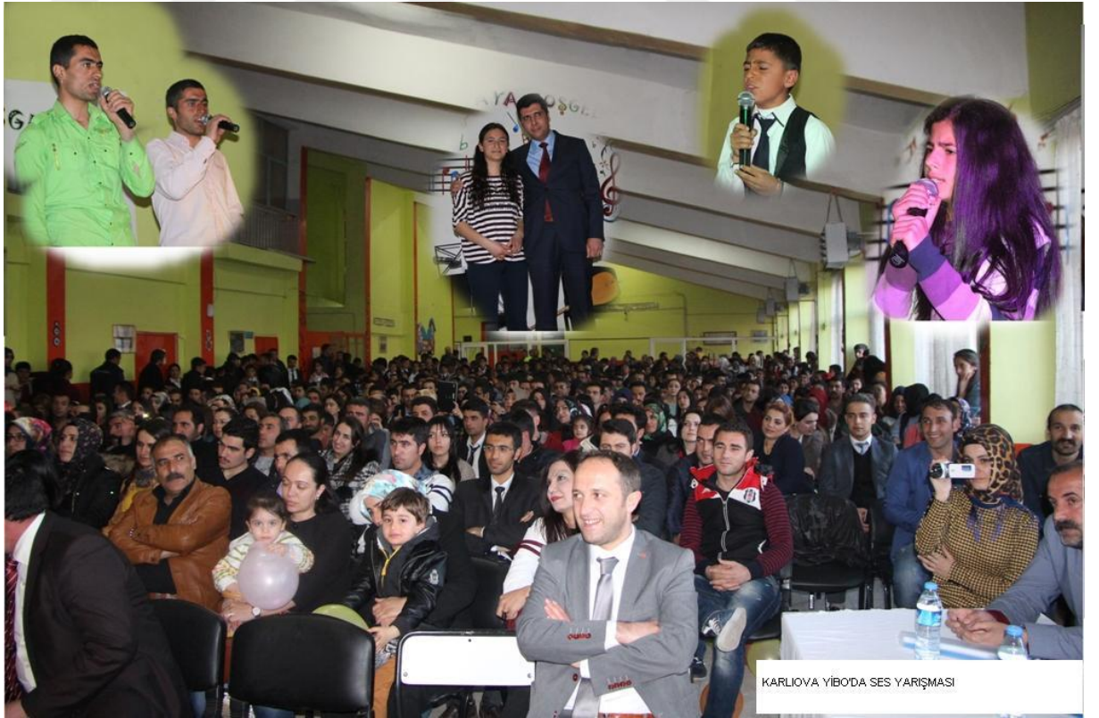
KARLIOVA YİBODA SES YARIŞMASI