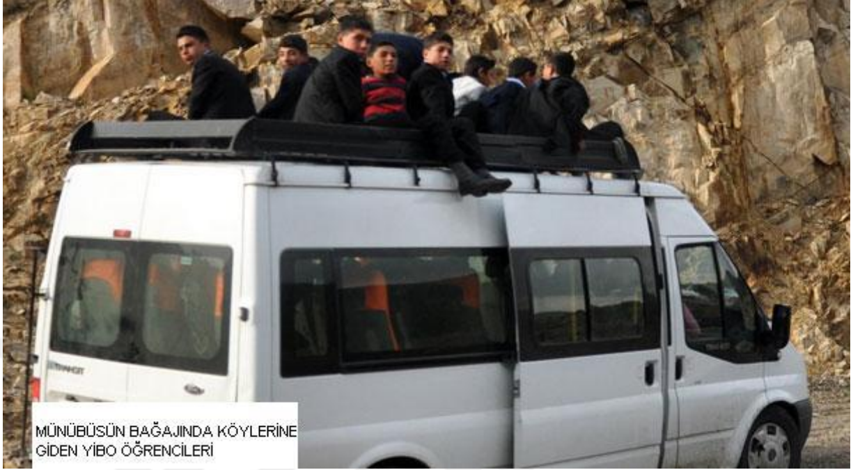
MÜNÜBÜSÜN BAĞAJINDA KÖYLERİNE GİDEN YİBO ÖĞRENCİLERİ