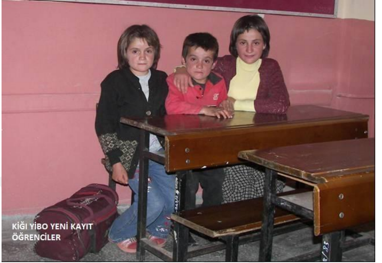
KİĞİ YİBO YENİ KAYIT ÖĞRENCİLER