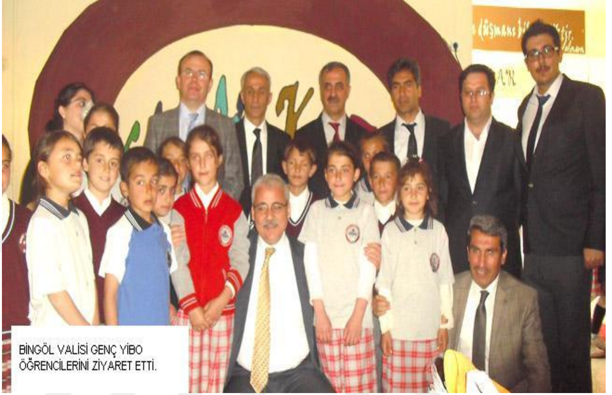
BİNGÖL VALİSİ GENÇ YİBO ÖĞRENCİLERİNİ ZİYARET ETTİ.