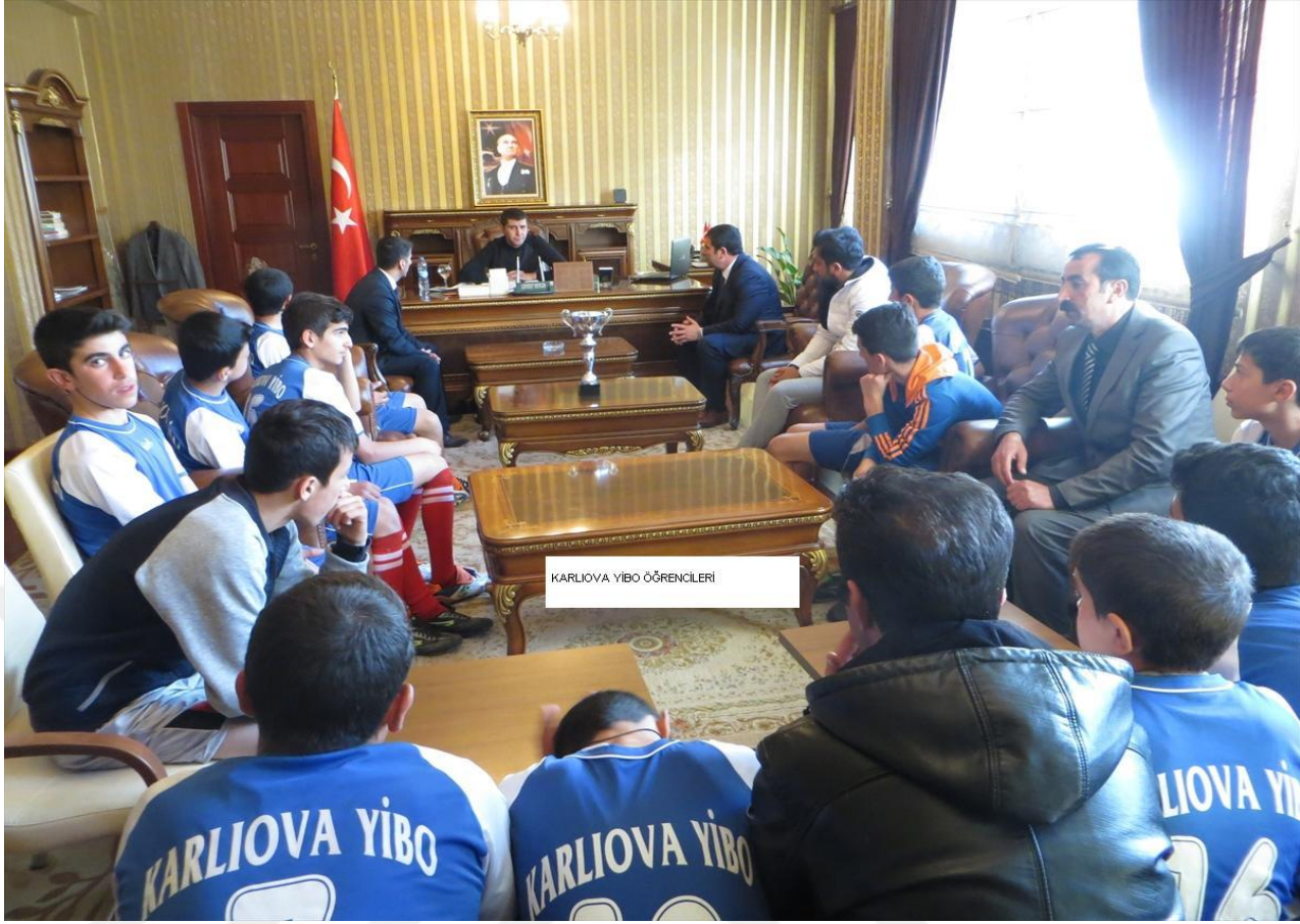
KARLIOVA YİBO ÖĞRENCİLERİ