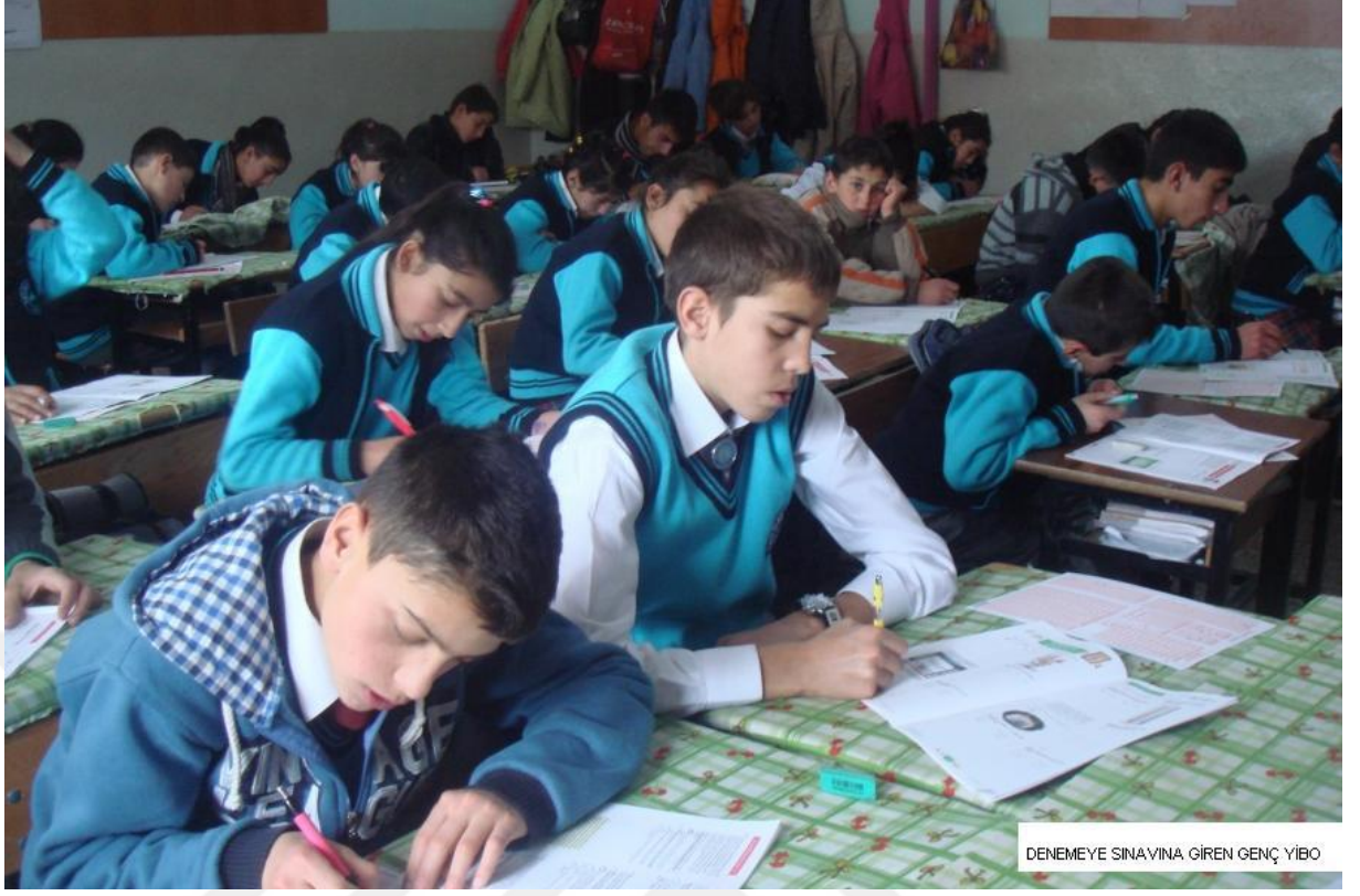
DENEMEYE SINAVINA GİREN GENÇ YİBO