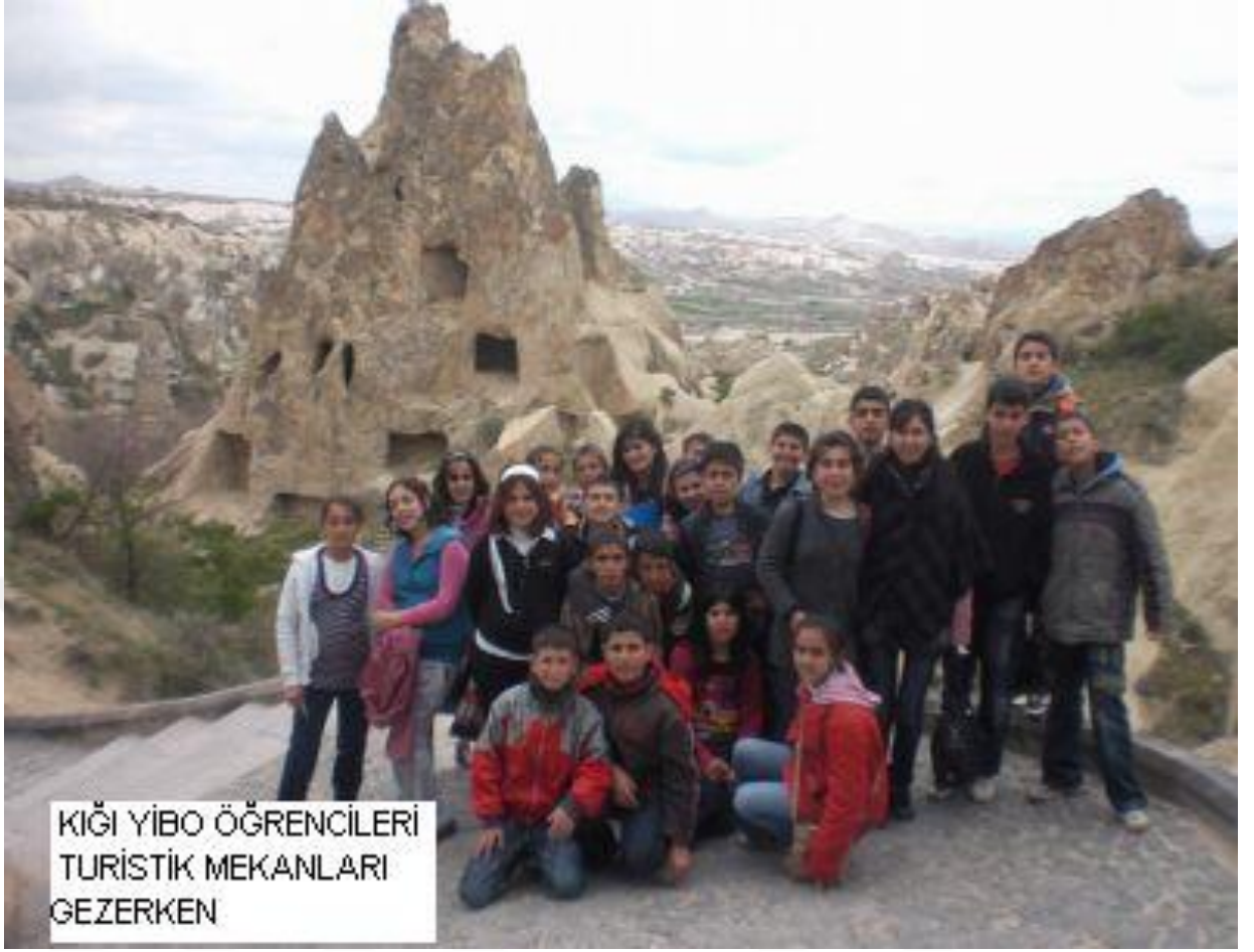
KIĞI YİBO ÖĞRENCİLERİ TURİSTİK MEKANLARI GEZERKEN