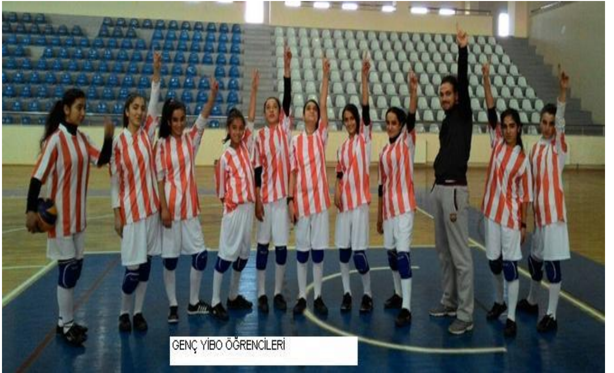
GENÇ YİBO ÖĞRENCİLERİ