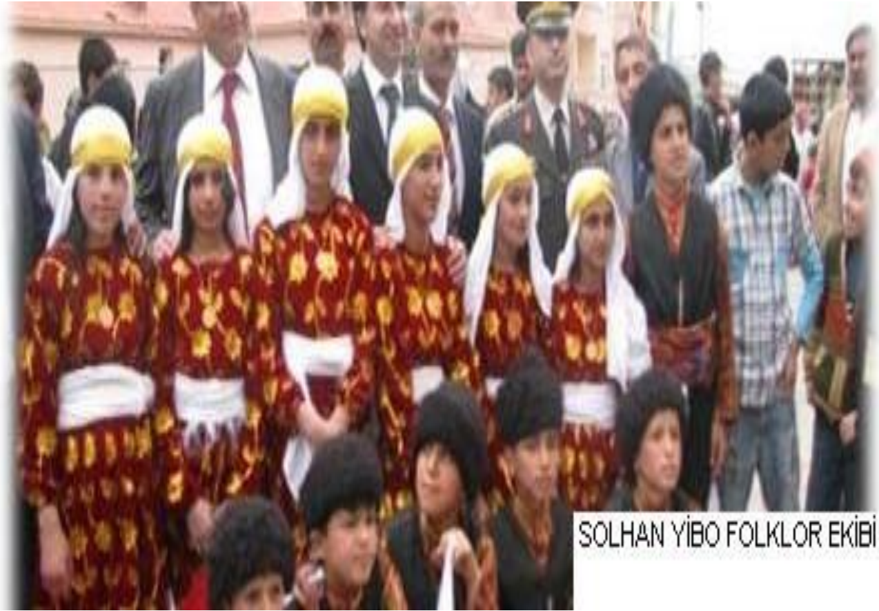
SOLHAN YİBO FOLKLOR EKİBİ