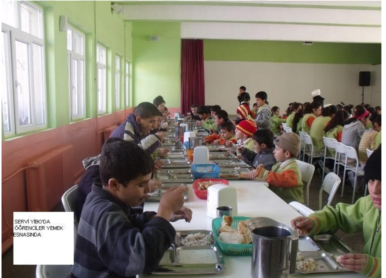
SERVİ YIBO'DA ÖĞRENCİLER YEMEK ESNASINDA.