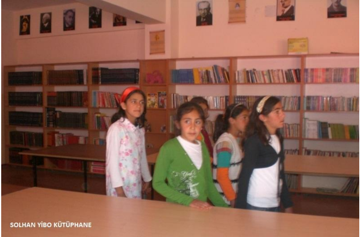
SOLHAN YİBO KÜTÜPHANE