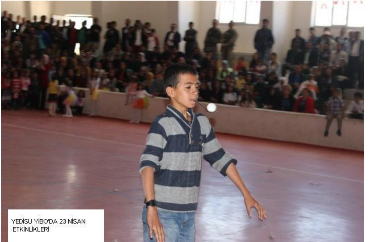
YEDİSU YİBO'DA 23 NİSAN ETKİNLİKLERİ