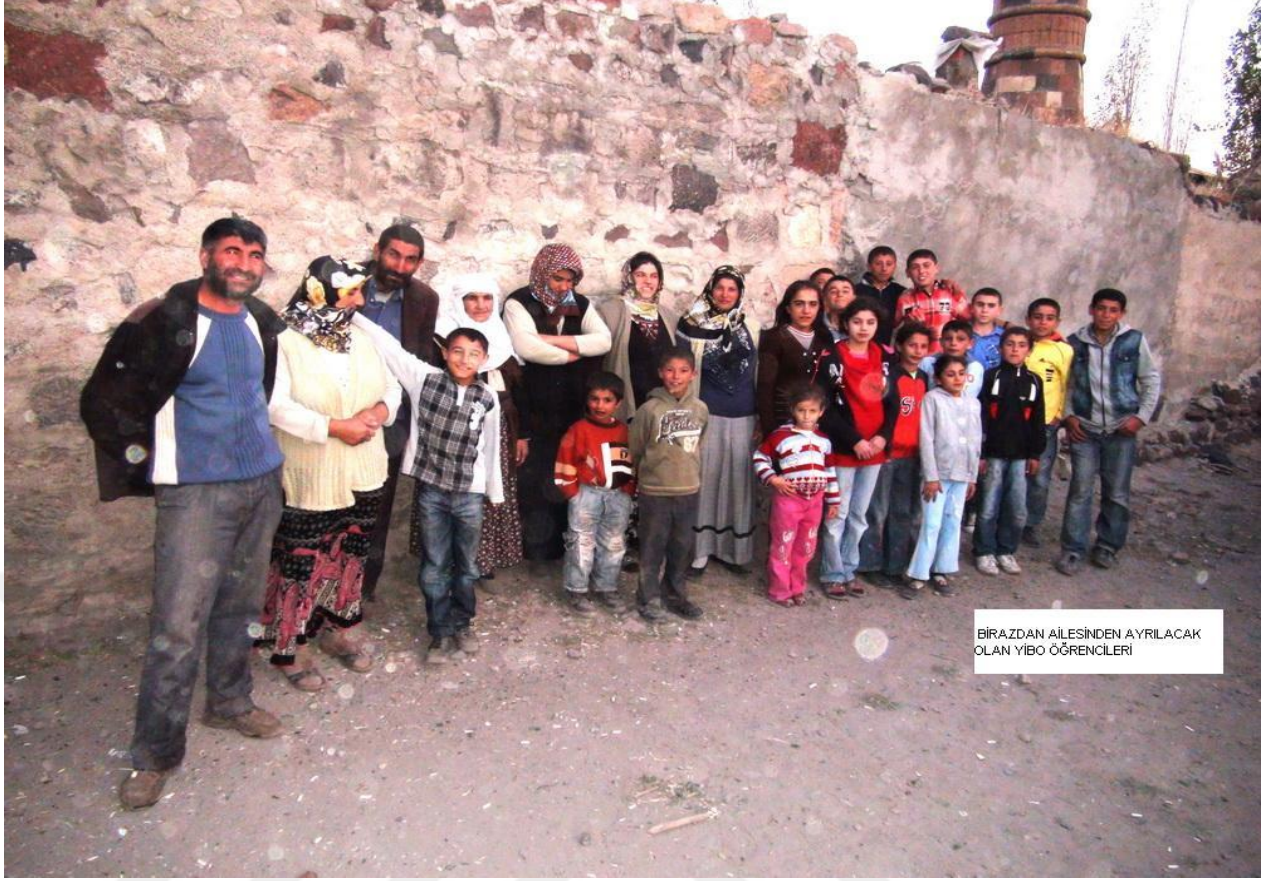
BIRAZDAN AİLESİNDEN AYRILACAK OLAN YİBO ÖĞRENCİLERİ