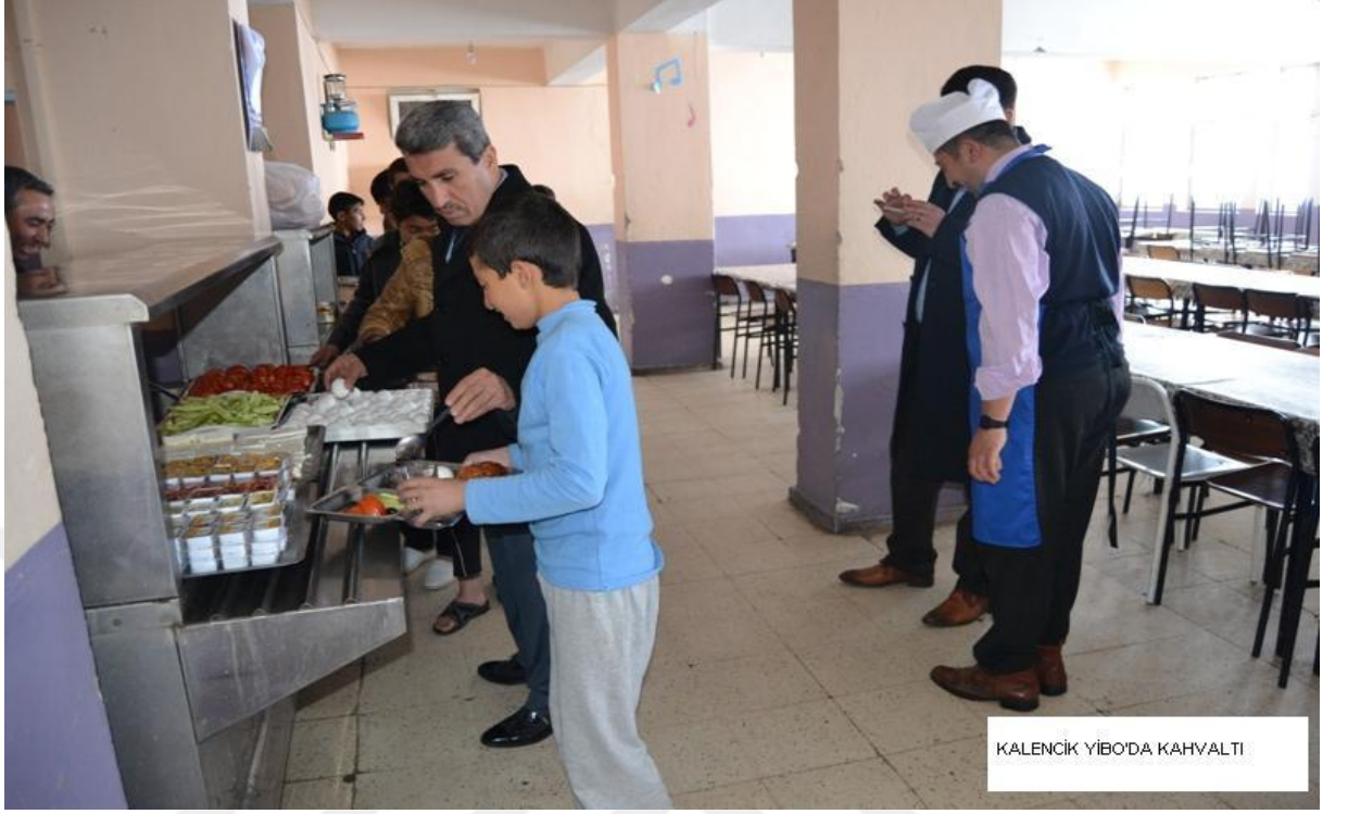
KALENCİK YIBO'DA KAHVALTI