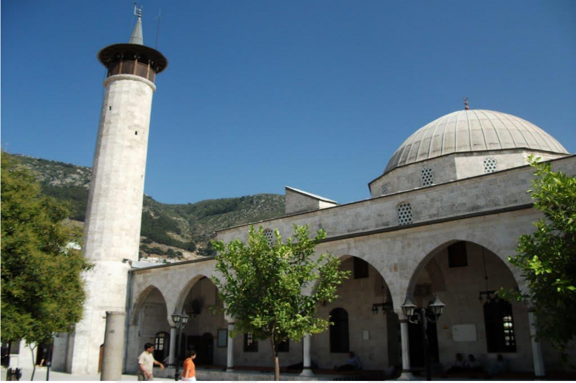
Resim 1: Habib-i Neccar Camii 100

Bizans'ın 968 yılında Antakya'yı ele geçirmesi ile birlikte Habib-i Neccar Camii kiliseye çevrilmiştir. 1084 yılında Selçuklu ordularının Kutalmışoğlu Süleyman Şah komutasında Antakya'yı almalarından sonra tekrar camiye çevrilmiştir. Haçlı orduları 1098 yılında Antakya'ya ulaştıklarında camii bir kez daha kiliseye olacaktır. 170 yıl kadar kilise olarak kullanıldıktan sonra 1268 yılında Memlûklularının Antakya'ya gelmesi ile birlikte Memlûk Sultanı Baybars, Habib Neccar Camisini yeniden inşa ettirmiştir.