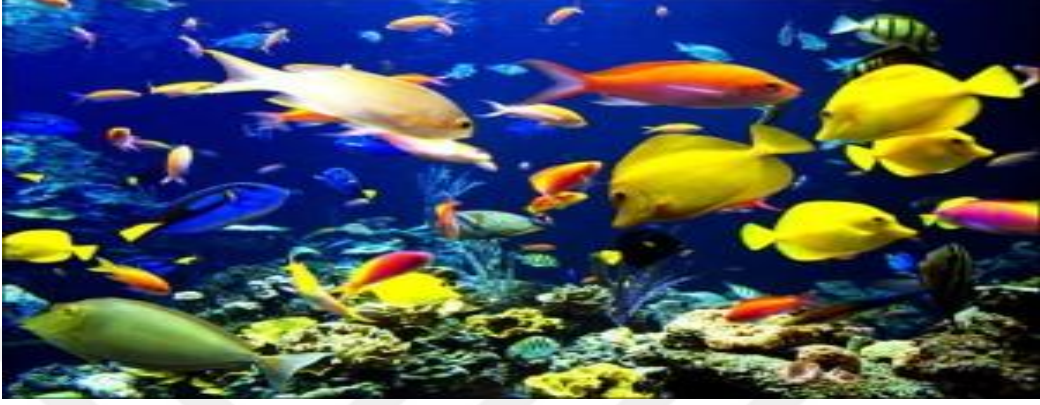
Şekil 10.3.2. Denizlerdeki canlılardan bir görüntü

denizde bulunan bütün canlılar balık olarak adlandırılmaktadır. Bu görüşe göre sadece suda yaşayabilen bütün canlılar helal sayılmaktadır. Bazı âlimler ise balıkların dışında kalan diğer canlıların helal olmadığı görüşündedirler. 113 Balıkların kesilmesine de gerek yoktur. Hatta balık kesilirse mekruh olur. Ancak büyük olur ve epeyce canlı kalırsa, o zaman kuyruk tarafından kesilmesi sünnettir. 114 (Şekil 10.3.2.)