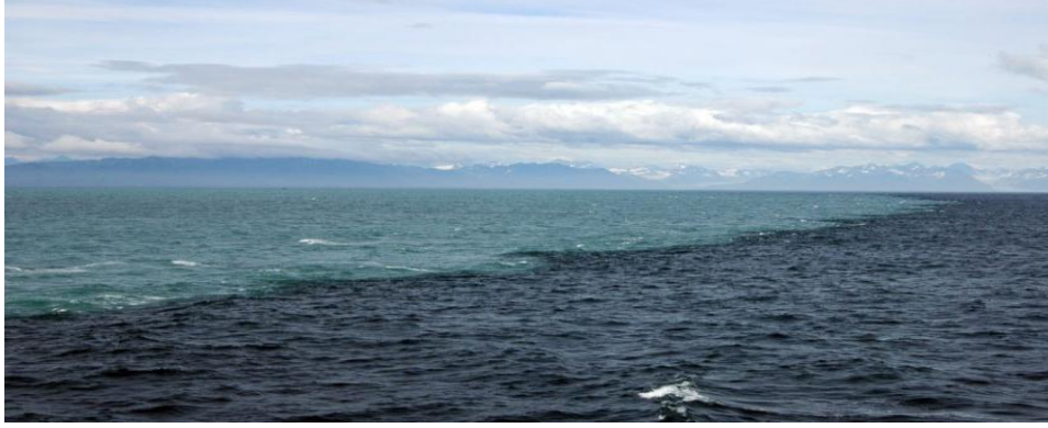
Şekil 12.2. Atlas Okyanusu ile Akdeniz’in birbirinden net bir sınırla ayrılması

Denizlerin karışmaması olayıyla ilgili bilimsel olarak da denizaltı araştırmaları ile ünlü, Fransız bilim adamı Kaptan Cousteau, Akdeniz’le Atlantik Okyanusu’nun kimyasal ve biyolojik yapı açısından farklılığını tespit etti. Bu olayın izahını yapmak için Cebel-i Tarık Boğazında çeşitli denizaltı araştırması yaptı bu araştırmalar neticesindeki tespitlerinde “Cebel-i Tarık boğazında, güney yakasında (Fas) ve kuzey yakasında (İspanya), deniz dibinden akıl almaz şekilde tatlı sular fişkırmaktadır. Her iki kıyının dibinden birbirlerine doğru 45 derecelik açılar halinde fişkiran bu dev su kanalları, tarağın dişleri gibi karşılıklı birer baraj oluşturur. Bu nedenle, ne Akdeniz Atlas Okyanusu’na, ne de Atlas Okyanus’u Akdeniz’e karışmamaktadır. 317 (Şekil 12.2.)