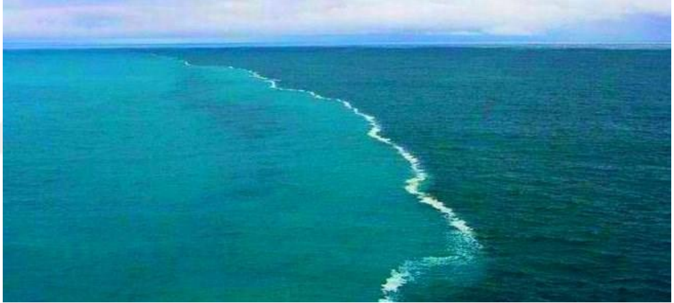
Şekil 12.1. Baltık Deniz'i ile Kuzey Deniz'inin kavuşması

5.) Diğer bazı âlimler ise; ayeti kerimede geçen suların, nehirlerin denize döküldüğü yerlerdir. Nehir suyu tatlı deniz suyu ise tuzludur. 306 (Şekil 12.1.)