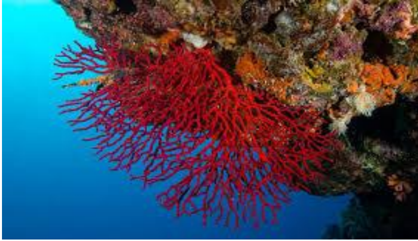
Şekil 10.4.2. Denizde Kırmızı Mercan Görüntüsü

Mercan da ilginç canlılardan sayılmaktadır. Denizlerde beş metre ile üç yüz metre arasında değişen derinliklerde yaşarlar. Vücudunun alt kısmıyla taş ve bitki gibi sabit maddelere yapışırlar. Ağız üst taraftadır, çıkıntılarla kaplıdır. Bu çıkıntıları beslenmek için kullanır. Deniz böcekleri gibi küçük canlılarla beslenir. Bu küçük canlılar bu çıkıntılara dokunduklarında hareketsiz kalırlar. Sonra bu çıkıntılar kasılarak ağza doğru eğilirler. Mercanlar üreyici hücreler salgılama yöntemiyle çoğalır. Mercanların başka bir üreme biçiminin de olduğunu söyleyenler vardır. Bu üreme biçimi ise tomurcuklanma yöntemiyledir. Meydana gelen tomurcuklar ana mercan ile birlikte kalırlar. Daha sonra bu tomurcuklar mercan ağacını oluştururlar. Bu ağacın kalın olan gövdesi dallanma noktasına yaklaştıkça incilir. En üst noktası son derece incilir. Mercan olarak adlandırılan değerli taşlar, hayvanın canlı kısımlarının yok oluşundan sonra geride kalan katı omurgalardan meydana geldiği söylenmektedir. 131 (Şekil 10.4.2.)