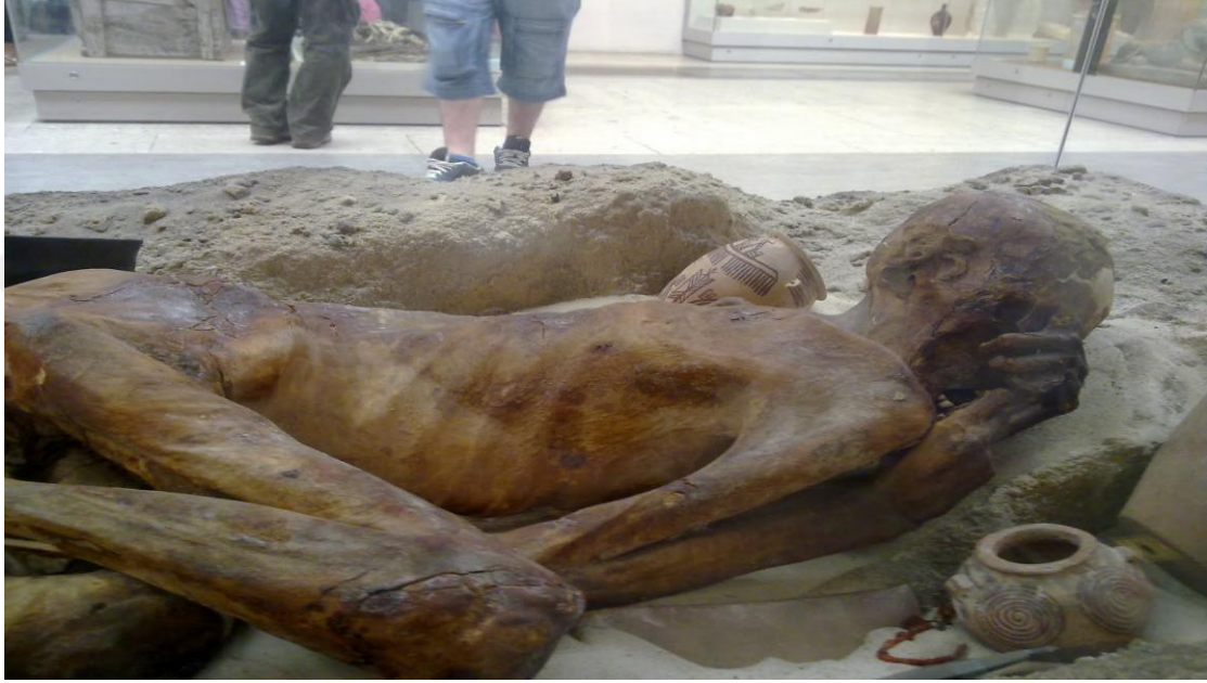
Şekil 11.1. Londra British Müzesi Firavun'un cesedi

“Ey Firavun! Senden sonra geleceklere ibret olması için, bugün senin bedenini (cansız olarak) kurtaracağız. İşte insanlardan birçoğu, hakikaten ayetlerimizden gafildirler.” 218 (Şekil 11.1.)