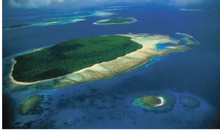
Şekil 1.1. Deniz görüntüsü

Deniz ve Okyanusların hacmi su dışında kalan karasal kütle için yaklaşık 14 katına eşdeğer olduğu saptanmıştır. Diğer taraftan denizlerin ortalama derinliği 3800 m. karaların ortalama yüksekliği ise 840 m. olarak tespit edilmiştir. Karasal kütle üzerindeki en yüksek noktayı oluşturan Everest Tepesi'nin yüksekliği 8882 m. olduğu halde okyanuslarda 12.000 metreye varan derinlikler ölçülmüştür. Bu verilerden de açıkça görülebildiği gibi okyanus ve denizler yeryüzünün esas unsurları, karalar ise bunları değişik genişlikte parçalara ayıran birer ada özelliğindedirler. 6