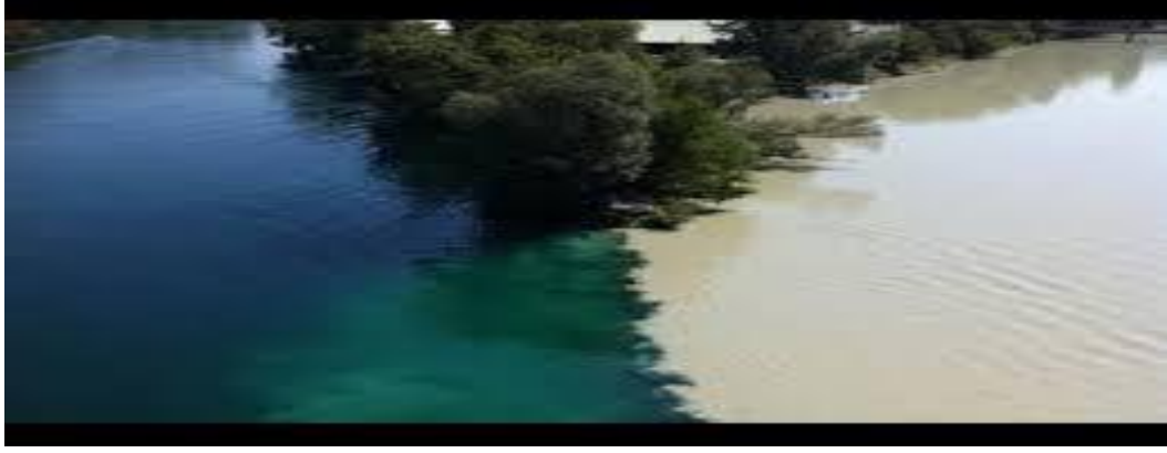
Şekil 12.3. Rhone ve Arve nehirleri arasındaki kavşak (Cenevre, İsviçre)

Bu konu hakkında aktardığımız görüşlerin dışında Bâtını ve mecazi görüşleri belirtenler de olmuştur. Bu görüşlerden de birkaç tanesini şöyle sıralayabiliriz: