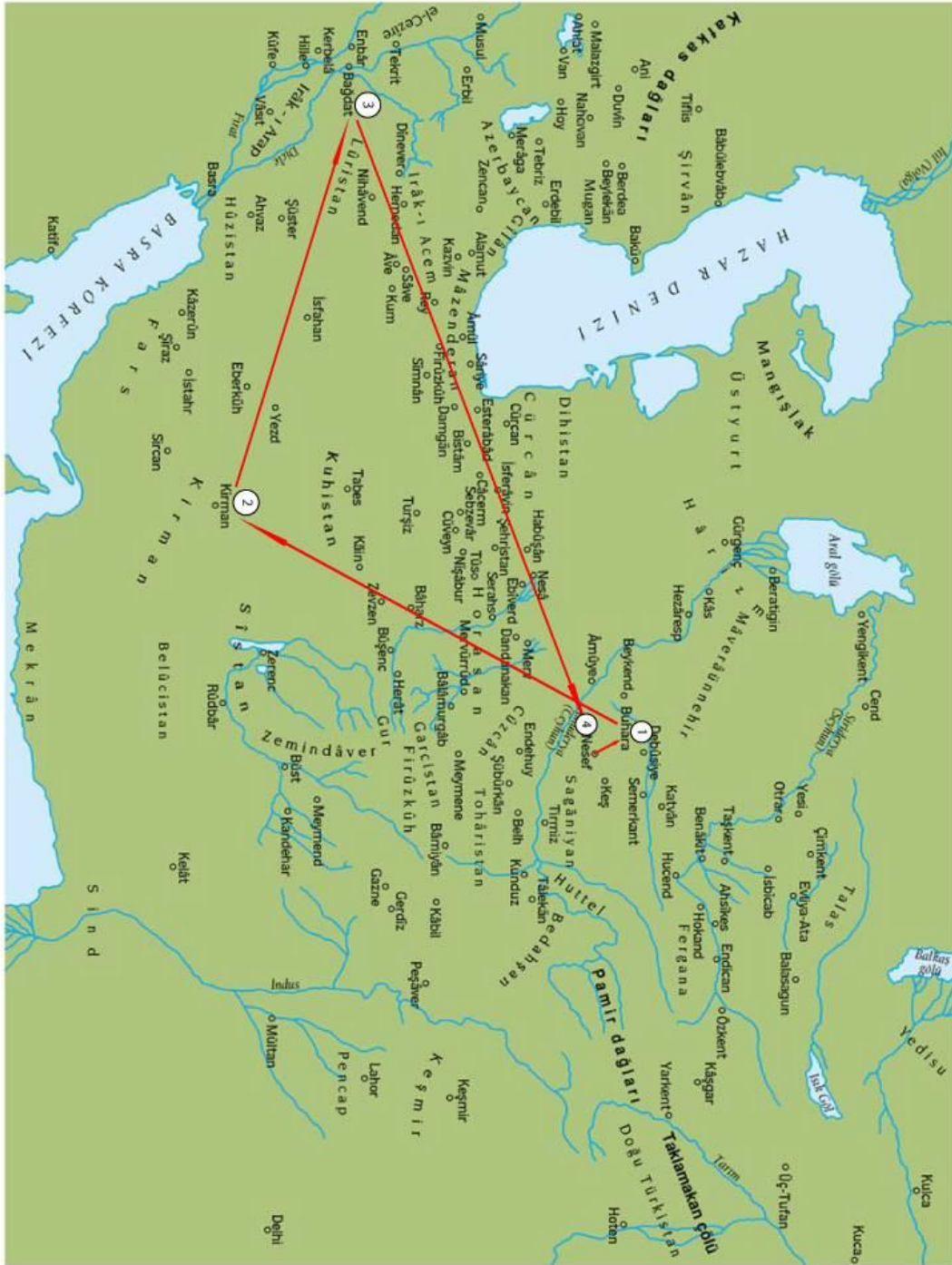
الشكل رقم (1) رحلات الإمام النسفي 250