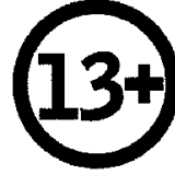
13 yaş ve üzeri için uygundur