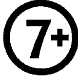
7 yaş ve üzeri için uygundur