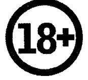
18 yaş ve üzeri için uygundur