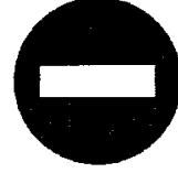
Olumsuz Örnek Oluşturabilecek Davranışlar