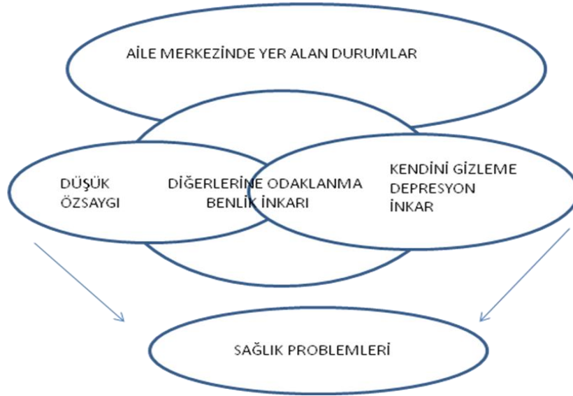
Şekil-1 Hughes Hammer ve Martsof İlişki Bağımlılığı Modeli, 1998