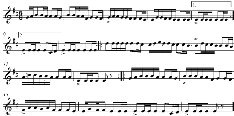
Şekil 7. Deneysel uygulamada kullanılan 2. okuma (solfej) parçası (Sevgi ve Tuğcular, 2002)