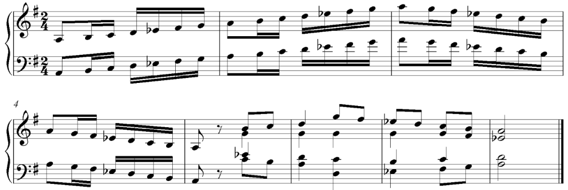
Şekil 4. La Karcıgar dizisi (Sun, 1998)