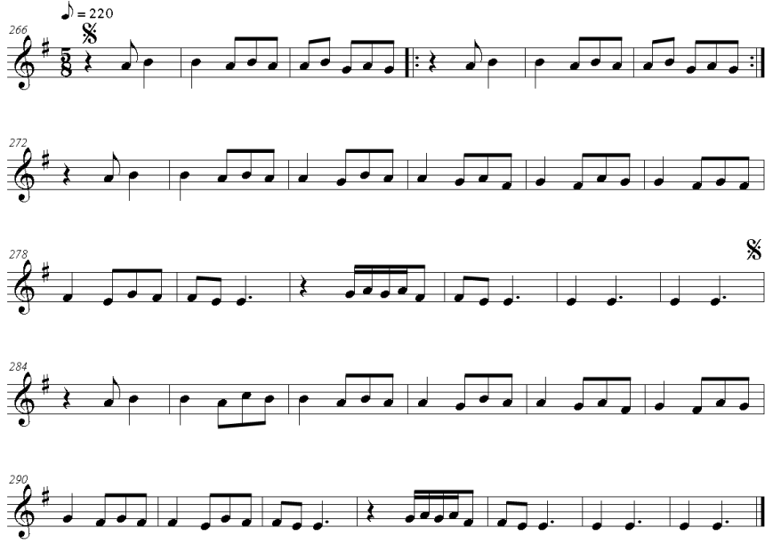
Şekil 11. Deneysel uygulamada kullanılan 3. işitme ve yazma (dikte) parçası (Yükrük, 2011)