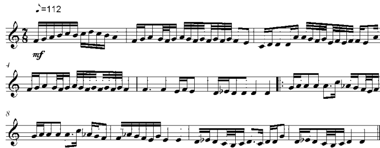
Şekil 8. Deneysel uygulamada kullanılan 3. okuma (solfej) parçası (Sevgi ve Tuğcular, 2002)