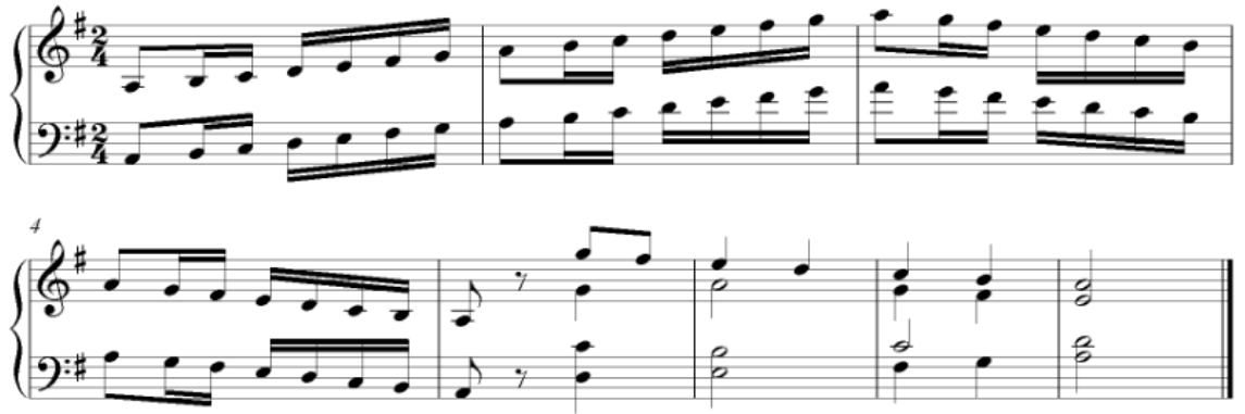
Şekil 3. La Hüseyini dizisi (Sun, 1998)