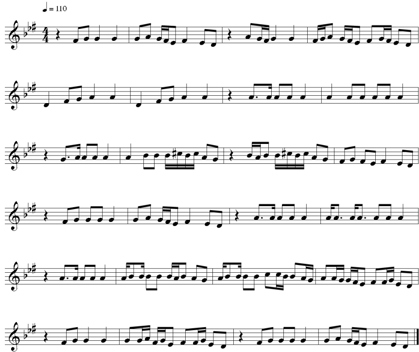
Şekil 12. Deneysel uygulamada kullanılan 4. işitme ve yazma (dikte) parçası (Yükrük, 2011)