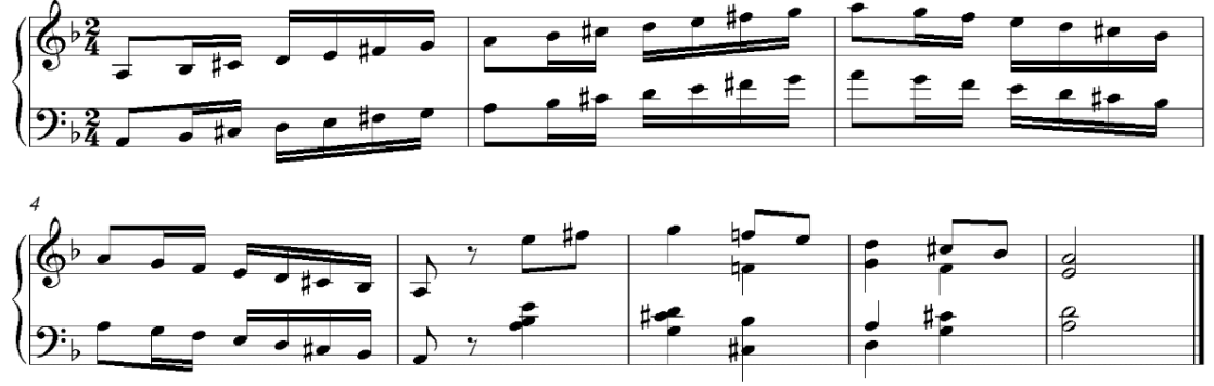
Şekil 2. La Hicaz dizisi (Sun, 1998)