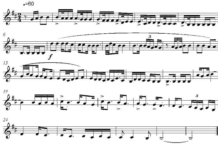
Şekil 6. Deneysel uygulamada kullanılan 1. okuma (solfej) parçası (Sevgi ve Tuğcular, 2002)