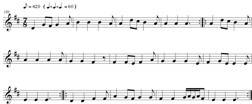
Şekil 10. Deneysel uygulamada kullanılan 2. işitme ve yazma (dikte) parçası (Yükrük, 2011)