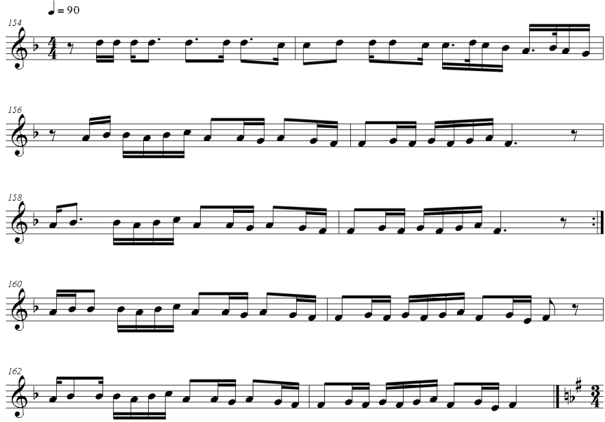
Şekil 9. Deneysel uygulamada kullanılan 1. işitme ve yazma (dikte) parçası (Yükrük, 2011)

Deneysel uygulamada kullanılan dikte parçaları ise Yrd. Doç. Dr. Hüseyin Yükrük'ün eğitim çalışmaları için hazırladığı halk ezgilerinden uyarlanan müzik parçalarından 40 tane seçilerek oluşturulmuştur. Deneysel uygulamada kullanılan dikte parçalarından 4 örnek parça aşağıda verilmiştir.