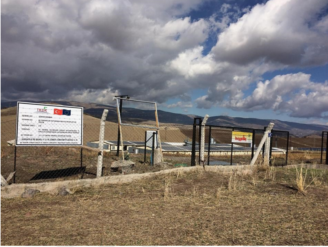
Resim 4.4. Gdl AB IPARD desteęiyle Karaman Broyler Tavuk retim iftlięi

Ankara'nın Gdl ilesinde kendi arazisi olan genç giriřimci AB IPARD desteęiyle Karaman Broyler Tavuk retim iftlięi, bina ile ekipmanın yapımının demesinden faydalanmıřtır. Bařta genç giriřimci masrafları karřılayıp faturayı sunduktan sonra % 75 desteęini EURO olarak almıřtır.