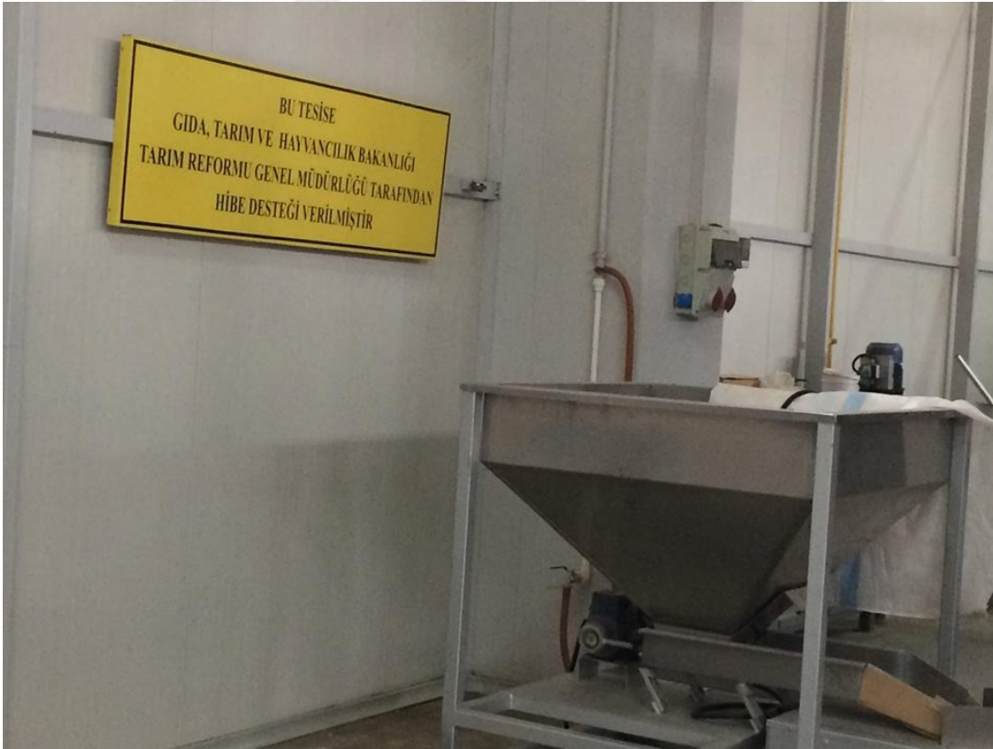
Resim 4.2. Kahramankazan Damla Gıda Şirketi desteği

Başvuruda 848.220,00 TL. Maliyet ile KDV hariç makinelerin fiyatının % 50 si olan 414.750,00 TL hibe ödemesinden faydalanmıştır.