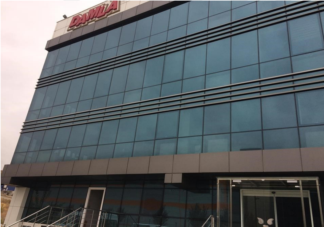
Resim 4.1. Kahramankazan Damla Gıda Şirketi