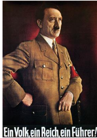
Resim 3.1. Tek Lider propaganda posterini

Hitler, Almanların kurtarıcısı ve Alman halkının Büyük Almanya'yı kurabilmesinin yegâne sağlayıcısıdır. Führer miti, Hitler için Goebbels tarafından kurgulanmış ve propagandanın bütün hallerinde işlenmiştir. Nazi Almanyası için en bilindik slogan, bu tarih için: "Tek lider, tek devlet, tek imparatorluk!" olmuştur. Bu slogan, Hitler'in konuşmalarına yansıttığı Tanrı Lider figürünün yaşayan hali olarak; caddelerde, sokaklarda, evlerde yani insanların olabileceği her yerde afişler ile görülmektedir. Aşağıda, bu afiş gösterilmiştir. Afiş, Hitler'in konuşmalarında değinilen "Tanrı Lider" anlayışının resmedilmiş halidir.