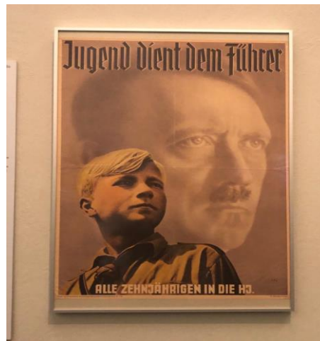
Resim 2. 2. Alman Tarih Müzesi, Berlin, 25 Kasım 2019 )

O dönemde aryan Alman ırkı yetiştirme stratejisi belirlenmiş ve bu yönde propaganda faaliyetleri yapılmıştır. Alman Tarih Müzesi incelemesinde fotoğrafladığım afişte; sarışın, renkli gözlü, sağlıklı Alman çocukların Hitler’in gölgesinde yetişeceği ve onun şahsında vücut bulmuş Büyük Almanya ideali resmedilmiştir. Bu dönemde Hitler, saf Alman ırkı yaratma stratejisini her alanda yansıtmıştır.