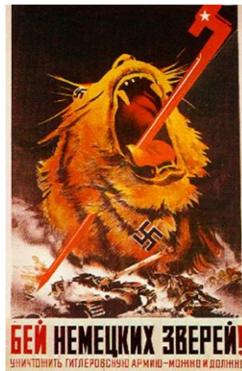
Resim 3.2. Alman hayvanlarla savaş! Hitler'in ordusunu yok edebiliriz ve yok etmeliyiz. http://www.allworldwars.com/Russian%20WWII%20Propaganda%20Posters.html (Erişim tarihi: 30.11.2019)

Konuşmaların dışında güçlü propaganda afişleri ile bu dönemde düşman algısı, kitlelerin bilinçaltına yerleştirilmiştir. Barış paktını bozarak Sovyetlere saldıran Hitler, bu tarihlerde yapılan propaganda afişlerinde düşman olarak resmedilmiştir.