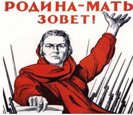
Resim 4.1. Vatan Ana Seni Çağırıyor ( http://www.allworldwars.com/Russian%20WWII%20Propaganda%20Posters.html ) Erişim: 30.12.2019