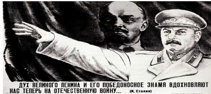
Resim 3.3. Büyük Lenin’in ruhu ve Victorious Bayrağı bize, Vatanseverlik Savaşı'nda savaşmamıza ilham veriyor." (Stalin) ( http://www.allworldwars.com/Russian%20WWII%20Propaganda%20Posters.html ) (Erişim tarihi: 20.11.2019)

Bu dönemde Rusya’da yapılan propaganda afişleri, Stalin’in söylemeleri ile benzerlik göstermiştir. Stalin’in konuşmalarında çok defa görülen Lenin liderliğine atıf, propaganda afişlerinde de yerini almıştır.