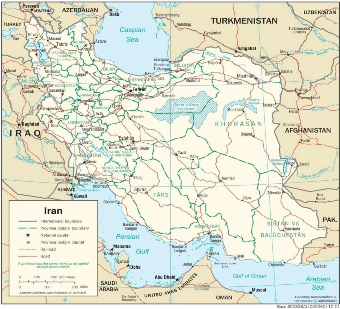
Harita 1.2 İran ve Komşuları 24

gelişmelerin mihenk taşı olan bir bölgedir. Ortadoğu özellikle Anadolu dünya hâkimiyetine yönelmek isteyen her devletin çözmek zorunda olduğu frigya kördüğümü gibidir yani, afro Avrasya kıtasına hâkim olmak isteyen her güç bu düğümü çözmek zorundadır. 23 İran'ın jeopolitik öneminin dahada artmasının mihenk taşı petrolün icadı ve Orta Doğunun petrol zengini bir bölge olmasının keşfidir. Gerek petrol zengini olması ve gerekse jeopolitik pozisyon olarak enerji nakil yollarında söz sahibi olabilecek pozisyonda olması İran'ın jeopolitik durumunu daha bir önemli hale getirmektedir.