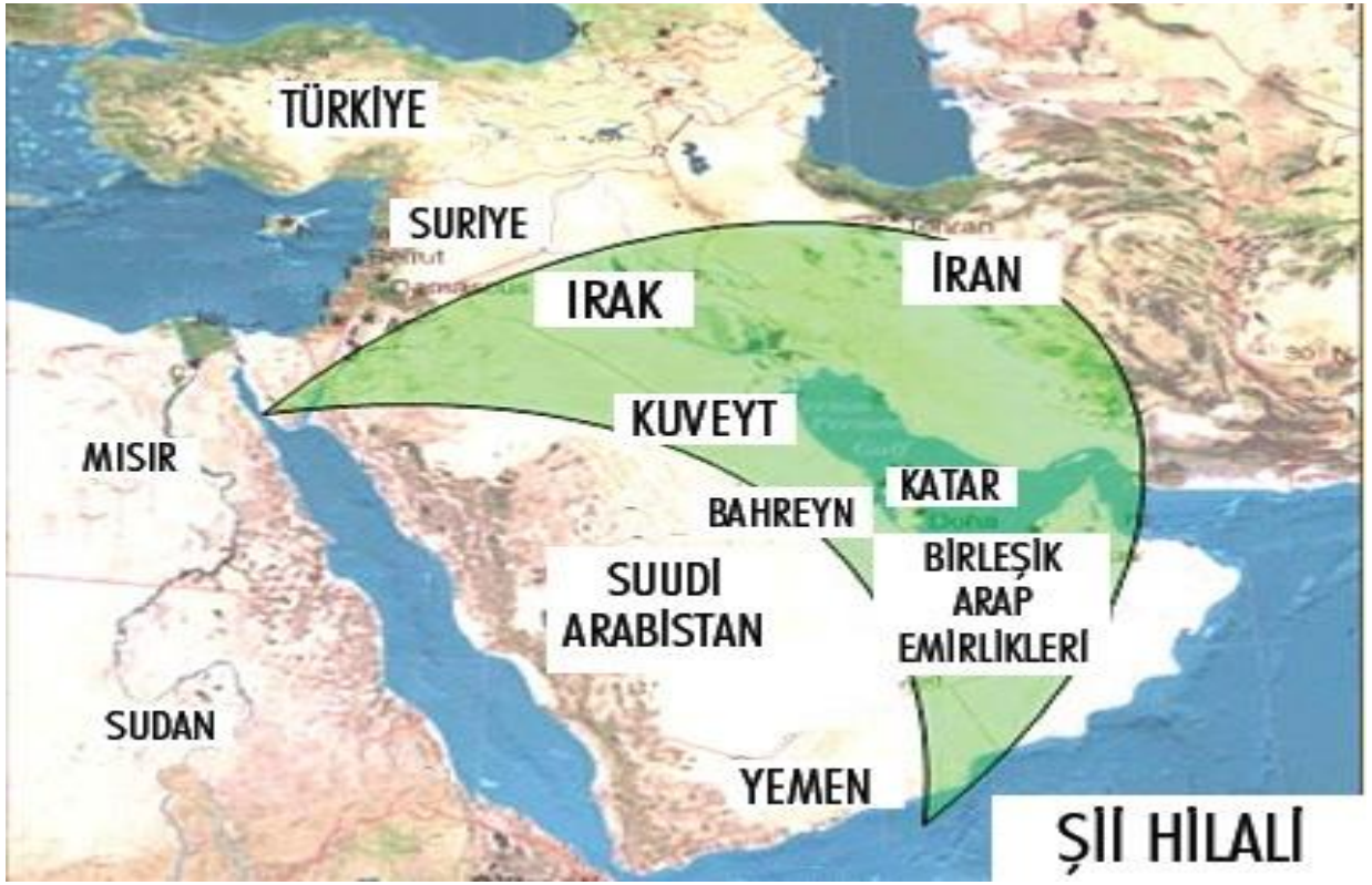
Harita 1.3. Şii Hilali Haritası 27

Resmi kayıtlara göre 76.807.000 nüfusa sahip olan İran 'ın inanç olarak yüzde 99'u Müslüman olsa da mezhep bazında yüzde 91'i Şii, yüzde 8'i ise Sünni'dir. Dünya üzerindeki Müslüman nüfusun ise yüzde 85'i Sünni, yüzde 15'i Şii'dir. Çoğunluk nüfusu Müslüman olan ülkelerden İran, Irak, Azerbaycan ve Bahreyn'de Şii nüfus ülke nüfusuna oranla çoğunluktadır. Orta Doğu'da nüfus yoğunluğuna göre bakıldığında yukarıdaki haritada da görüldüğü gibi Arap yarımadasını çevreleyecek şekilde İran'dan başlayan, Irak, Şii nüfus azınlıkta olsada yönetimi