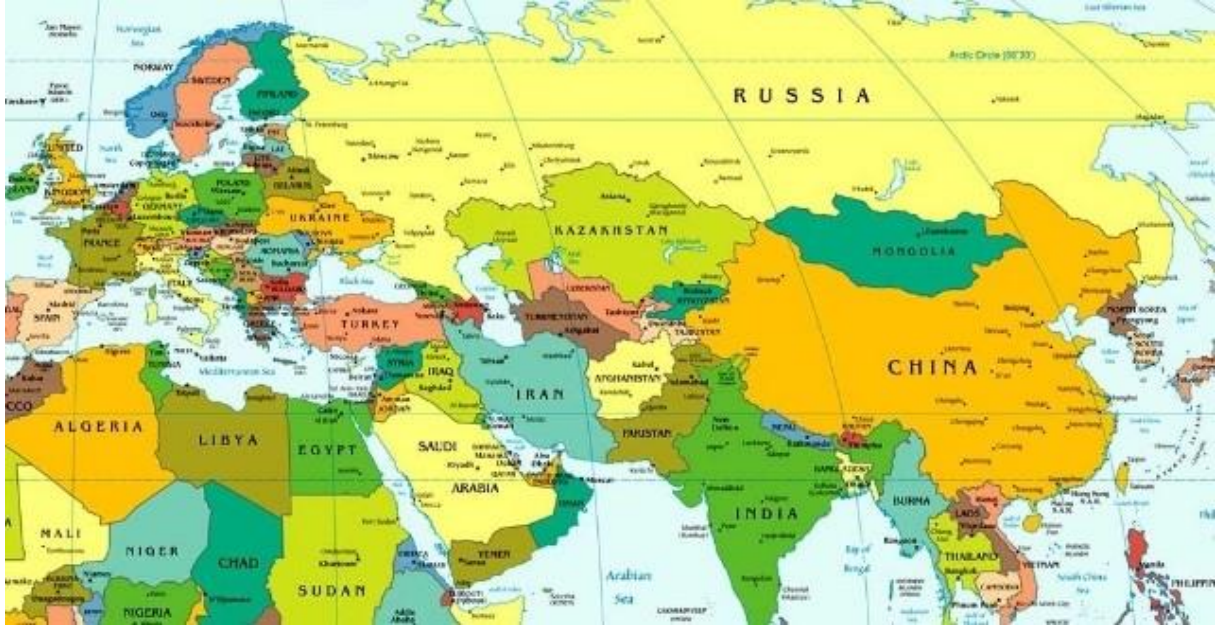
Harita 1.1. Avrasya Siyasi haritası 19

Bir ülkenin coğrafi konumu o ülkenin bütün dış siyasetini belirler ve dış politikada değişmeyen tek unsur coğrafyadır. 20 Bir ülkeyle ilgili yapılacak analiz eğer coğrafyası incelenerek başlarsa doğru neticelere ulaşma ihtimali daha yüksektir. Ülkelerin siyasi geçmişi coğrafyayla paralellik arz etmektedir. İran'ın dünya haritası üzerinde konuşlandığı pozisyona bakıldığında ne kadar önemli bir yerde olduğu görülmektedir. İran tarihten itibaren mevkii olarak en büyük toprak parçası olan Avrasya kıtasında doğu ile batının kesişme noktasındadır. Bu durum bilinen en eski tarihte kavim göçlerinin ve tarihi ipek yolunun güzergâhı olmasına sebep olmuştur. Jeopolitik düşünür Harold Mackinder'e göre Avrasya kilit dünya adası olarak tanımlanır ve bu dünya adasını yöneten dünyayı yönetir tezi mevcuttur. 21 Dünya nüfusunun yaklaşık % 75'i Avrasya'da yaşamakta ve dünyada bilinen enerji kaynaklarının dörtte üçüne sahip bir bölgedir.