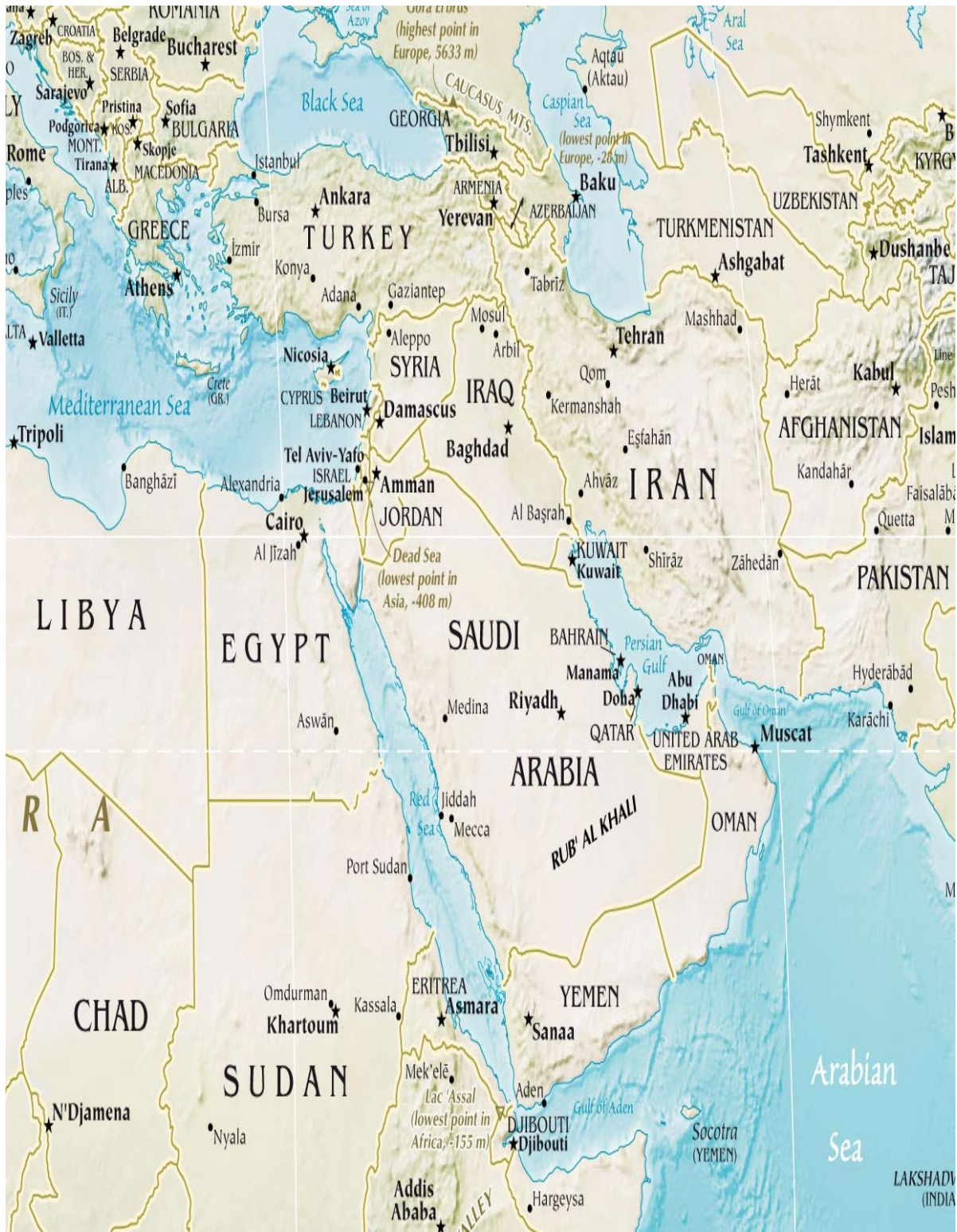
Ortadoğu Haritası (Harita-1)