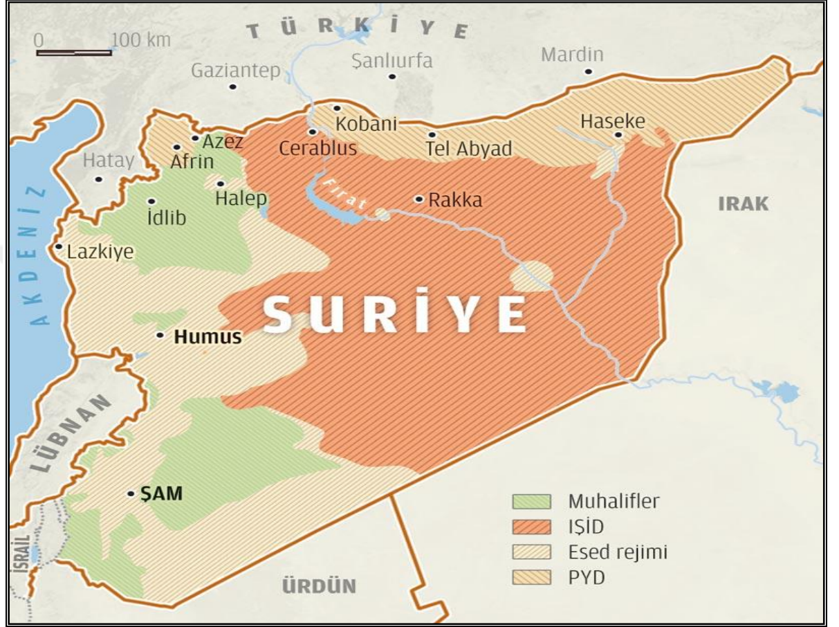
Şekil 3.PYD'nin Sınırları içine alacağı Cerablus Şehri

gözükmemektedir. Ekonomik anlamda Türkiye'nin önünde bazı açılımlarda olabilmektedir(TUSAM, 2015,283).