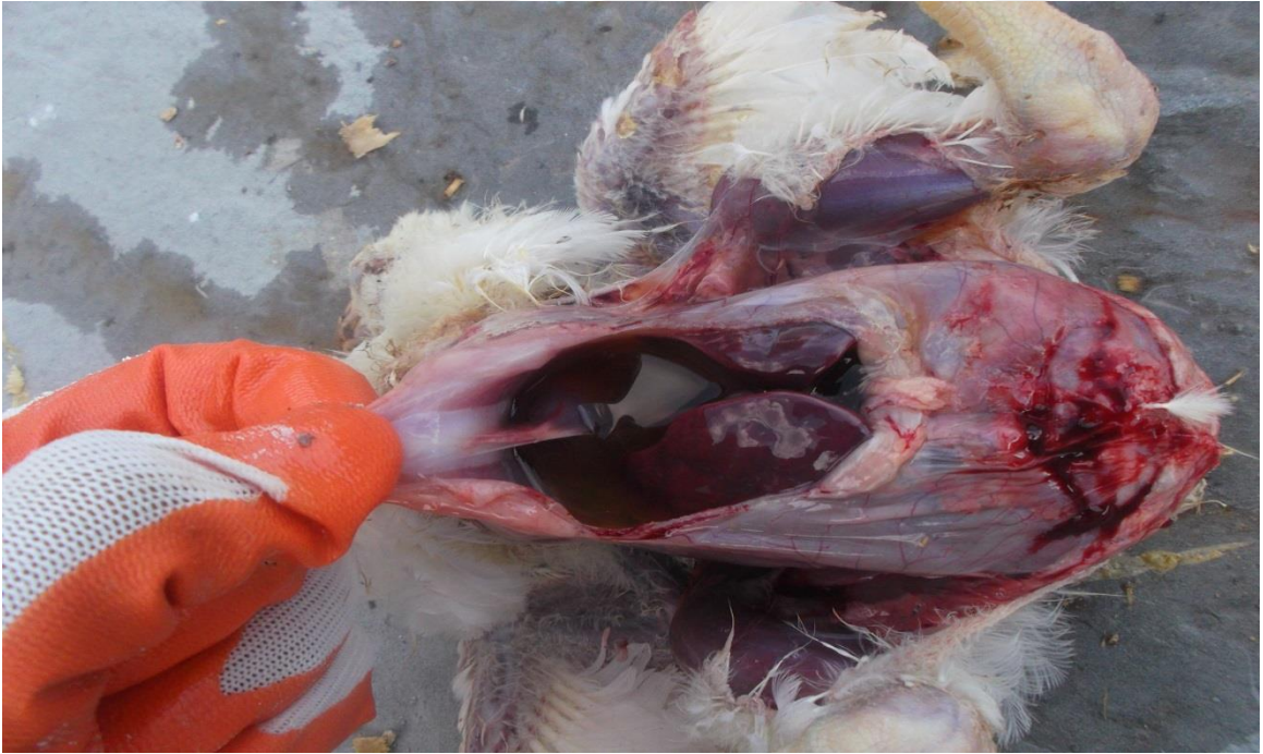
Şekil 5. Asites nedeniyle iç organlarda biriken abdominal sıvı