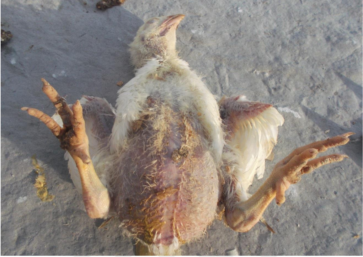
Şekil 2: Asites nedeniyle karın bölgesinde sıvı birikimi sonucu ortaya çıkan şişkinlik