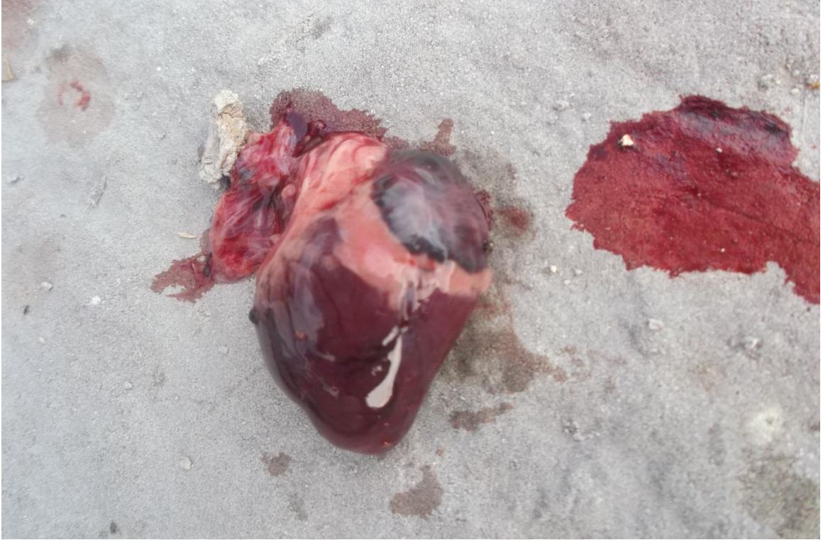
Şekil 6. Asitesin kalbe verdiği zarar