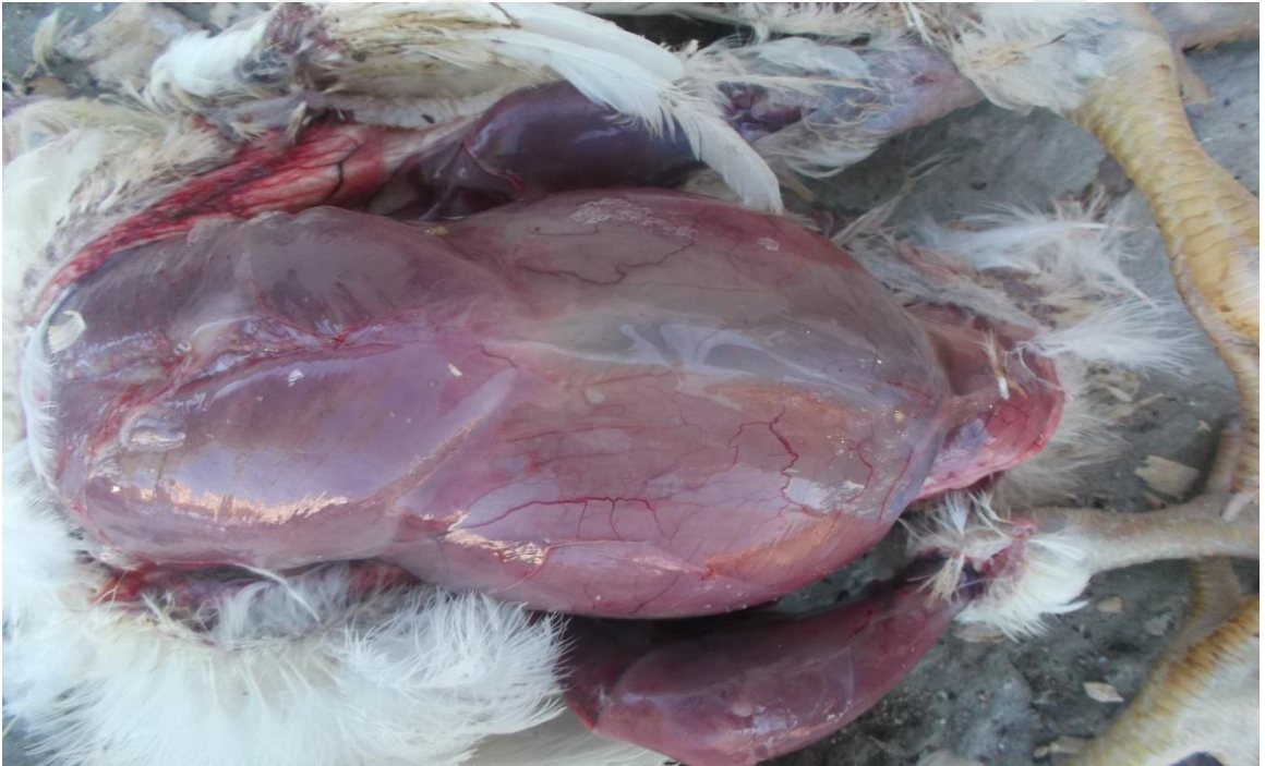
Şekil 7. Asites zararı