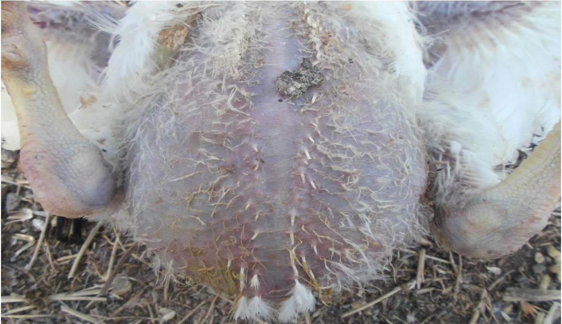
Şekil 3. Asites nedeniyle karın bölgesinde sıvı birikimi sonucu ortaya çıkan şişkinlik