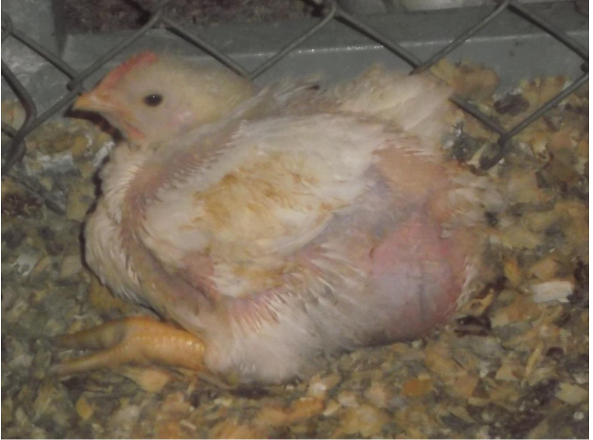
Şekil 1. Asites sorunu yaşayan civciv