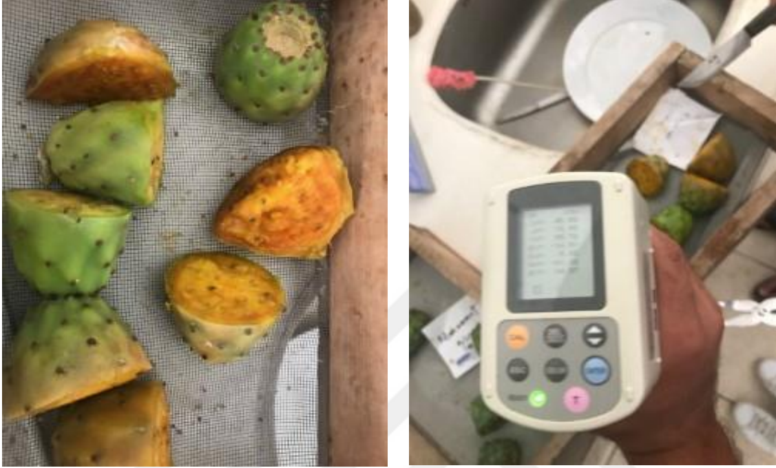
Şekil 3.2.2. Meyve kabuk ve et rengi ölçümü

renk düzleminde yapılmış ve L (100: beyaz, 0: siyah), a (+: kırmızı; -: yeşil) ve b (+: sarı; -: mavi) olmak üzere meyve kabuğu renk değerleri belirlenmiştir (Şekil 5).