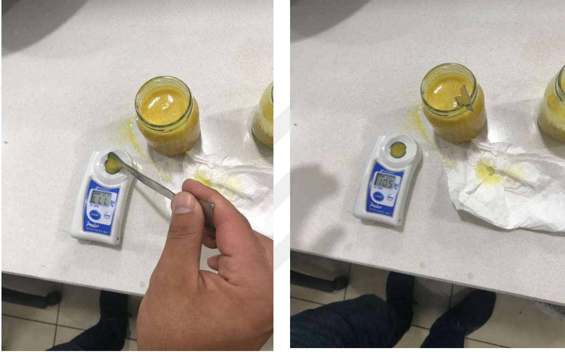
Şekil 3.2.4. Kuru madde tayini

Mersin ve ilçelerinden 14 farklı dikenli incir genotipine ilişkin suda çözünür kuru madde miktarı ölçümü için dikeli incirlerin suları sıkılarak meydana gelen meyve suyunun suda çözünebilir kuru madde miktarı portatif hassas ( \pm 0,01 ) (ATAGO MASTER-53S) refraktometre yardımıyla belirlenmiştir (Şekil 7).