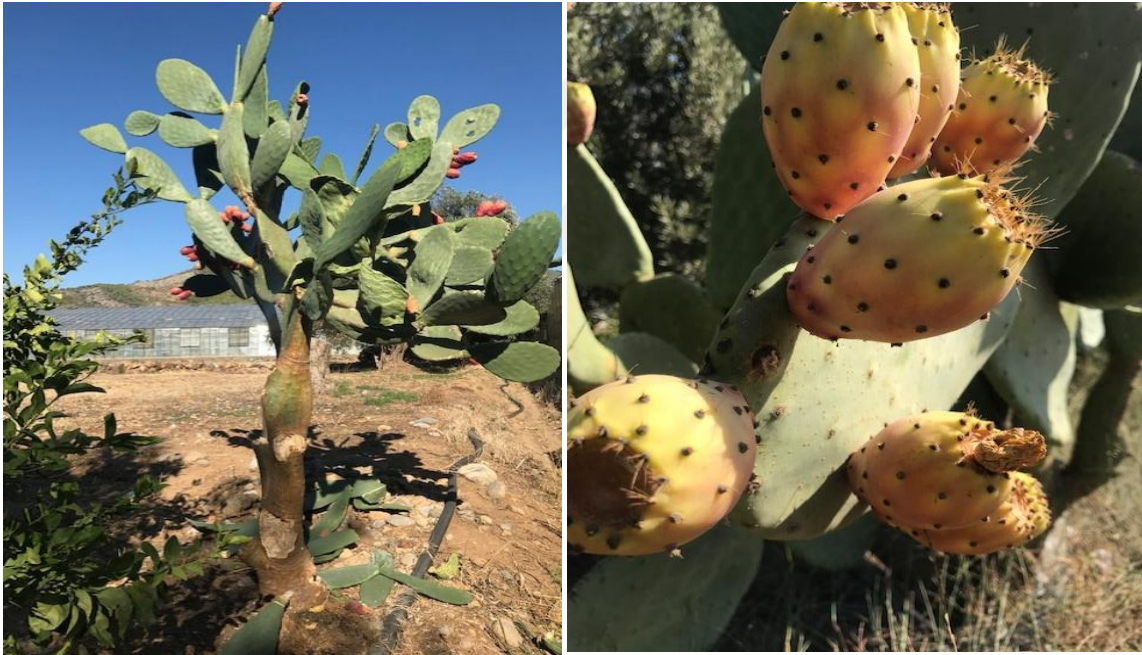
Şekil 3.1.2. Genotiplerin toplandığı bazı lokasyonlar