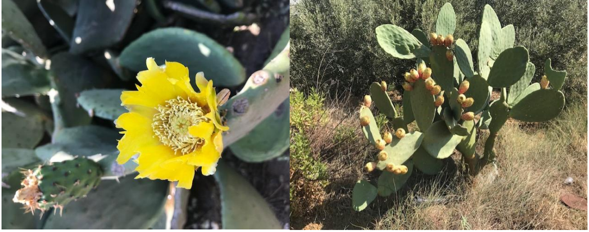
Şekil 3.1.1. Genotiplere ait bazı resimler