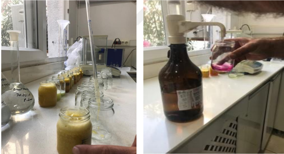
Şekil 3.2.3. TA tayini

Mersin ve ilçelerinden 14 farklı dikenli incir genotipine ilişkin titre edilebilir asit miktarı ölçümü dikenli incirlerin suyu sıkıldıktan sonra süzölmek suretiyle meyve suyundan alınan 5 ml içine 100 ml saf su eklenmiştir. Ardından yeterli miktarda fenolftalein eklenip 0,1 N'lik NaOH yardımıyla meyve suyunun renginin pembe-kırmızıya dönene kadar titre edilmiştir. Harcanan NaOH miktarı belirlenerek elde edilen sonuç sitrik asit cinsinden hesaplanmıştır (Şekil 6).