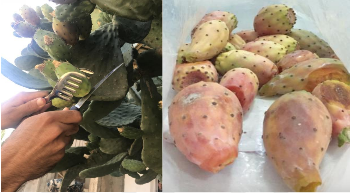
Şekil 3.1.3. Meyve örneklerinin hasadı ve ambalajlama

sabahları erken saatlerde maşa ve bıçak yardımıyla kledottan meyveleri ayırarak yapılmıştır. Alınan örnekler etiketlendikten sonra polietilen torbalara; polietilen torbalar da karton kutulara konularak (Şekil 3) en hızlı bir şekilde Alata Bahçe Kùltürleri Araştırma Enstitüsü (Erdemli-Mersin) laboratuvarlarına aktarılmıştır.