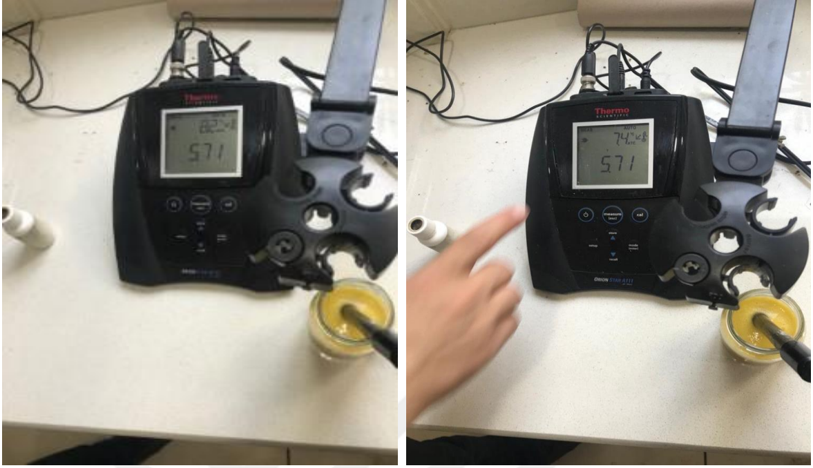
Şekil 3.2.5. pH tayini