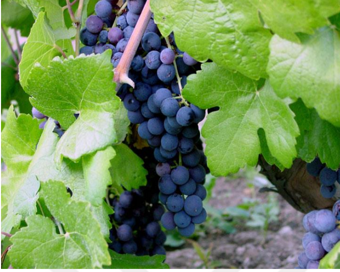
Şekil 3.2. Banazı Karası