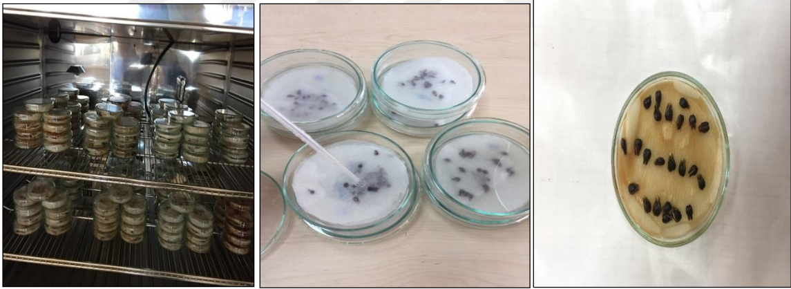
Şekil 3.18. Çimlendirme denemesinin kurulması

Farklı dozlarda hormon uygulaması gerçekleştirilmiş deneme materyalleri çimlendirme testlerine tabi tutulmuştur. Çimlendirme işlemi, içine daha önceden dezenfekte edilmiş iki adet filtre kağıdı konan 9 cm'lik petri kaplarında yapılmıştır. Her petri kabına 3'er tekrürlü ve her tekrürde 10'ar adet tohum olmak üzere toplam 30 tohum kullanılmıştır. Böylece hem katlamalı hem de katlamasız olmak üzere her bir üzüm çeşidine ait 540 adet tohum çimlendirme testine tabi tutulmuşlardır. Her uygulama için her bir petri kabında 30'ar tohum olmak üzere toplamda deneme için 180 adet petri kabı kullanılmıştır (Şekil 3.18).