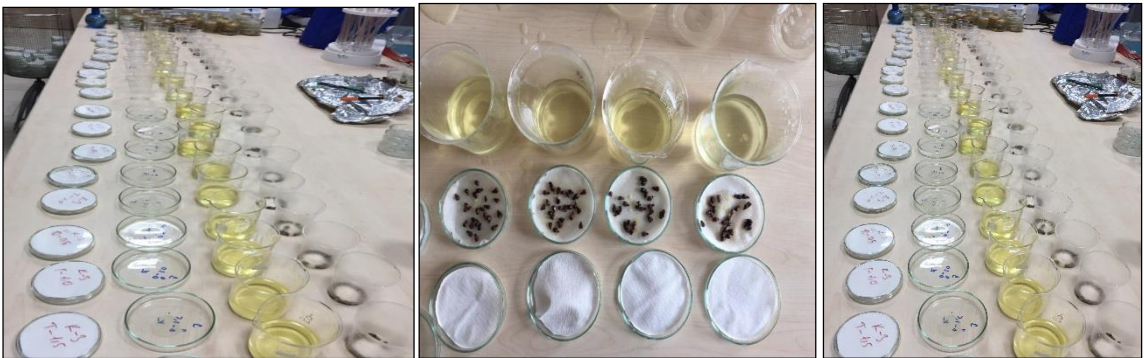
Şekil 3.15. Tohumlarda dezenfeksiyon işlemi

Çimlendirmede kullanılacak filtre kağıtları, 9 cm çapındaki petri kaplarının boyutuna uygun olacak şekilde kesilerek hazırlanmıştır. Çimlendirme denemelerinde Besni, Banazı Karası, Köhnü, Red Globe, Müşküle, Öküzgözü, Boğaz Kere, Mezrone ve Ağın Beyazı çeşitlerinin katlamalı ve katlamasız olarak kullanılmıştır. 180 petri kabının (10 çeşit x 4 doz x 3 tekrar 1 kontrol grubu) denemede kullanılacak tohumlar ön işlemler öncesi % 3'lük Sodyum hipoklorit (NaClO)'te 5 dk bekletildikten sonra çeşme suyuyla duruladıktan sonra saf suyla yıkanıp temizlenmiştir. Ayrıca çimlendirme testlerinde kullanılan ortam, malzemeler ve petri kapları testten önce etil alkolle steril edildikten sonra saf suyla yıkanmıştır (Şekil 3.15).