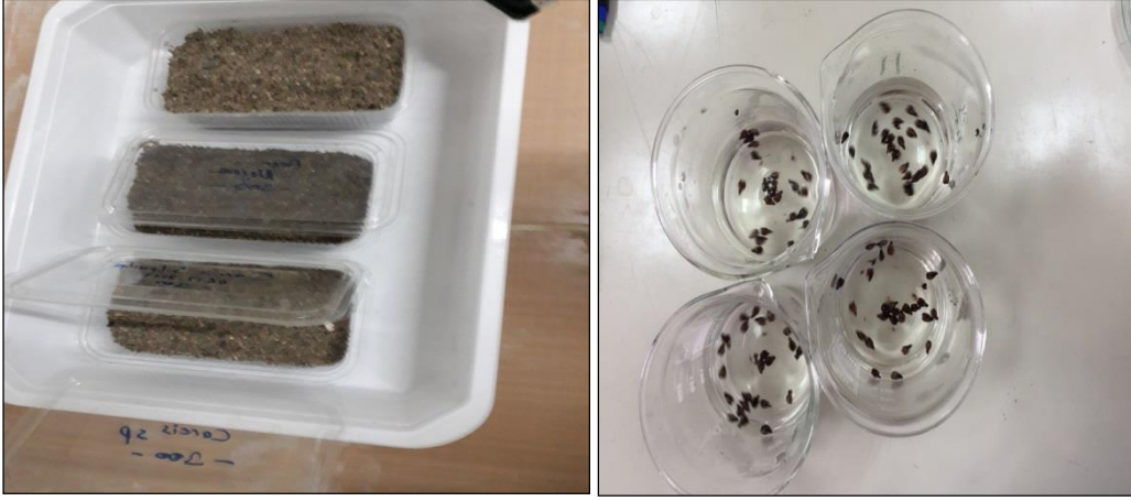
Şekil 3.14. Tohumların katlamadan çıkarılması ve yüzdürme testine tabi tutulması