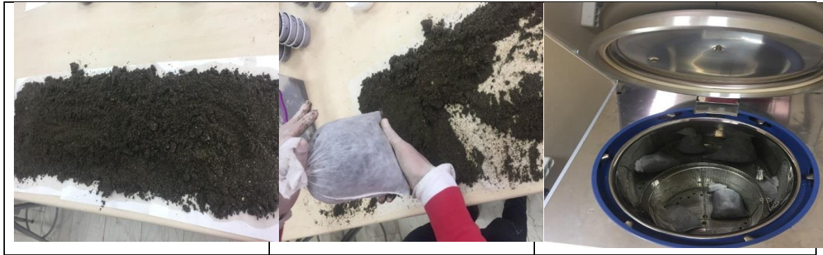
Şekil 3.12. Katlama ortamının dezenfeksiyonu

Hibrit tohumlar mantari enfeksiyonlara karşı fungusitle ilaçlanmış (Şekil 3.13) ve ardından katlama ortamına serilmişlerdir. Tohumların üzeri nemli dere kumu ile örtüldükten sonra, sıcaklığı +5 (\pm 1)^{\circ}\text{C} 'ye ayarlanmış soğuk hava deposunda yaklaşık üç ay süreyle bekletilmek suretiyle katlama işlemi gerçekleştirilmiştir (Barış 1985, Can 1983, Ağaoğlu 2002).