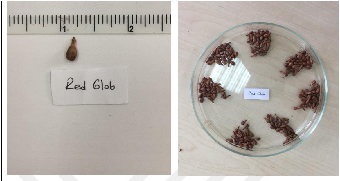
Şekil 3.11. Meyve etinden ayrılmış tohumların ambalaj ve muhafazası