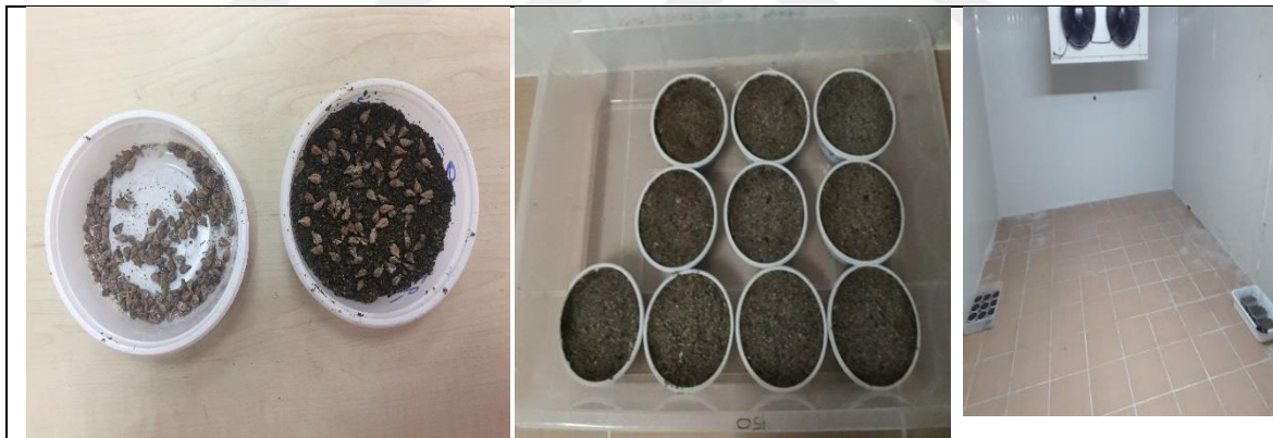
Şekil 3.13. Katlamaya alınmış tohumların soğuk hava deposunda muhafazası

Hibrit tohumlar mantari enfeksiyonlara karşı fungusitle ilaçlanmış (Şekil 3.13) ve ardından katlama ortamına serilmişlerdir. Tohumların üzeri nemli dere kumu ile örtüldükten sonra, sıcaklığı +5 (\pm 1)^{\circ}\text{C} 'ye ayarlanmış soğuk hava deposunda yaklaşık üç ay süreyle bekletilmek suretiyle katlama işlemi gerçekleştirilmiştir (Barış 1985, Can 1983, Ağaoğlu 2002).