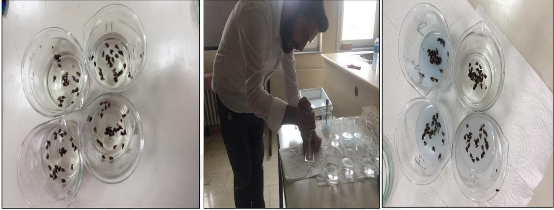
Şekil 3.16. Çözeltinin hazırlanması ve tohumların çözeltiliye bırakılması

Denemede kullanılan östrojen ve testesteron hormonları kontrol dahil 5 farklı dozda hazırlanarak (0,0 ppm, 0,5 ppm, 1,0 ppm, 1,5 ppm ve 2,0 ppm) hormon uygulaması gerçekleştirilmiştir (Şekil 3.16).