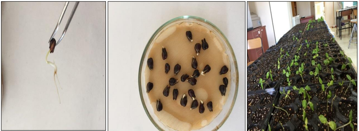
Şekil 3.20. Çimlenmiş tohumlar ve çıkış testlerinin uygulaması

Kökçüklerine zarar vermeyecek titizlikte çimlenmiş tohumlar daha önceden hazırlanmış ve içerisine 1:1:1 oranında perlit torf ve cocopet konulmuş viyollere ekim işlemi gerçekleştirilmiştir (Şekil 3.20).