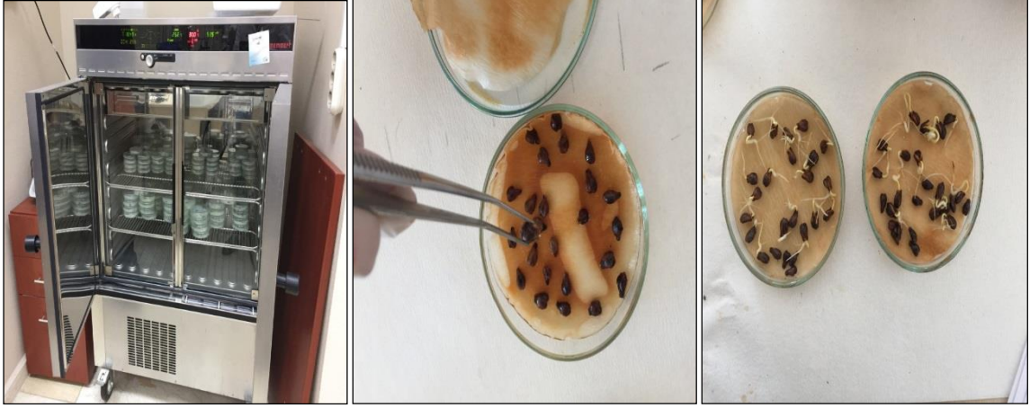
Şekil 3.19. Tohumların çimlendirme denemesine alınması

Çimlendirme testleri süresince tohumların nem düzeylerini belirli bir seviyede tutmak amacıyla belli aralıklarla tohumlar daha önce strelize edilmiş saf su ile nemlendirilmiştir. Ayrıca çimlendirme testi süresince deneme materyallerinin mantari enfeksiyonlara karşı korumak amacıyla her hafta ve haftada 1 kez olmak üzere fungusit uygulaması yapılmıştır. Çimlendirme denemesine 02.07.2018 tarihinde son verilmiştir.