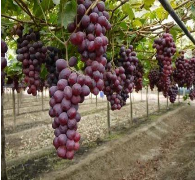
Şekil 3.5. Red Globe