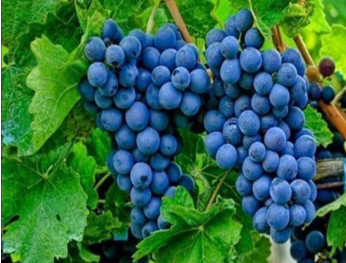
Şekil 3.3. Köhnü