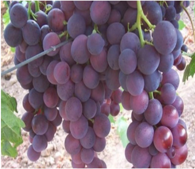
Şekil 3.4. Cardinal